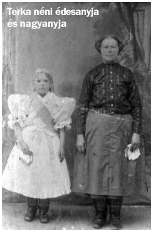
Terka néni édesanyja és nagyanyja