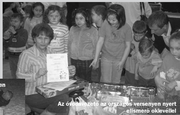
Az óvodavezető az országos versenyen nyert elismerő oklevéllel