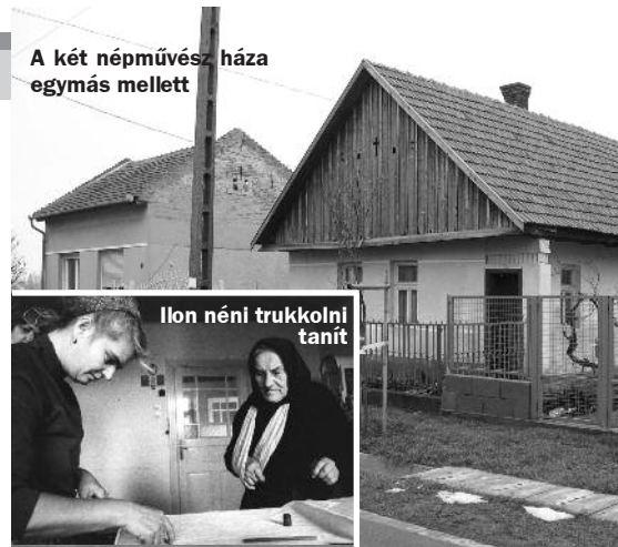
Ilon néni trukkolni tanít