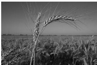
A természet ajándéka

állatok. A növények körülöttünk ugyanúgy végzik életfunkcióikat, azaz lélegeznek, táplálkoznak, ürítenek, szaporodnak és védekeznek támadóik ellen, mint mi. Ők is mozognak, harcolnak az életet adó napfényért, hajlanak és tekerednek. Az állatok hűsleges társai, túlnyomórészt táplálják őket, az állatok cserébe segítik szaporodásukat, széthordják virágporukat és magvaikat. A törékeny emberi élet pedig, a minket körülvevő flórától és faunától egyaránt függ!