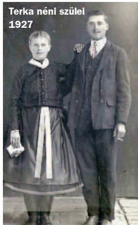
Terka néni szülei 1927