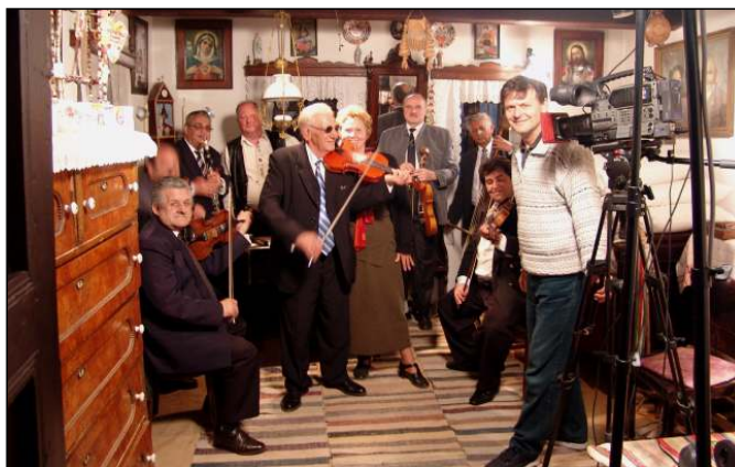
A Tosko, az utolsó turai cigányprímás forgatásán