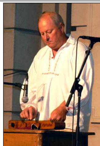
A Faluforduló színpadán a Néprajzi Múzeumban

– Utaltál rá, hogy gyermekeid is a hangszeresek, a népi zenekultúra bűvöletében élnek. Nem gondoltál még arra, hogy egy Gólya zenekar, vagy akár Loby Banda is alakulhat a család közreműködésével?