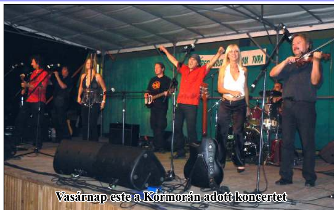
Vasárnap este a Körörmorán adott koncertet