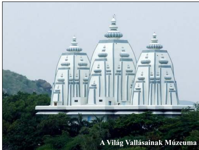
A Világ Vallásainak Múzeuma

Rengeteg ember mindenütt, hasonló ruhákban, mint mi, de az indiai nők megannyi más színnel, mint a virágok a réten. Akik elhaladnak mellettünk, összeteszik a kezüket, mintha imádkozni akarnának, és kis fejhajlással, nagyon kedves mosollyal köszönnek: „Szajram!” Megpróbálok viszonzni, ám érzem, kissé sután teszem. De annyian rám köszönnek, hogy bőven tudom gyakorolni. Az út mellett egymás után kis mandírok. Kápolnákra hasonlítanak, de ezek sokkal cifrábbak, különféle indiai isteneket ábrázoló szobrokkal. Rengeteg a virágfüzér; a füstölőtartókban megannyi illatos füstölő, a bejáratok felett sok csengő, amit a ki-be jövők meg-megcsengetnek. Ez a színes kavalkád, illatok, a gyönyörű csengettyűhangok, a fák sűrű koronáitól láthatatlan madarak hangos csivitelése egy-