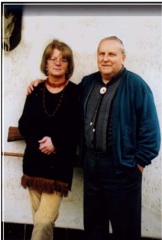
A galábsi házikó és lakói. Az épület kívül-belül a természet szeretetéről tanúskodik