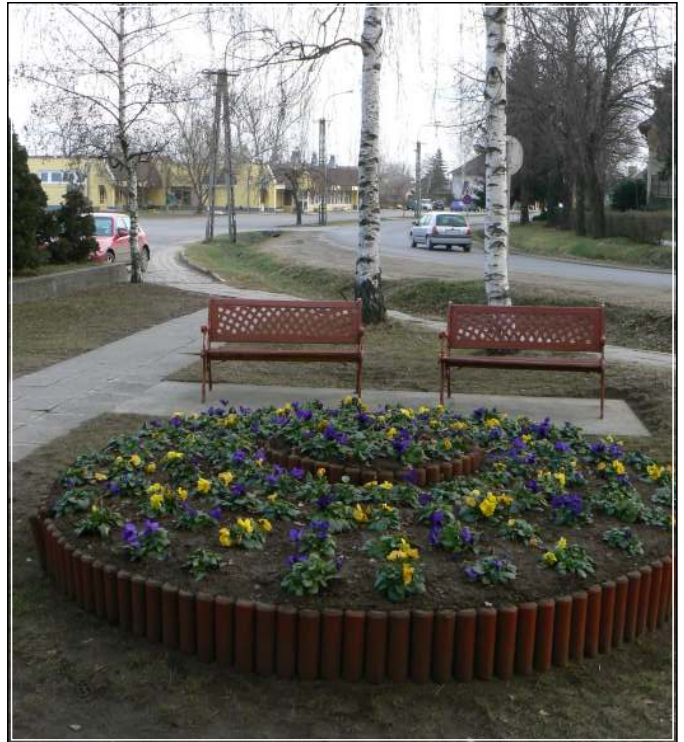
Csinos pihenőpark a Turai Takarékpénztár székháza előtt. Folytatása következhet

Fél évre meghosszabbították a KÖVI-SEC Bt.-vel megkötött, a Kossuth Lajos u. 163. szám alatti helyiségre vonatkozó helyiségbérleti szerződést. A testület hozzájárulását adta, hogy a bérleményt a távfelügyeleti szolgáltatási feladatok ellátásában közreműködő VVCentral