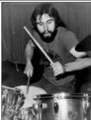
1978. február 25-én a Só együttes dobosaként

kari felszereléssel, amiért többen vetélkedtek. Mi négyen álltunk össze, és mi kaptunk lehetőséget a zenélésre, ugyanis a zenekarok vetélkedőjét mi nyertük meg. Így együtt tudtunk maradni és első zenekar itt alakult meg Sámán néven, amiben volt egy basszusgitáros, szólógitáros, billentyűs és jómagam mint dobos. Ekkor már Kőszegi Imrénél tanultam dobolni Budapesten, a Szófia utcában. Hítre vettem egy