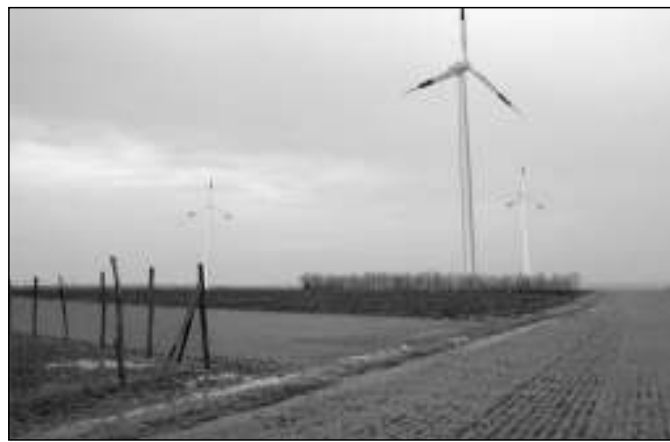
Az 5, 6, 7-es szélerőművek nézete a 220 kV-os távvezeték alól déli irányba

- A gépek közötti kapcsolatot csak földkábelrel lehet megoldani, ami jelentős többletköltséggel jár a légkábelhez képest.