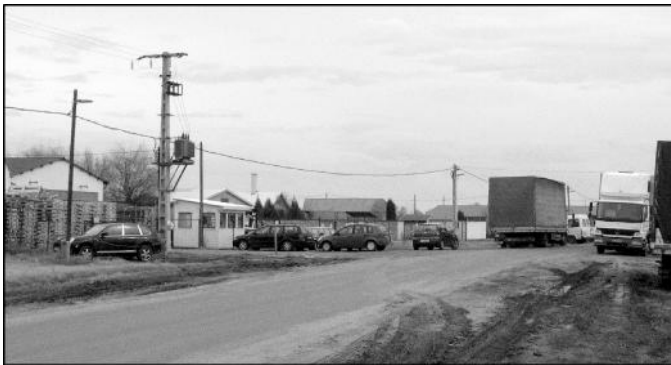
Az ipartelep forgalmát sebességkorlátozó és megállást tiltó táblákkal szabályozza az önkormányzat