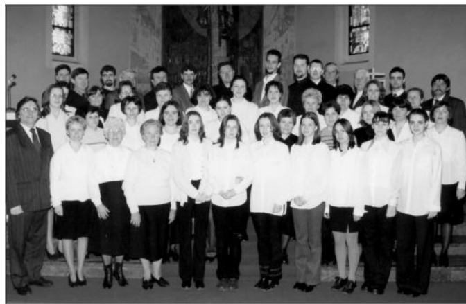
A turai Nagyboldogasszony Plébániatemplom énekkarával