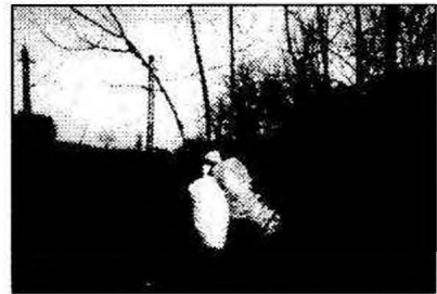
A szemétszákolás profi módja – lenne. A kép azonban nem a hulladéklerakónál, hanem a vasúti töltés mellett készült.

A turaiak általában igényesek környezetükre, de azért akad ellenpélda is, mint azt a képek is tanúsítják. Egy biztos: a szépség munkával jár. Mi pedig néha – merő önzésből – hihetetlenül kényelmesek tudunk lenni. Ezen kell túllépnünk. Nem csak a Föld napján.