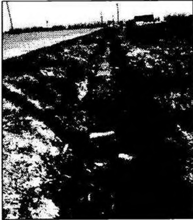
Új vásártér. Az árok tele szeméttel. A vízelvezetési és neveltetési problémák adottak.

Divatos szó lett a környezetvédelem. Popsztárok koncerteznek az esőerdő-kéért, újrahasznosítható anyagokba csomagolják a fogyasztási cikkeket, famentesek a könyvlapok, freontalanítják a dezodorokat, egyszóval globális védőmunka folyik. Ez hasznos, humánus. Éppen csak nincs köze a hétköznapokhoz.