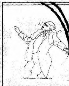
A képek a turai művelődési ház 1997. február 2-i programján készültek.

Köszönetet mondunk Huszárik Jánosné Marica néninek fia grafikaiknak rendelkezésünkre bocsájtásáért. Összeállította: Seres Márta és Seres Tünde