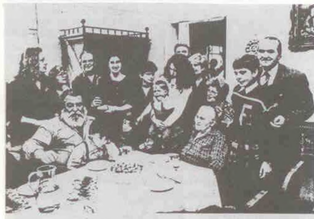
A 80 éves Sárrika néni köszönti a családot.