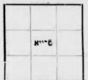
דאס געוואסענע פערל

בעזענעט מיט נעלד, אין דער ווייניק צוואר. דאסס אים נאנטן באר דער מינצען פֿינעצן אונד זעכס גלייכע שייקק ווערדען שאן פלאצירט. בעמעקט דער ווייר: דאסס דאס מיטפעלדער בלייבט אונט נעלד; דיעזעס אליין זייא נאנין לענד אינד נאנין פרייה. ווייר האבען אלוף פיער ווייניק; אויף יעדער הייר קאסטען דרייא פעלדער צו שטעהן, וויא אבען קלאר איזש צו זעהן. אין יע צוואסטען דרייא פעלדער צו לעגען זייא דיעראט גערשטיקק אויף שייקק, דאסס נארד דרייאנדצוואנציג איהרע זאהל בעשראנע, יעדעס פערל, דעסס' לאנע אין דען ווינקל גענוצט ערשיינט, ווערדע בעזענעט מיט דער נאמליכען צאהל; גלייך מיט ויין אונטעראל אים ווינקל דער בעשראנע אונד עבענד גלייך נאן אין יעדעס איהרע פיער אונטונען פעלדער הייר. דיא ציפטער נאן שטעלען. דארום ווייר דערלעקן; פאן דען ניין פעלדערן זייא איינעס פאלשלאנדני פרייה; פאן דען אכט איבונגען מיטס אין יע פיער לייענע נאנין דיא גלייכע אנצאהר, נון פראכט עס איינמאל!