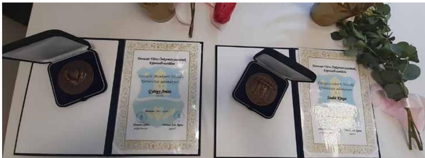
Szociális munkáért Nívó díj és Közigazgatásért Nívó díj