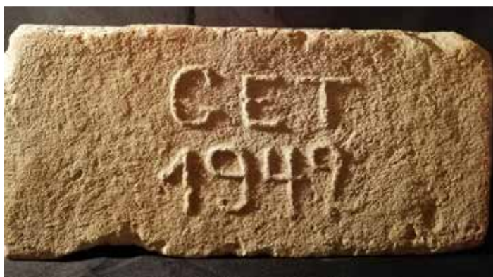
Gróf Esterházy Tamás kisméretű falazótéglája