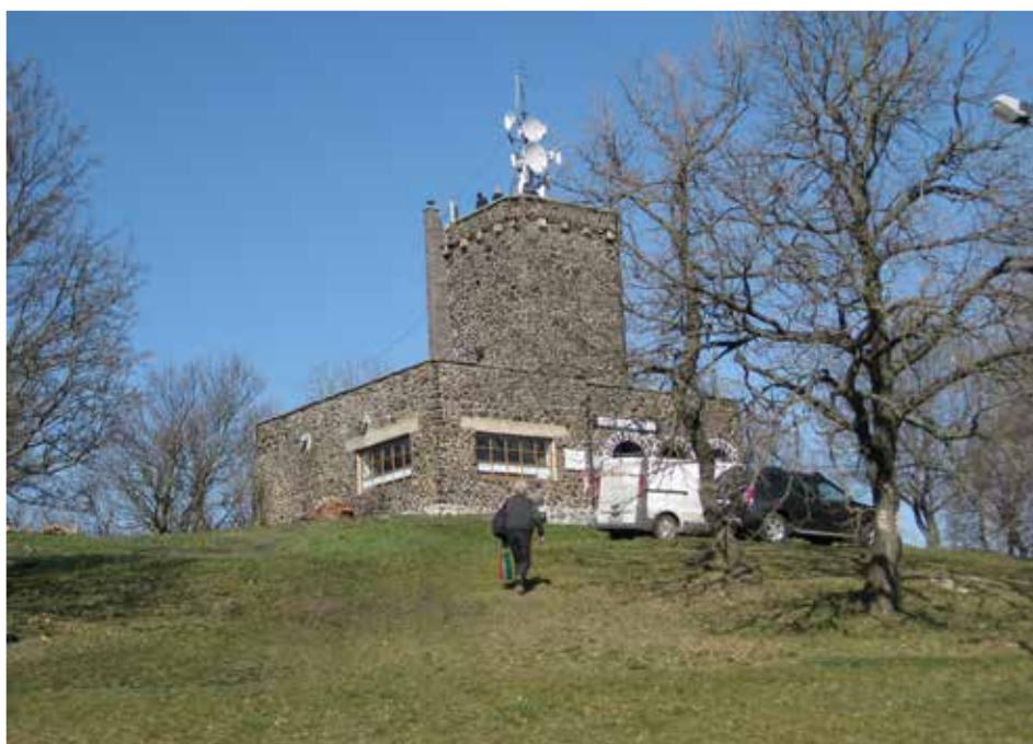
Somló tető a Szt. István kilátóval és a Meteorológiai Állomással

Az állomás helyszíni kiépítése a Somló-tetőn, ami Doba közigazgatási terü-