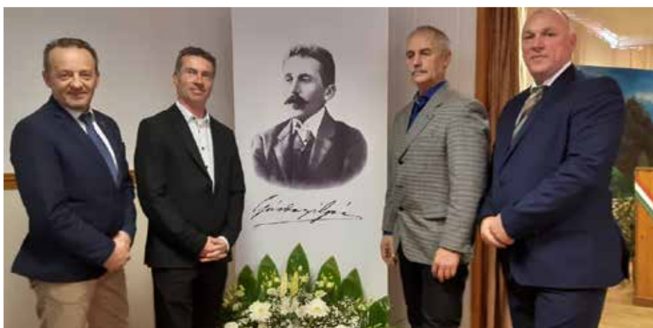
Gárdonyi települések polgármesterei az írófejedelem portréja mellett