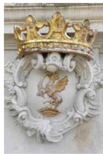
Az Esterházy család címere (Pápai Esterházy kastély)

meg a tatai várkastélyt és a hozzátartozó uradalmat. Az 1770 - ben épült gyáregyüt- tesben pezsgőgyárat hozott létre. New Yorkban folytatott zenei tanulmányokat, s dok- torátust szerzett. Szerelmes levél című vígjátékát 1935 - ben a budapesti Operaház is bemutatta. Tatán telepedett le, s nyaranta a várkastély park- jában zenei előadásokat ren- dezett. Kisvárosunk a híres szülöttei között tartja számon és tisztelettel őrzi emlékét dr. gróf Esterházy Ferenc zene- szerzőnek.