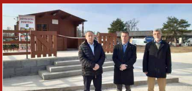
Devecseri Portéka bolt megnyitó