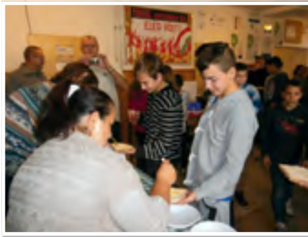
A gyerekek tízóráira vajas-mézes kenyeret, mézzel ízesített teát kaptak

Az általános iskola csatlakozott a szaktárca és az Országos Magyar Méhészeti Egyesület tervezett Európai Mézes Reggeli programjához, amelynek célja az egészséges táplálkozás, a méz hasznosságára való felhívás volt. November 20-án a gyerekek tízóráira mézes-vajas kenyeret és mézzel ízesített teát kaptak.