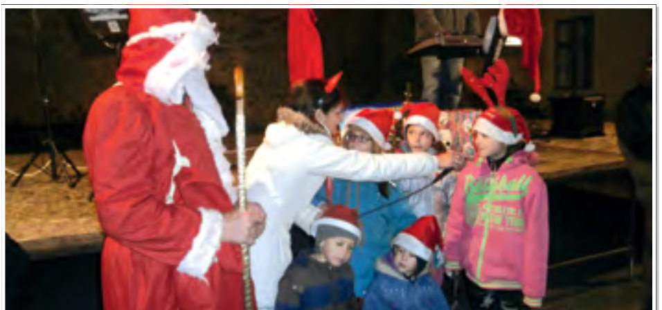
A gyerekek énekszóval köszöntik a Mikulást