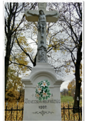
További képek: devecser.hu