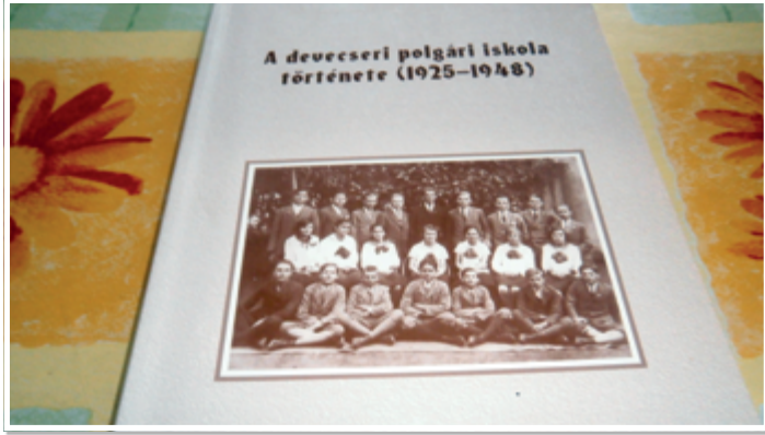
Tölgyesi József könyve a polgári iskola történetéről