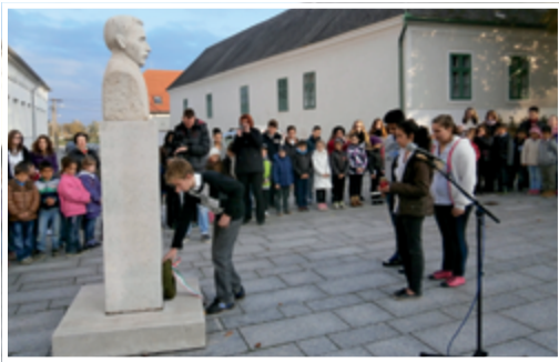
Koszorút és mécseset helyeztek el Gárdonyi szobránál