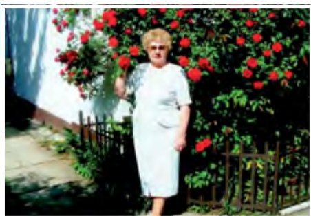
Aki a virágot szereti... 2009.