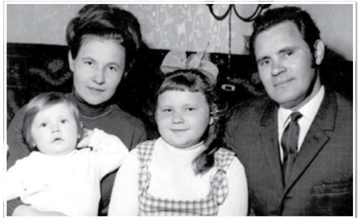
A havasi család 1969-ben