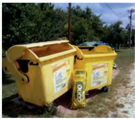
Szöveg, fotó: Czeidl József

Újabb olvasói megkeresés nyomába szegődött lapunk. Az Ifjúság- és a Csokonai utcát összekötő átjáróban lévő hulladékgyűjtő szigetet sokan helytelenül használják. Pedig olvasható felirat mutatja, hogy mit melyik tartályba kell elhelyezni. Nagy a káosz, látszik nincs összhang. Az üveg keveredik a papírral, a flakonok közé ételmaradékot dobnak. Ebben a melegben büzik a környék, s érthető módon a környékeliek, a közvetlen szomszédok jogosan berzenkednek ezen. De néhány bátor polgártársunk építési törmelékét is itt helyezi el. Éjszaka pedig egy-egy kerek kocsi táncra perdül, vélhetően hazafelé tartó bulizók jóvoltából. Mi ennyit tudunk tenni ez ügyben, felhívjuk ismételtlen a figyelmet városunk hulladékgyűjtő szigeteinek helyes használatára.