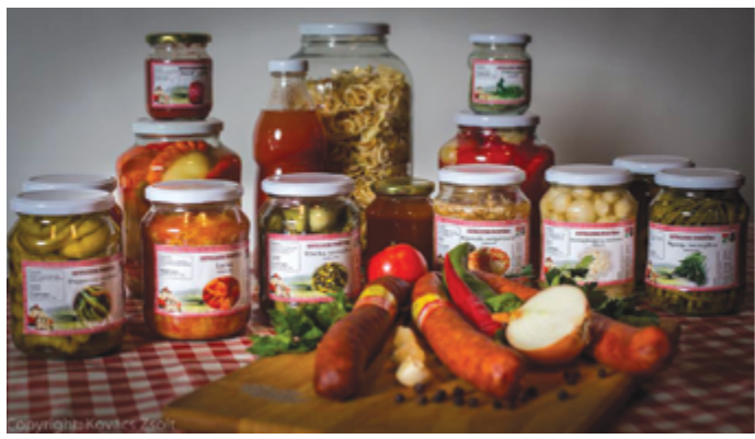
A Devecseri Portéka és a Devecseri Húsüzem termékei közös fotózáson

Devecser város hivatalos termékcsaládja a Devecseri Portéka. Ne-