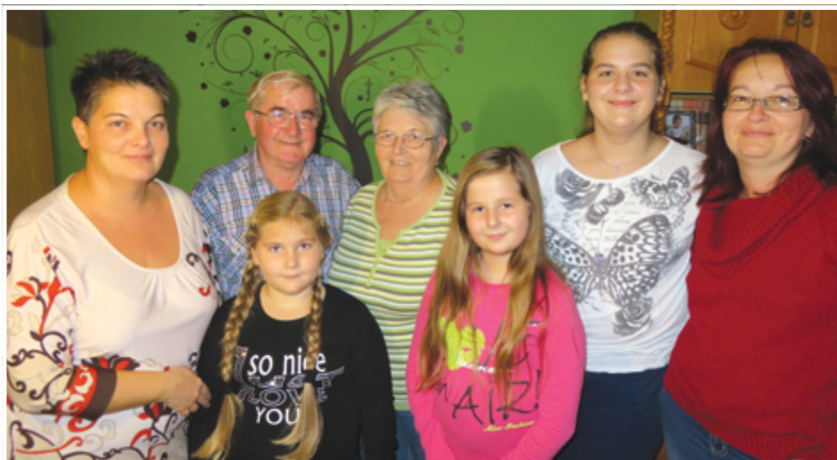
A család 2016