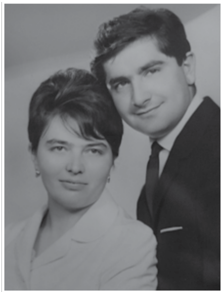
Az ifjú pár 1968

Sok felhő után kék lett az ég és alatta a két külön út összeért