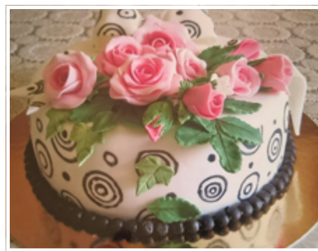
Ica egyik gyönyörű tortája