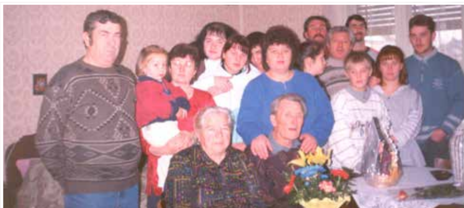
Ünnepel a családdal