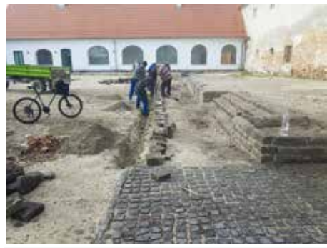
Elkezdődött a járdaépítés a piactéren.