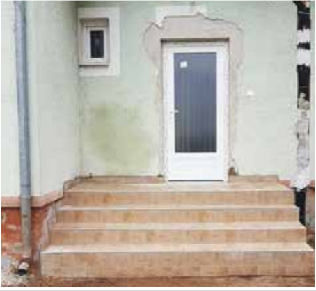
Elkészültek a Polgárör Iroda hátsó udvar felőli lépcsői.