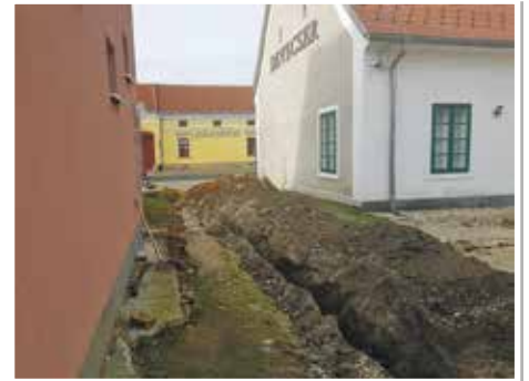
Megkezdődött a Művelődési Házban a tűzvíz ellátó rendszer fejlesztése.