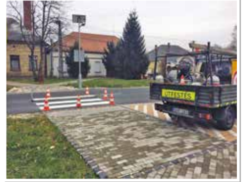
Elkészült a biztonságosabb gyalogos forgalmat biztosító zebra a Művelődési Ház és a Vackor Óvoda között.

A táblák kihelyezésére a megnövekedett személygépjármű-forgalom által előidézett balesetveszélyes helyzetek elkerülése miatt volt szükség. A táblák figyelmen kívül hagyása büntetést vonhat maga után!