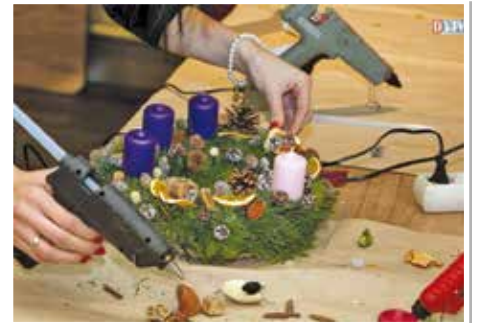
A Devecseri Városi Könyvtár és Művelődési Ház szervezésében koszorúköttésen vehettek részt az érdeklődők.

Településünkön a tavak környékére hódt költözött. Jelenléte sokak számára jelent örömet, ugyanakkor a védett állat okozta károk megelőzése érdekében már a képviselő-testület is egyeztetéseket folytat.