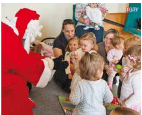
Devecser legkisebb lakói a Baba-mama klubban vártak rá.