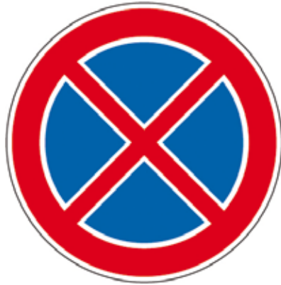
Kikerültek a megyeserdei útszakaszra a „megállni és várakozni tilos” táblák.

A táblák kihelyezésére a megnövekedett személygépjármű-forgalom által előidézett balesetveszélyes helyzetek elkerülése miatt volt szükség. A táblák figyelmen kívül hagyása büntetést vonhat maga után!