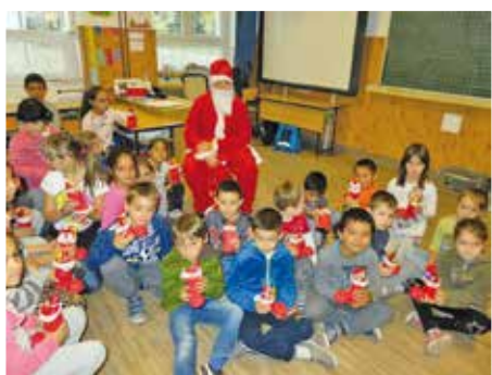
A Roma Nemzetiségi Önkormányzat Mikulása krampuszai társaságában látogatta meg a település intézményeiben rá váró gyerekeket.