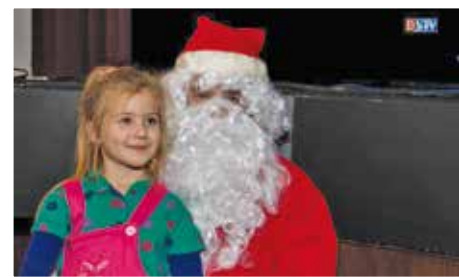
Advent első vasárnapján a legapróbbak örömeire Devecser Város Önkormányzata jóvoltából a Művelődési Házba érkezett a nagyszakállú.