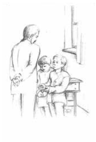
Grafika: Trombitás Veronika