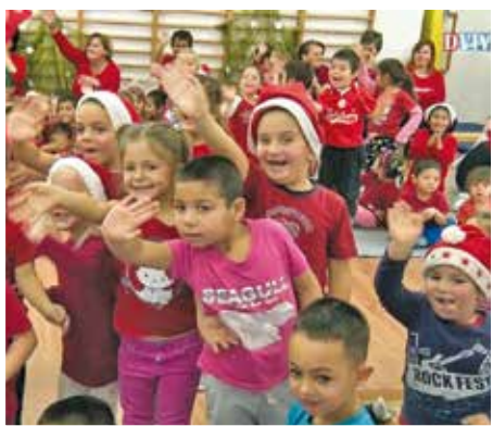
A Vackor Óvoda apraja-nagyja készült a látogatásra, és persze, hogy hozzájuk is megérkezett.