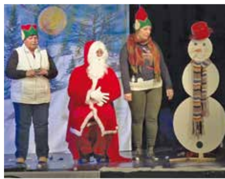
A Magyar Vöröskereszt Mikulása idén is ellátogatott városunkba a gyerekek nagy örömeire. Az ünnep hangulatáról az Adrenalin zenekar, a két manó és a Hótidér gondoskodtak.