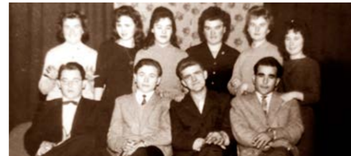
Színjátszó csoport 1962-ben