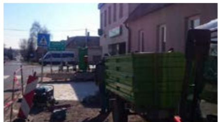
Folytatódnak a közterületi burkolások. Jelenleg a posta melletti parkoló felújítását végzi a térköves brigád. Összesen 11 parkolóhely kerül majd kialakításra.