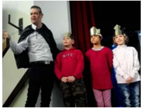
A Székely szabadság napján, A deákat erővel királlyá teszik című székely zenés interaktív műsorral várta az óvodásokat és kisiskolásokat a Devecseri Városi Könyvtár és Művelődési Ház. A rendezvényt a KábelNet-2002 Kft támogatásával ingyenesen tekinthették meg a gyerekek.