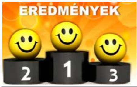
Zajlanak a házi versenyek az általános iskola alsó tagozatán. A gyerekek matematika, magyar nyelv és irodalom, valamint környezetismeret tantárgyakból adhatnak számot tudásukról.