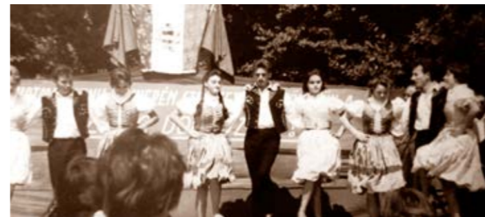
Néptánccsoport fellépése 1963-ban