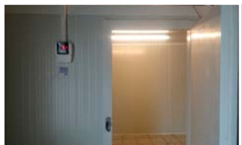
Elkészült a város mindkét hűtőkamrája - pályázati forrásból, illetve az önkormányzat saját anyagi ráfordításából - mely a kertészeten megtermelt zöldségek, bogyós gyümölcsök tárolását szolgálja majd.