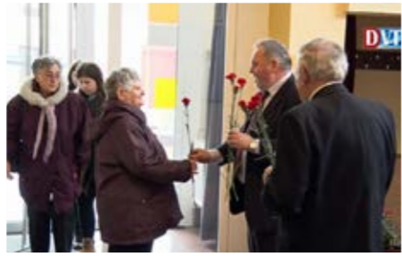
Március 5-én Nőnap alkalmából az MSZP helyi szervezete köszöntötte a hölgyeket. A rendezvényen részt vett Gögös Zoltán országgyűlési képviselő.