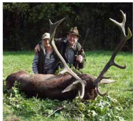
Férfj és feleség a szarvasbikával 2016-ban