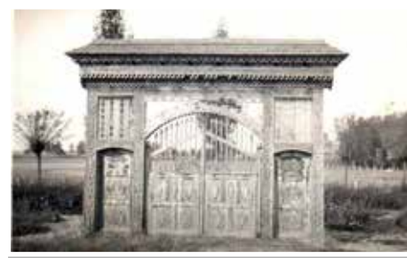
A csodás székykapu

kat, a jegyzőt, a pénztárost és a könyvtárosokat. Téved, aki azt hiszi, hogy csupa legényember néz ránk a tablóról. Több ősz hajú, tekintélyt parancsoló nagybajuszú úriembert és sok gyerekkoromból ismert arcot fedezek fel édesapám barátai közül. 85 összetartó ember 1938-ban! És most, 80 év után? Bárhol jól jönne egy „legényegylet”! 1936 (is) jó évük volt a devecseri 18-20 éves lányoknak. A fotók bizonyossága szerint a háztartási tanfolyamot 22-en, a hímző és varró tanfolyamot 25-en végezték el. Az eredményről magam tanúskodom. Édesanyám (lánykorában) mindkettőbe járt, melyek eredményeképp kitűnően főzött és remekül toldozta-foltozta a csúszás-mászás megviselte egy szál hétköznapi nadrágomat. Természetes, ma már több nadrágom van, de meghatódva emlékszem arra az egy foltozottra. Az apró kis kép a Várkertben készült 1940-ben. Ifjú ember ül a patak partján egy évszázados fa törzsének tövében. Előtte a víztükörben a túloldal fái. Gyönyörű környezet. Felejthetetlen nagybátyám, ha látogatóba jött a