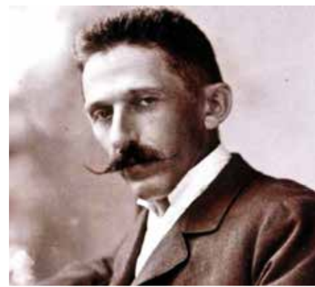
Gárdonyi Géza portré (Archív felvétel)