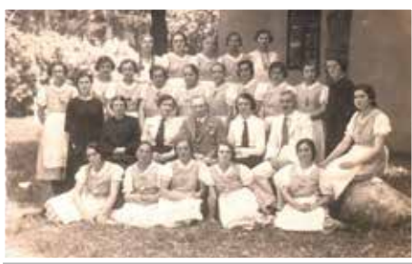
Lányok a tanfolyamon