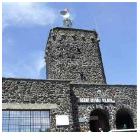
A 80. születésnapját ünneplő „hűség” tornya a Somlón