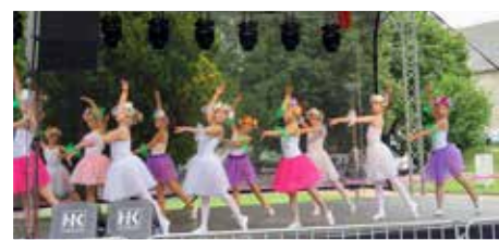
Az Ilcsi Dance – gyermekebalett előadásában látványos koreográfiákat láthatott a közönség