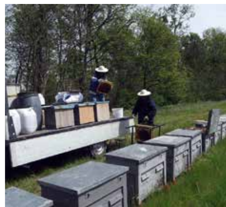
Pörgetés a vándortanyán