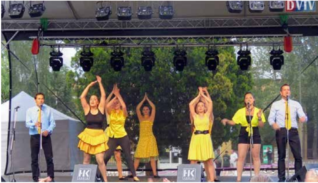
A Tapolcai Musical Színpad énekesei kiváló hangulatot teremtettek

Devecser Város Önkormányzata és a Devecseri Városi Könyvtár és Művelődési Ház által megrendezett Devecseri Városnapok háromnapos rendezvénysorozata utolsó napját, a színpadi produkciók változatos kínálata színesítette. Kora délután a Devecseri Ifjúsági Fúvószenekar kiskoncertjével vette kezdetét a vigasság. A Városnap vendégei voltak a „Térségi gyöngyök”, az Őszi Fény Nyugdíjas Klub (Devecser);