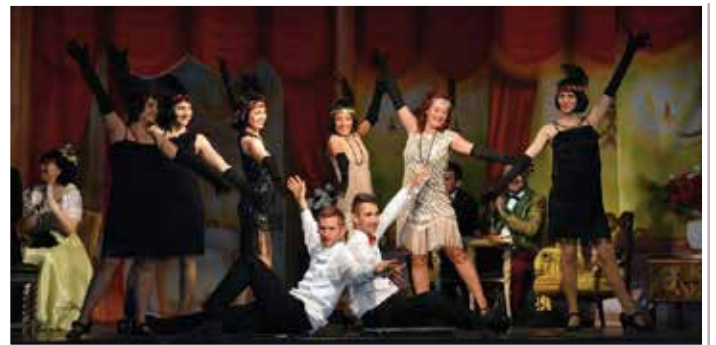
Kép az előadásból

szervezése révén az operettet kedvelők szép száma is megmutatta, hogy van igény erre a műfajra. Az amatőr színjátszók parádés, örömteli játéka a három felvonásban kikapcsolódást, szórakozást és felejthetetlen élményt nyújtott. Meg kell dicsérem a díszletet és a szereplők korhű öltöztét. A megszólaló dalok, amelyek napjainkban is hallhatóak rádióban és televízióban (Csókos asszony, Asszonykám adj egy kis kimenőt, Éjjel az Omnibusz tetején, Én és a holdvilág, Kár itt minden dumáért, Los Angeles, Mi muzsikus lelkek, Van a Bajza utca sarkán...) fergetes sikert arattak. A társulat kitett magáért, tagjai hétköznapi emberek, akik Tamási környékéről valók, de vannak köztük szekszárdiak és pécsiek is.