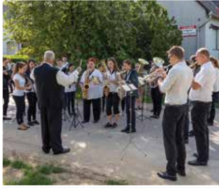
Reggeli ébresztő az Ifjúsági Fúvószenekarral