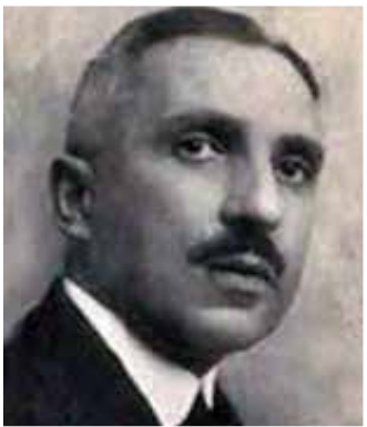
Zerkovitz Béla portré

Május 12-én, szombaton kora este szinte telt ház előtt mutatta be a vidéki Operetta Egyesület társulata, Zerkovitz Béla Csókos asszony című operettjét. A Művelődési Ház munkatársainak kiváló közönség-