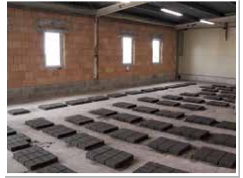
Az üzemsarnokban előállított térkövek