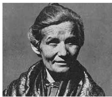
Utolsó kép a Mamáról