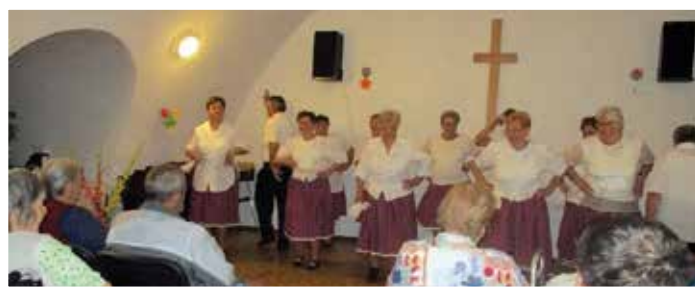
A Makovecz Klub zenés, táncos előadása