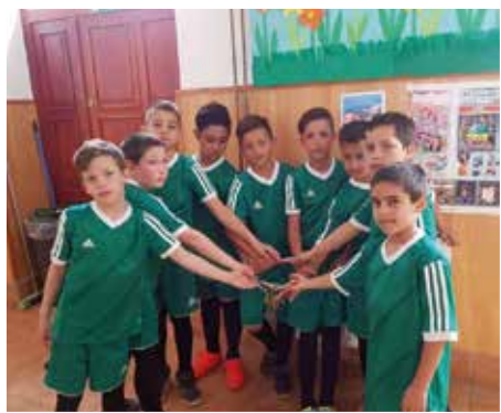
A körzeti torna aranyérmesei