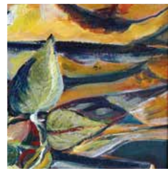
Az elhunyt alkotó egyik munkája