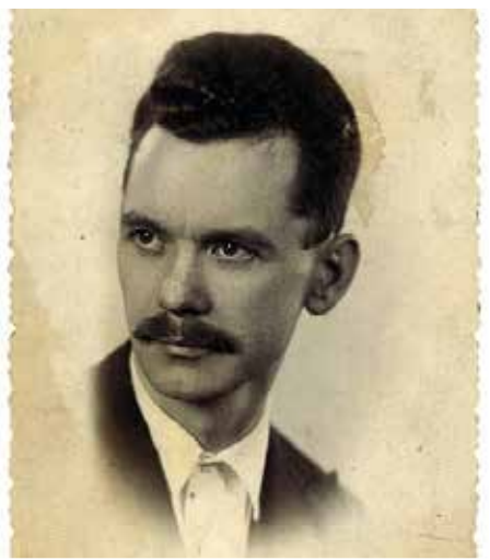
A költő 1936-ban

1964 óta évente megünnepeljük a költészet napját József Attila születésnapján. Elhangzik egy-egy verse, és kész. A költőről alig esik szó. Életében is kevés megbecsülést, elismerést kapott. Csak halála után kapta meg a Baumgarten-díjat (1938) és a Kossuth-díjat (1948) és lett magyar és világirodalmi klasszikus. Rendhagyó „Embermesém” róla szól.