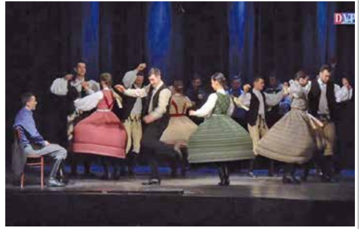
A táncgyüttes devecséri előadása