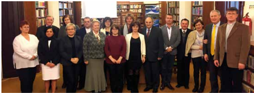
Az Emléktársaság alapító tagjai