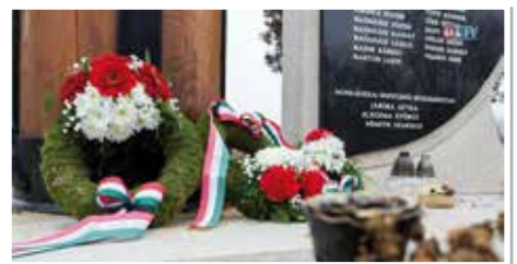
A Világháborús emlékműnél összegyűlt emberek koszorúkkal és mécsesekkel emlékeztek meg a Don-kanyarnál áldozatul esett honvédekre.