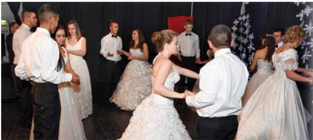
Nyitótánc