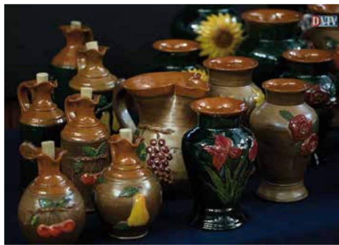
A Viszki által készített kerámiák

morú embert ismerhettek meg, aki talán nevezhető sztárnak, de nem a szó szoros értelmében. Akkor vajon miért? A múlt nem feledhető, a tett nem vehető semmisnek, a bűn az bűn...! Talán azért, mert neki sikerült az, ami sokaknak nem. A múlt tettei, a megbélyegzés ellenére talpra állt, visszailleszkedett a társadalomba. Történetét erős humorral fűszerezve a gyerekkorától kezdte. Sorsa már akkor körvonalazódni látszott. Románia-Csíkszentlélek, agresszív apa, nemtörődöm anya, és egy gyerek, akit még az utca sem nevelt. Édesapja már gyerekként megmondta neki, hogy a börtönben fogja végezni. A sors pedig pont úgy hozta, hogy Attila apja