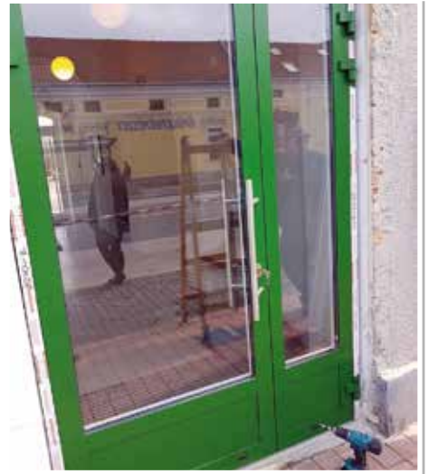
A geotermikus fűtés javítását követően, beszerelték az új bejárati ajtót a buszpályaudvarra az Inter-Ablak 2002 Bt. munkatársai.