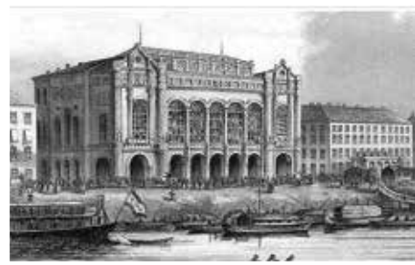
Az 1865-ben átadott Pesti Vigadó