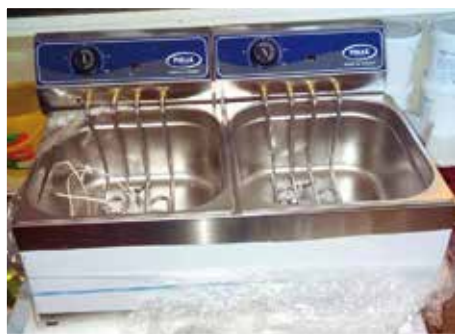
Az iskola konyhájának felszerelése egy új olajsütővel gazdagodott az önkormányzat jóvoltából.