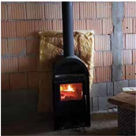
Üzemkészt lett a fűtés az új csarnokban, ahol a tervek szerint a jövőben térkövek gyártást végzik.