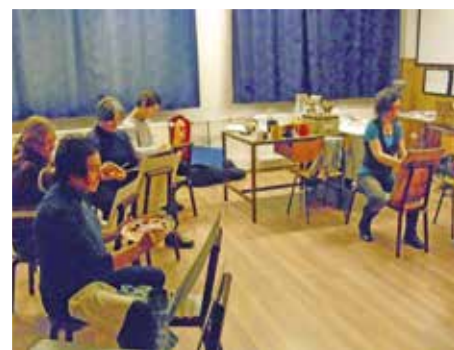
Az alkotókör tagjai munka közben

Bizakodunk a közösség megtartó erejében és a