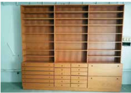
Élelmiszerfeldolgozó manufaktúránk legújabb szerzeménye egy polcos, fiókos tárolószekrény, mely kiváló szolgálatot fog tenni a készáruraktárban.