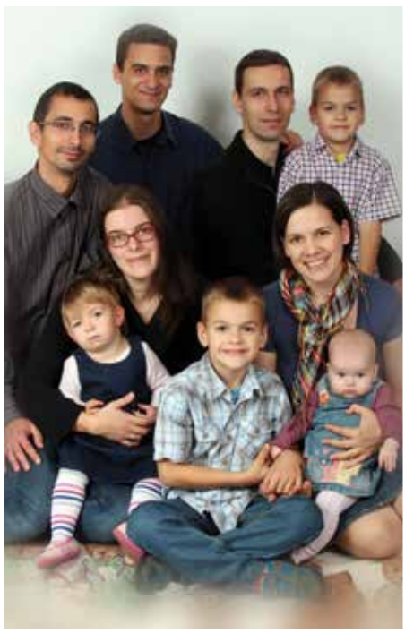
Gyerekek, menyek, unokák 2016-ban