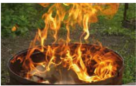
Bírósági szakaszba lépett a meggyeserdei szeméttégetés ügye.