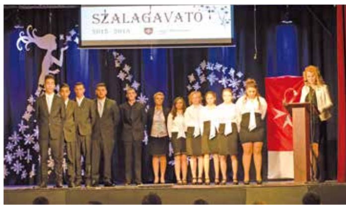
A végzős osztály