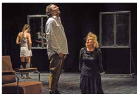
Képek a tavalyi előadásokból

„Szerelem és szenvedélyek, ármány, gyűlölet és halál, fondorlat és megbélyegzés szálain fut az izgalmas cselekmény, amely egyéni sorsokon keresztül eleveníti fel 1918 októbere utolsó három napjának megrázó történéseit. Szerettem volna megmutatni, hogyan jutott el egy olyan közösség, mint a magyar, amely oly sok évszázadon keresztül szinte folyamatosan fegyverrel védte hazáját, egy sorsdöntő háború végén az önkéntes önfegyverzésig, a pacifizmusig, majd a nemzeti önpusztításig. Dióhéjban ez a „Tizennyolc”, az új magyar színmű felvetett kérdése, melyet boncolgat a darab”, - mondja András Attila az