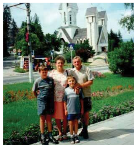
A család Erdélyben 2002-ben