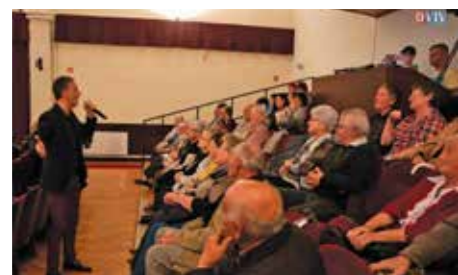
A jó hangulatú rendezvényen megénekelte a köszönetet Csonka András

sabb kort megélt hölgyeket és urakat nem tudjuk itt személyesen köszönteni – ezt polgármester úr fogja majd megtenni otthonukban. Mi innen tudjuk csak jókívánságainkat küldeni: Buzás Kálmánnak, Tárai Dezsőnének és dr. Világosi Györgynek jó egészséget, még sok-sok, családjuk körében eltöltött évet kívánunk!” Ferenczi Gábor polgármester örömet fejezte ki, hogy ezen a jeles napon 2016-évi köszönheti városunk idős polgárait. A világon 800 millió 60 év feletti ember él, akik október 1-jén ünnepelnek. Mi Devecserben november 5-én ünnepeljük a közel 1500 idős korút, hogy távolabb legyen az izspakatasztrófa napjától, mert ez az ünnep nem szólhat az elmúlásról, hanem a köszönetről, háláról és szeretetről. Önkormányzatunknak gondoskodni kell időseiről. Segíteni fognak a szépkorúaknak. Csonka András színész, énekes az alkalomhoz illő, nagyszerűen összeválogatott műsort hozott magával. Valamennyi dal sláger volt, az idősebb korosztálynak sláger ma is. A művész jó felütéssel kezdett: - Rendezzünk házibulit! – szólított fel, majd kérdéssel folytatta: - Hol vannak itt idősek? Csupa fiatal látok. Akkor hát tegeződjünk! – és kezdte a Táncdal-fesztiválok népszerű számainak és a hazai slágerek sorát. Elhangzott többek között az Állj meg kislány!, Csak egy tánc volt, Szeretni bolondulásig, Szóljon hangosan az ének!