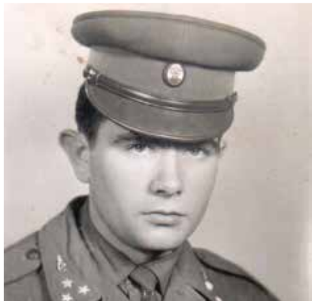
A kétszeres kiváló szakaszvezető