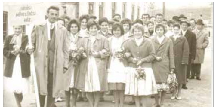
Felvonulók egy csoportja 1964-ben