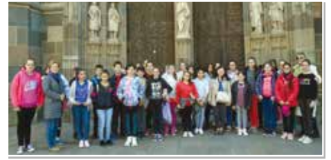
Csoportkép a kassai székesegyház előtt

összehívásáról. A főtéren álló szobor Andrassy Franciska grófnőnek, a szegények támogatójának állít emléket. Betlénen az Andrassy-kastély csodálatos látványa, a várkert romantikus szépsége, a parki séta tette emlékeztetéssé a napot. A hosszú utazás után örömteli volt megpillantani a Magas-Tátra hófedte csúcsait, majd izgalommal elfoglalni a tátralomnici kényelmes szállást. Másnap folytatódott az újabb gyöngyszemek megismerése. Lenyűgöző volt a bélai cseppkőbarlang, a szepesi vár. A gyerekek bejárhatták Közép-Európa legnagyobb erődítményét, amelyet már a kelták kezdtek el építeni, majd a tatárjárás (1241-42) után IV. Béla is erős építkezésbe kezdett. Sok ismeretet szereztek a lőcsei és a késmárki városnézés során is. Irodalmi olvasmányaik is felidéződtek. A fekete város című regényben szereplő városházát csodálták meg az előtte álló szegyenketreccel. De szó esett a lőcsei fehér aszszonyról, Géczy Juliánáról is, aki a város árulója volt. Csütörtök helyen a Szent László-templomot, s a mellé épített Szapolyai-kápolnát láto-gatták meg. A kirándulás harmadik, befejező