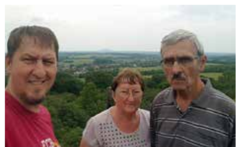
Sanyi fiúkkal a padragi kilátónál