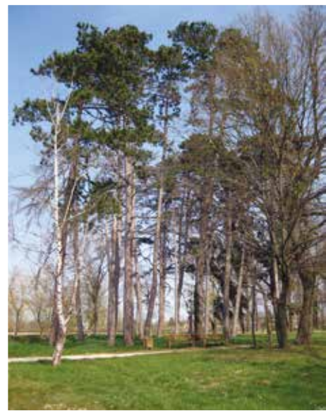
Ritkul a fenyőcsoportos