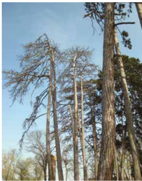
A fák állva haldokolnak meg