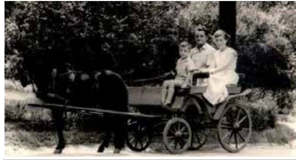
A család a budapesti állatkertben

biztonságot jelentett minden tagja számára. A nyugalmas légkört nagymértékben meghatározta az uraság emberséges, megértő magatartása.