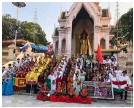
A Sztupa előtt a teljes csapat