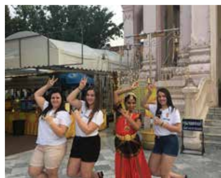
Indiai népviseletben tanítja ez a lány a magyar zenészeket táncolni