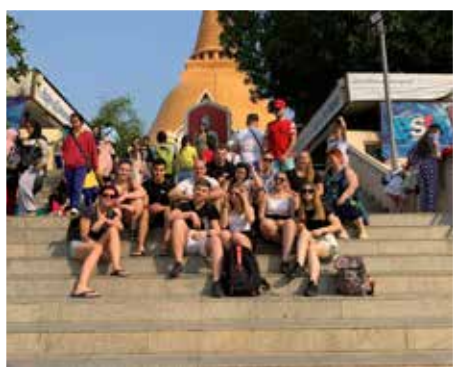
Nakhon Pathon Sztupa lépcsőjén az első nap