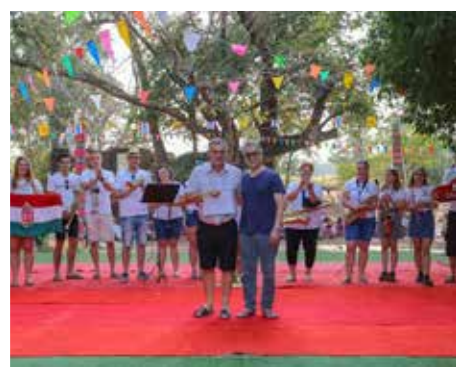
Szabadtéri fellépés után átadják az elismerő okleveleket