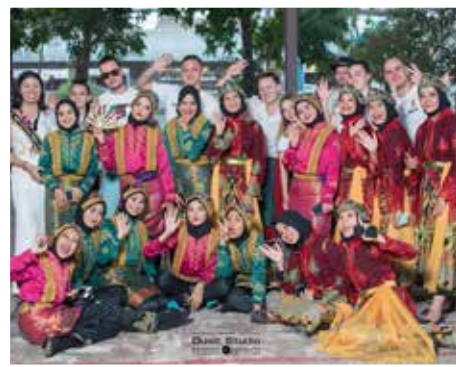
Egyik kedvenc csapat, Indonézia