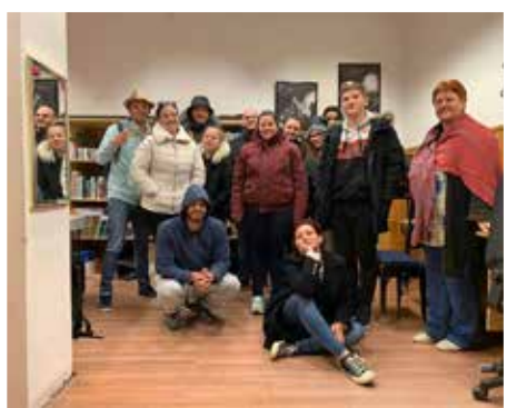
Hazaértünk, újra Devecserben!