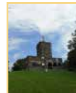
O) Szt. István kilátó