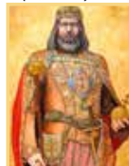
2) I. (Szent) István