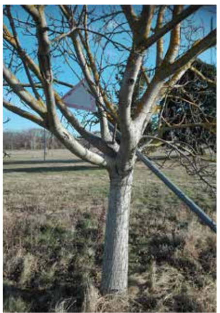
KRESZ tábla a diófának döntve

Valaki(k) barbár módon kitorpte az „Elsőbbségadás kötelező” KRESZ táblát és egy kis diófa ágai közé dugta be. A fontos tábla hiánya végzetes közlekedési baleset