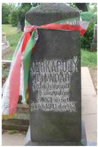
Kerkápoly Tivadar sírja Devecserben