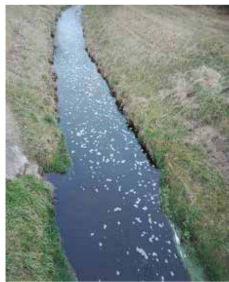
A habzó Torna

1. Mit csinálnak a nemzetiségi szószólók? Talán Önök is emlékeznek rá, hogy a legutóbbi választásokon a Parlamentbe jutottak a megválasztott nemzetiségi –