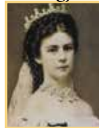
7) Erzsébet magyar királyné