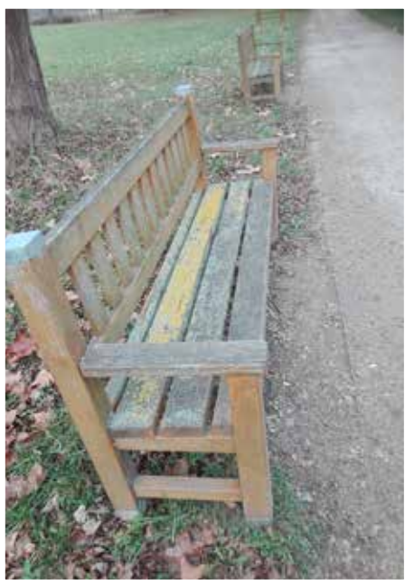
A várkert mohás padok

Én egyre inkább elbizonytalanodok. Egyre több olyan kifejezéssel találkozom Tv-ben, rádióban, újságban, amelyeket egyáltalán nem értek. Tessék segíteni az ilyen szavak értelmezésében, mint pl. podcast (pockaszt), streamelt (trémelt) produkció, bookazin (bukazin), streaming szolgáltatás, old school gondolkodás, shoppingolás, vintage darabok, fast fashion, stb. Ha rajtam kívül mindenki ismeri a felsorolt szavak jelentését, akkor elnézést kérek.