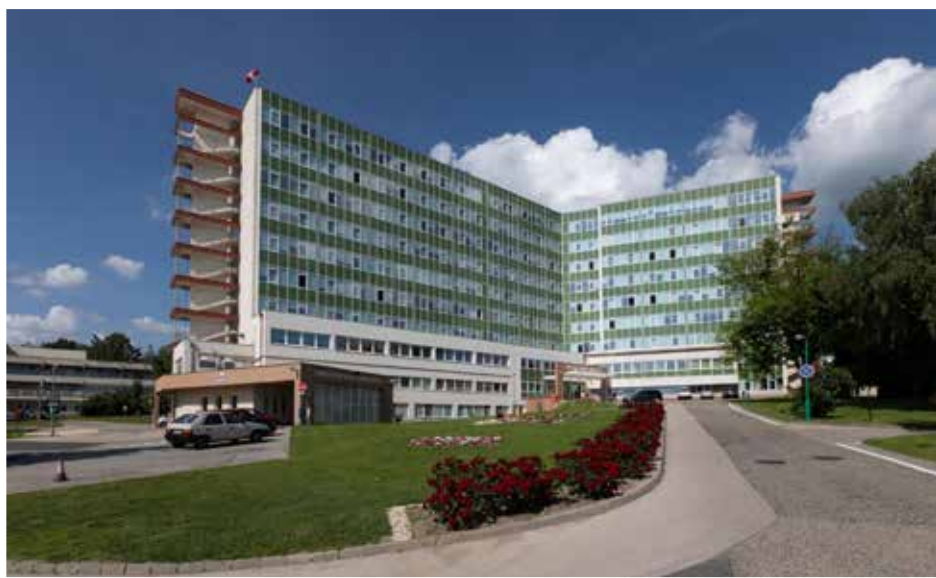
Magyar Imre Kórház Ajka