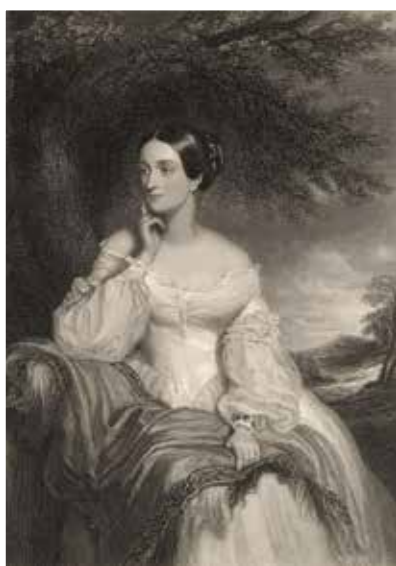
A skót származású felesége

Gróf Zichy – Ferraris Manó (Bécs, 1808. december 26. – Budapest, 1877. április 05.) Édesapja katonai pályára adta. Előbb gárdista, majd huszár lett. 1825 – 39 között az első huszárezredben szolgált. Az 1848 – as forradalom – és szabadságharc kitörésekor az osztrák hadseregből a honvédségbe lépett át. A horvátok betörésekor Moson megyében nemzetőr csapatot gyűjtött.