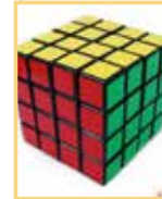
K) rubik kocka