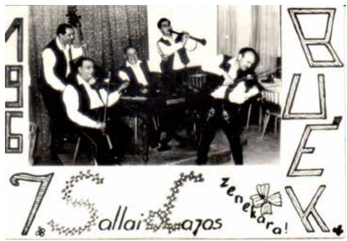
Sallai Lajos és zenekara (1967)