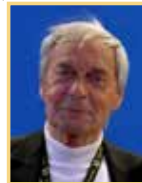
1) Rubik Ernő