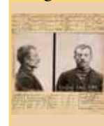
A) Luigi Lucheni