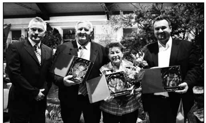
A díszpolgárok bemutatását a novemberi újságban jelentetjük meg. A www.balastya.hu/hirek oldalon részletes bemutatás olvasható.