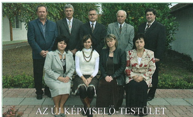
AZ ÚJ KÉPVISELŐ-TESTÜLET