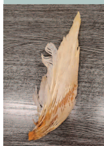
A libatollból a hétköznapi életbe használt eszközök is készültek. A felső képen a sütéshez használt kenőtollat, az alsó képen pedig a portörlesre használt tollseprűt láthatjuk.