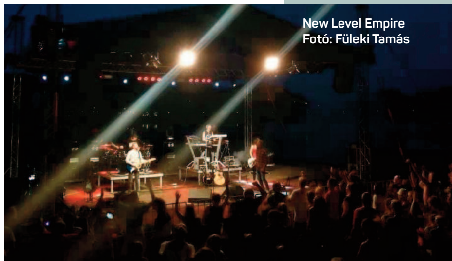
New Level Empire