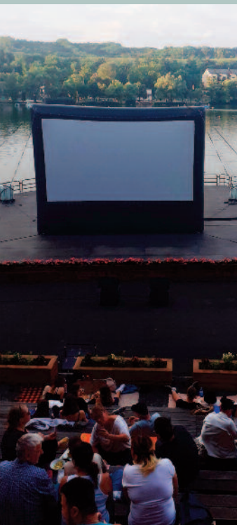
Piknik Mozi hangulatos tóparti filmvetítés

Külön sikernek tekinthetjük, hogy a programjaink jó része ingyenes volt, mert pályázati forrásból tudtuk megvalósítani azokat (Déryné Program, TOP pályázat). A rendezvényeink teljes látogatottsága kb. 8600 fő volt.