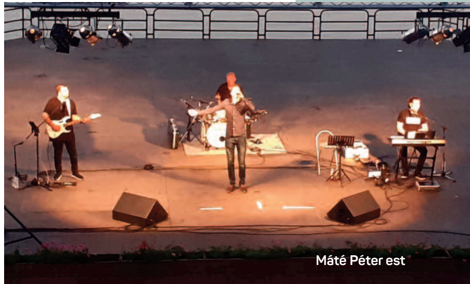
Máté Péter est