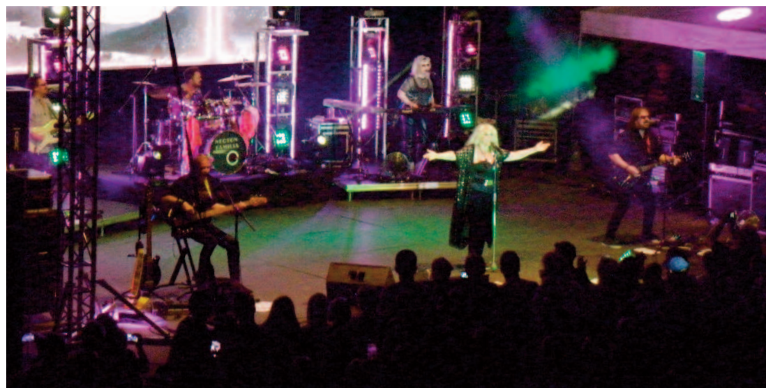
A Neoton Família Sztárjai