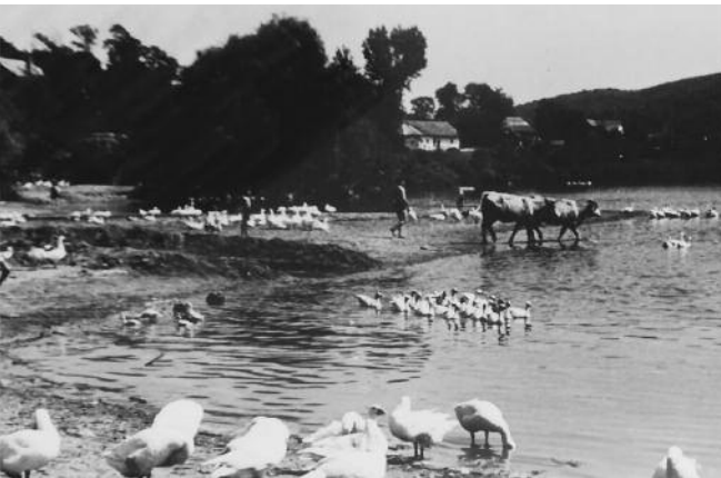
Libafürdetés a bánki tóban. A háttérben a Vincze kocsmá épülete.

Amikor valahol befejezték az aratást, a gazdák mindig szoltak, hogy hova lehet menni legeltetni. A tarlón reggel öttől nyolcig legeltettek, utána a jól lakott libákat leterelték a tóra vagy a patakra, ahol az állatok szabadon fürdöztek, majd délután öt-hat órától sötétedésig ismét a tarlóra hajtották őket. Estefelé, a libapásztor terelgetésével libasorban érkeztek haza a libák, ki-ki a portájára.