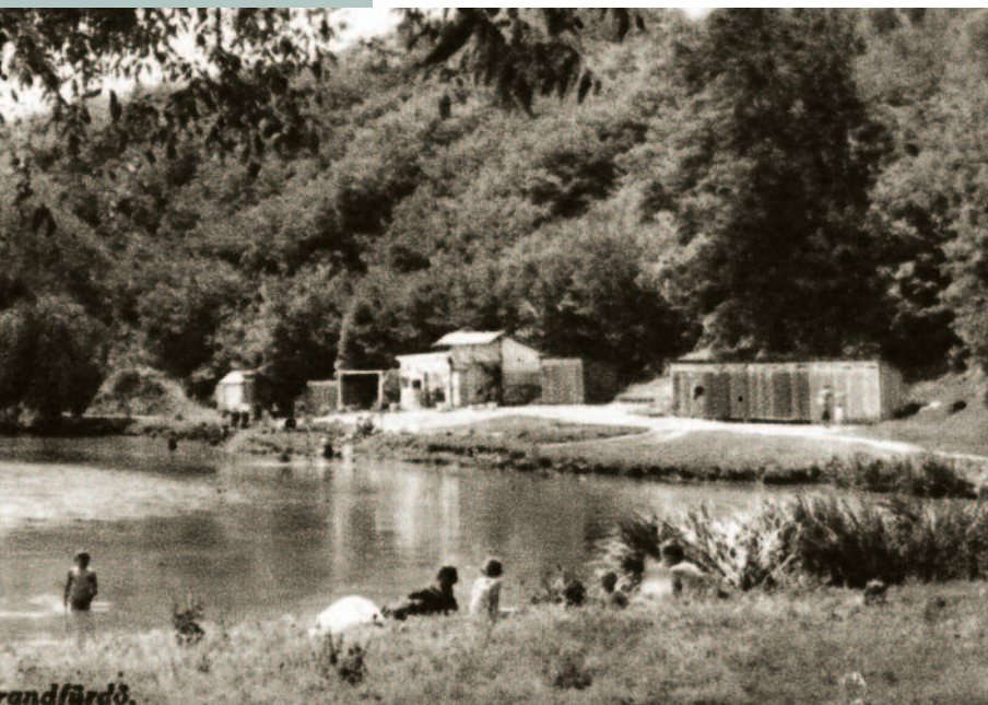
Az 1940-ben készült képen a strandfürdő a kabinsorral, és a vendéglővel.