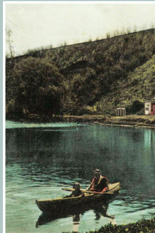
Pár évvel a nyitás után készült felvételen a strand az 1934 nyarán feladott képeslapon