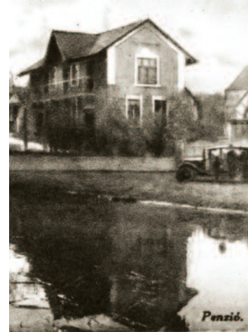
A Tengersizem panzió az 1940-ben készült felvételen