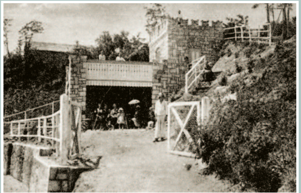
Bástya Kioszk a 1930-as években