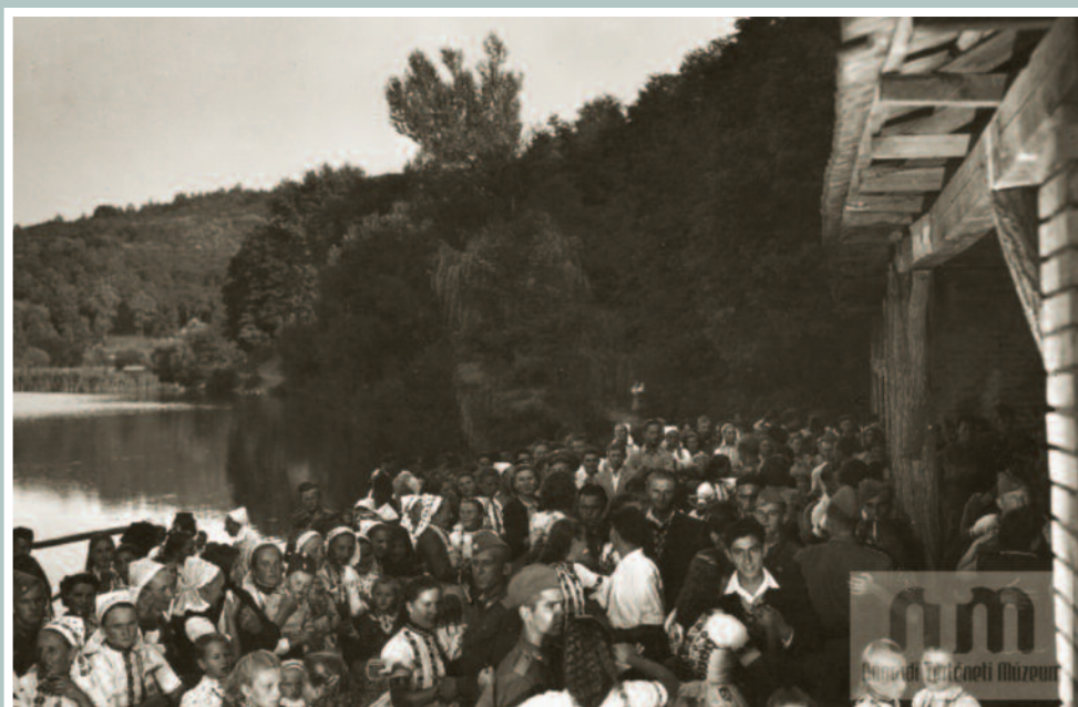
Szombat és vasárnap zsúfolásig megtelt a terasz a szórakozni vágyó emberekkel