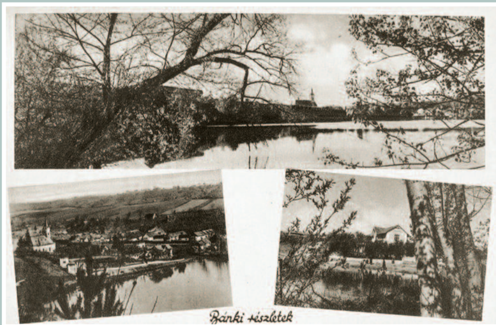
„Üdvözlét Bánkról” – korabeli képeslap