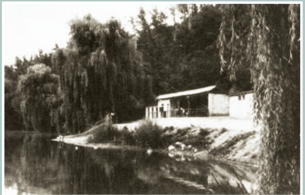
A Vincze vendéglő a betonozott terasszal, ahol hétvégén élő zene mellett szórakozott a nép