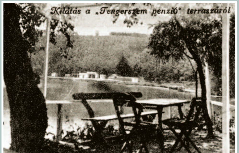
A korabeli képeslapon a kilátás a strandra néz