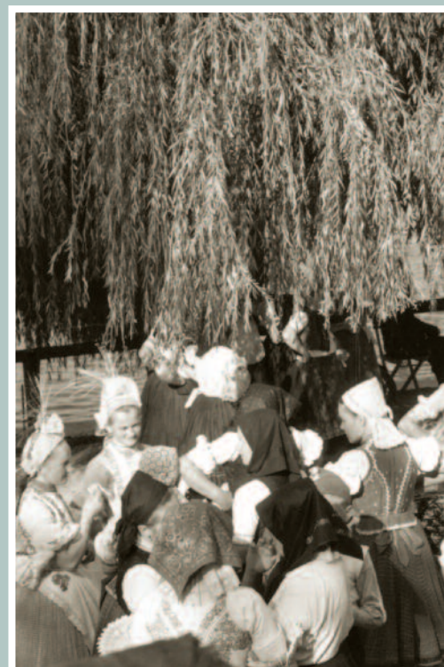
Lányok és asszonyok a fűzfák árnyékából hallgatják a teraszon játszó cigányzenekart