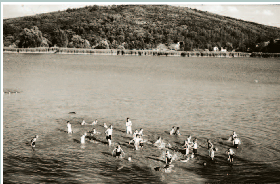
A felvétel a Bástya Kioszk teraszáról örökítette meg a fürdőzőket