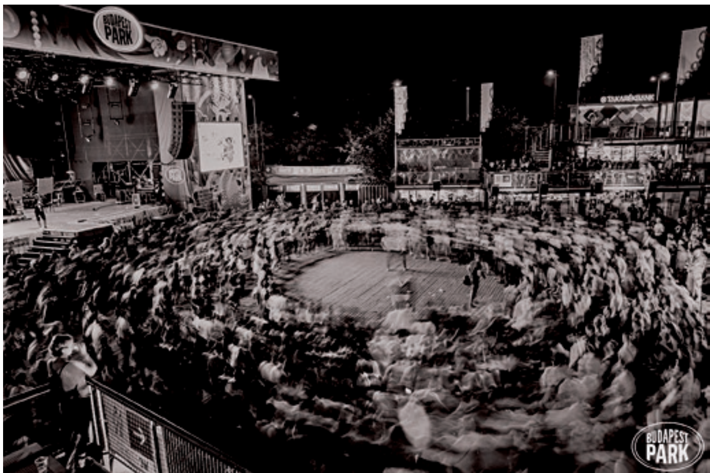
Táncház a Budapest Parkban (2019.)