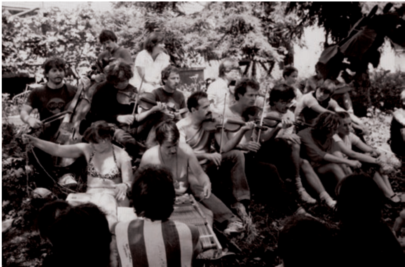
Téka tábor, Nagykálló-Harangod (1980-as évek)