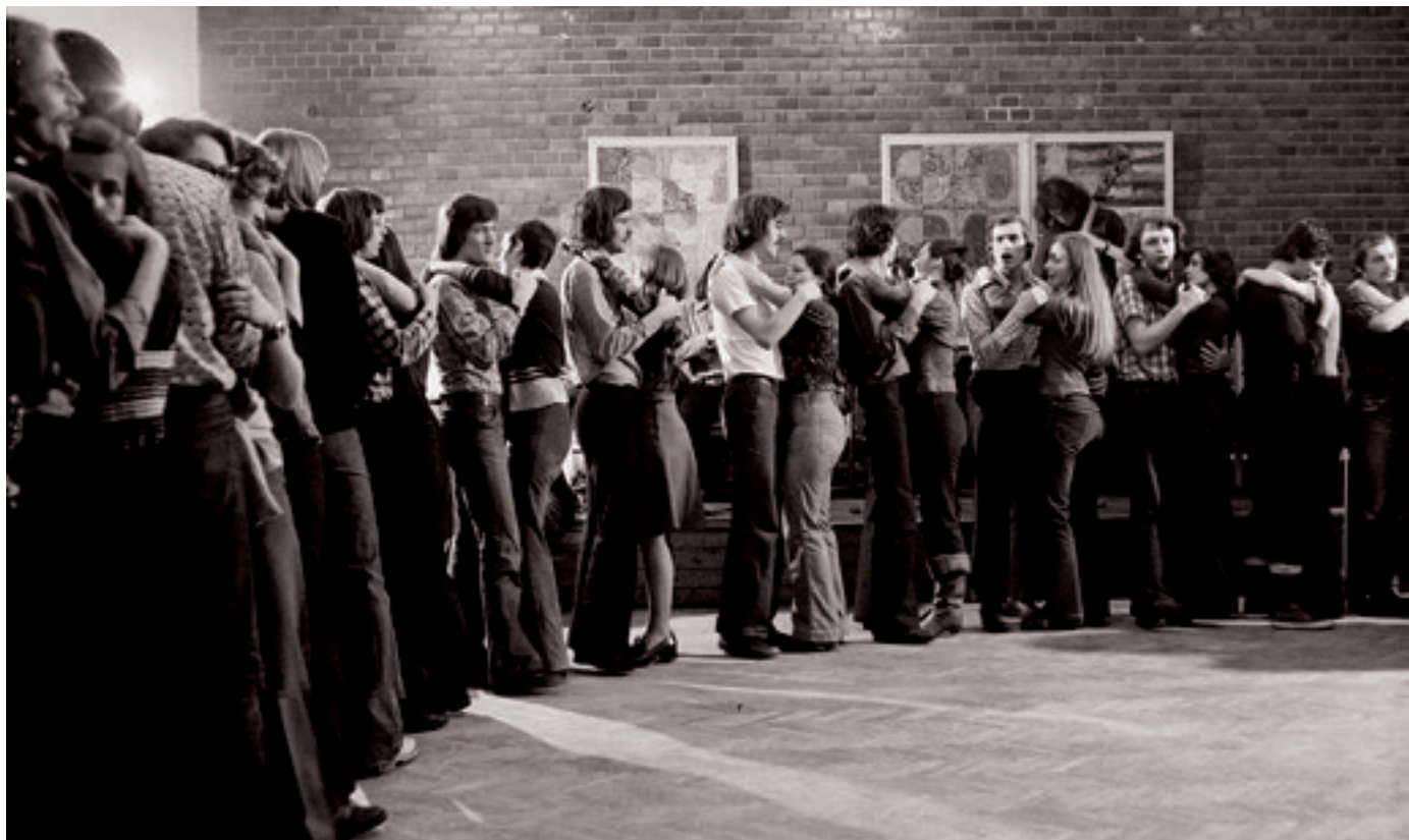
A Sebő együttes táncháza, Kassák Klub, Budapest (1970-es évek)

A támadások közül a legbántóbb a rosszindulattal párosult és rendszerfüggetlen műveletlenség volt. Ez főként olyan jellegű ellenérzésekben jelentkezett, hogy egyáltalán mit akarunk? Volt, aki rühellte az egész népzeneit. Volt, akinek az anyagi érdekeit sértettük, másoknak a szakmai hiúságát. Hogy jövünk mi, utcáról bejött amatőrök ahhoz, hogy táncoktatással, zenészképzéssel foglalkozunk? Elementáris fölháborodást váltott ki, amit csináltunk, nem csak napi politikáit. Nagyon sokat jelentett számunkra, hogy akkor Vitányi Iván mind szakmai, mind politikai szempontból kiállt mellettünk. Rámutatott, hogy ez egy fontos ifjúsági mozgalom, s azokhoz az értékes vonulatokhoz csatlakozik, amelyeknek fiatalkorában ő is részese volt – s ezzel egy hosszabb távú folyamatba helyezte a dolgot. És a végén – utalva a Beatlesre – azt is kimondta: „Ha a liverpooli fiúknak szabad volt a saját zenéjüket játszani, akkor nekünk miért nem szabad?”. Erre már nem tudott senki mit mondani.