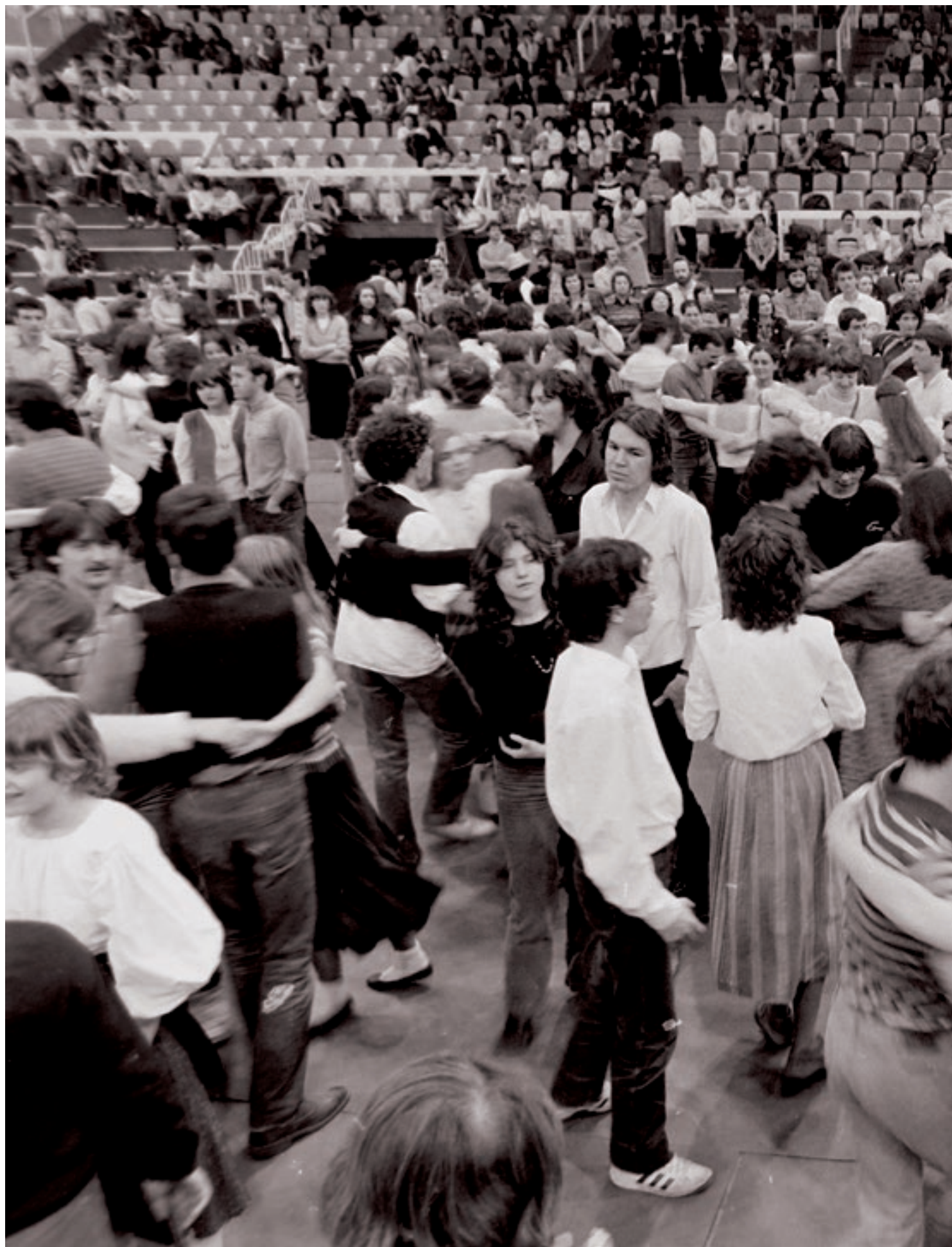
„I. Magyarországi Táncház Találkozó”, Budapest Sportcsarnok, 1982. március 28.