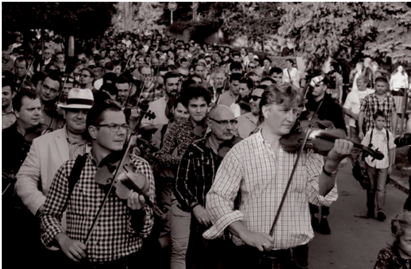
Erdélyi Táncháztalálkozó – Székelyudvarhely (2018.) – Fotó: Farkas József

ben a többi ország népművészeti revival mozgalmával – hogy a forrásanyag mély ismeretéből építkezett; ezt olyan közös értéknek érezzük, amely kapcsán egyetértés van; ez kell, hogy az alapját szolgálja a jövőben is a működésünknek.