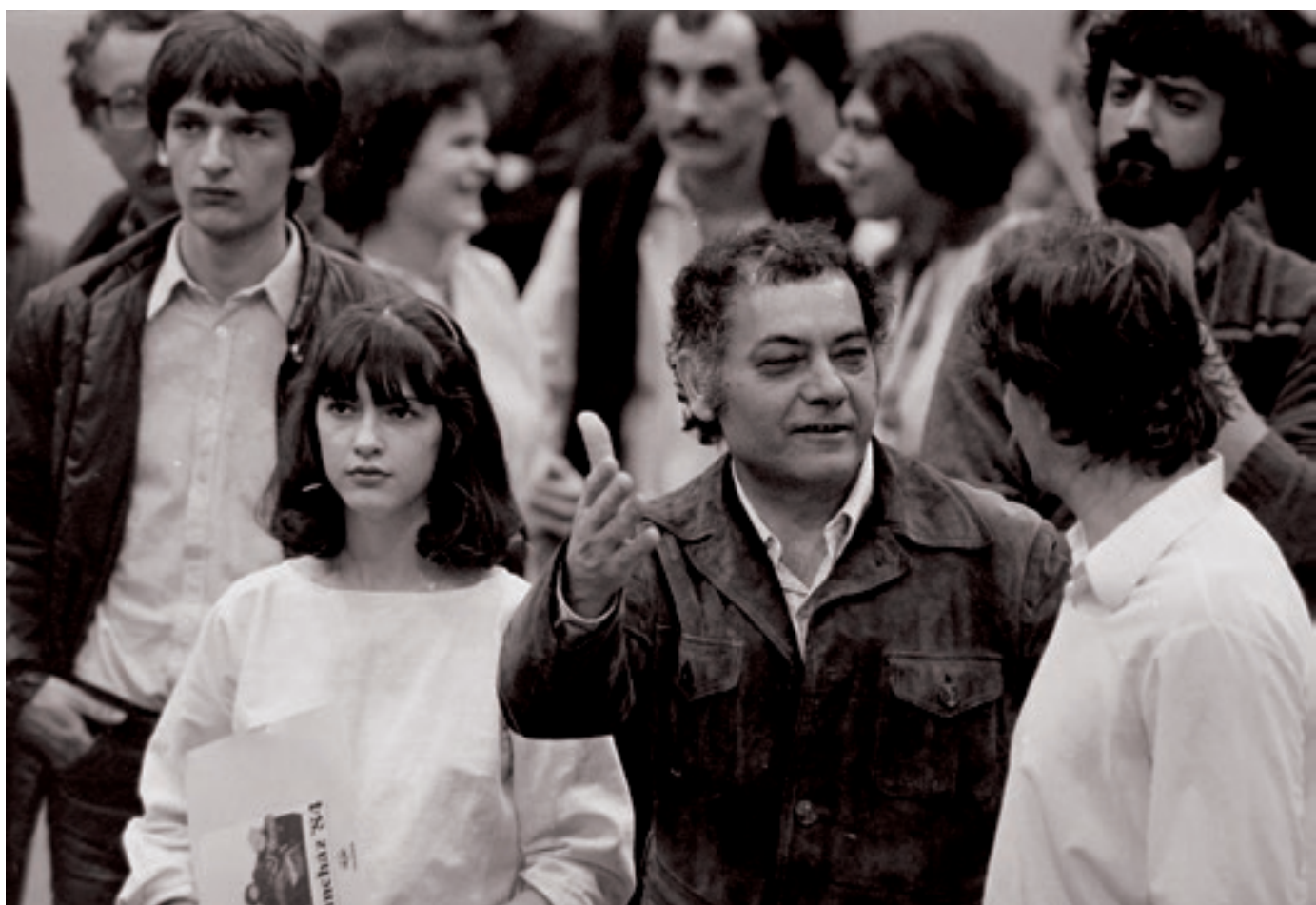
Csoóri Sándor költő, táncházasok körében (1984.)