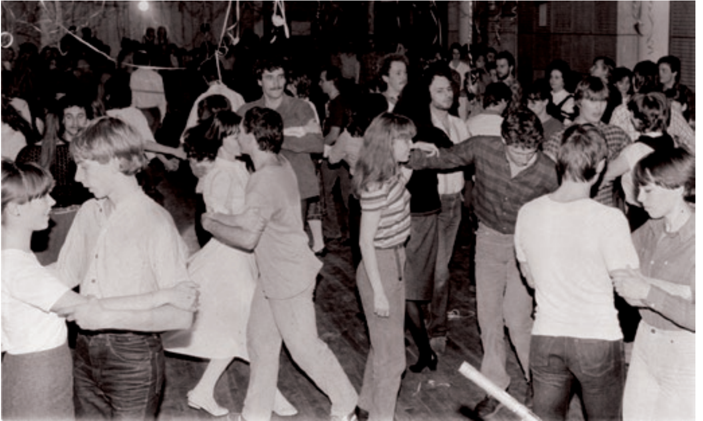
Farsangi mulatság az Almássy téri Téka táncházban (1980-as évek)