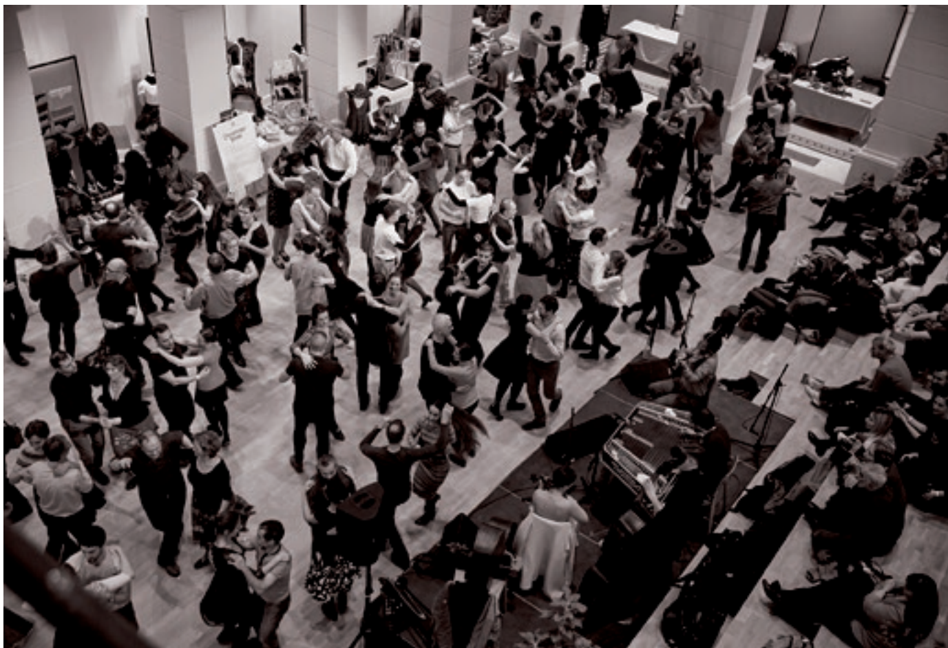
A 2018-ban felújított Budai Vigadóban szombatoként táncházba várják a közönséget.

Ennek a szemléletnek a magyar revivalben alig érzékelhető a hagyománya. A magyar táncmozgalom különlegessége – szem-