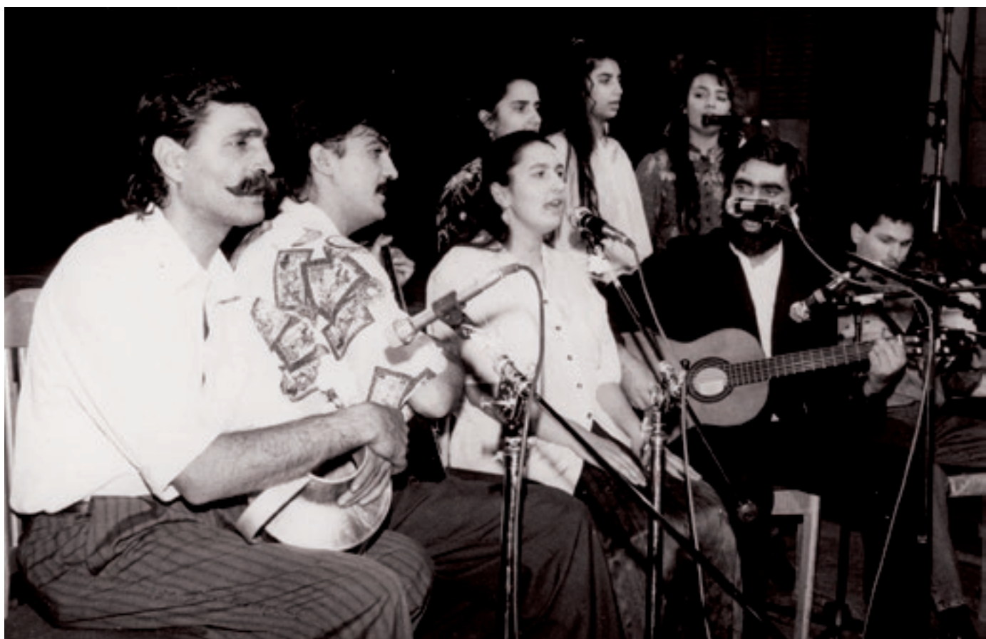
Lindri együttes – A táncházmozgalom húszéves jubileuma, Almássy téri Szabadidőközpont, Budapest (1992.)