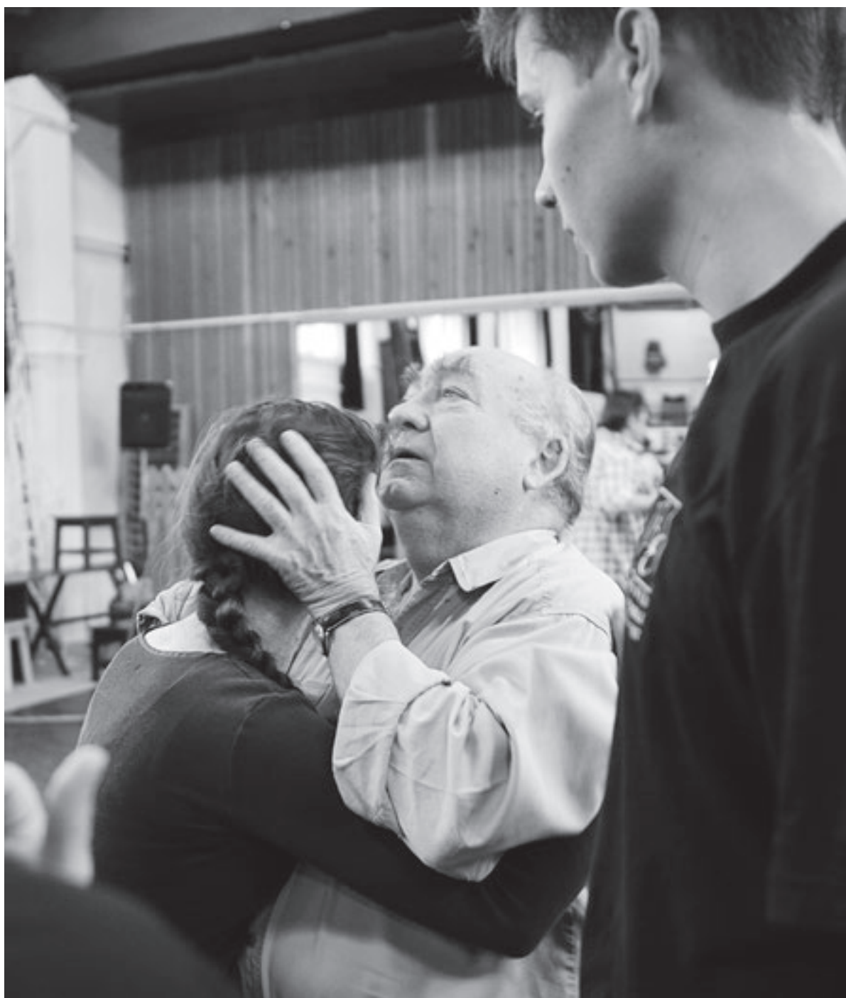
„István, a király” próba – Honvéd Táncszínház, 2009