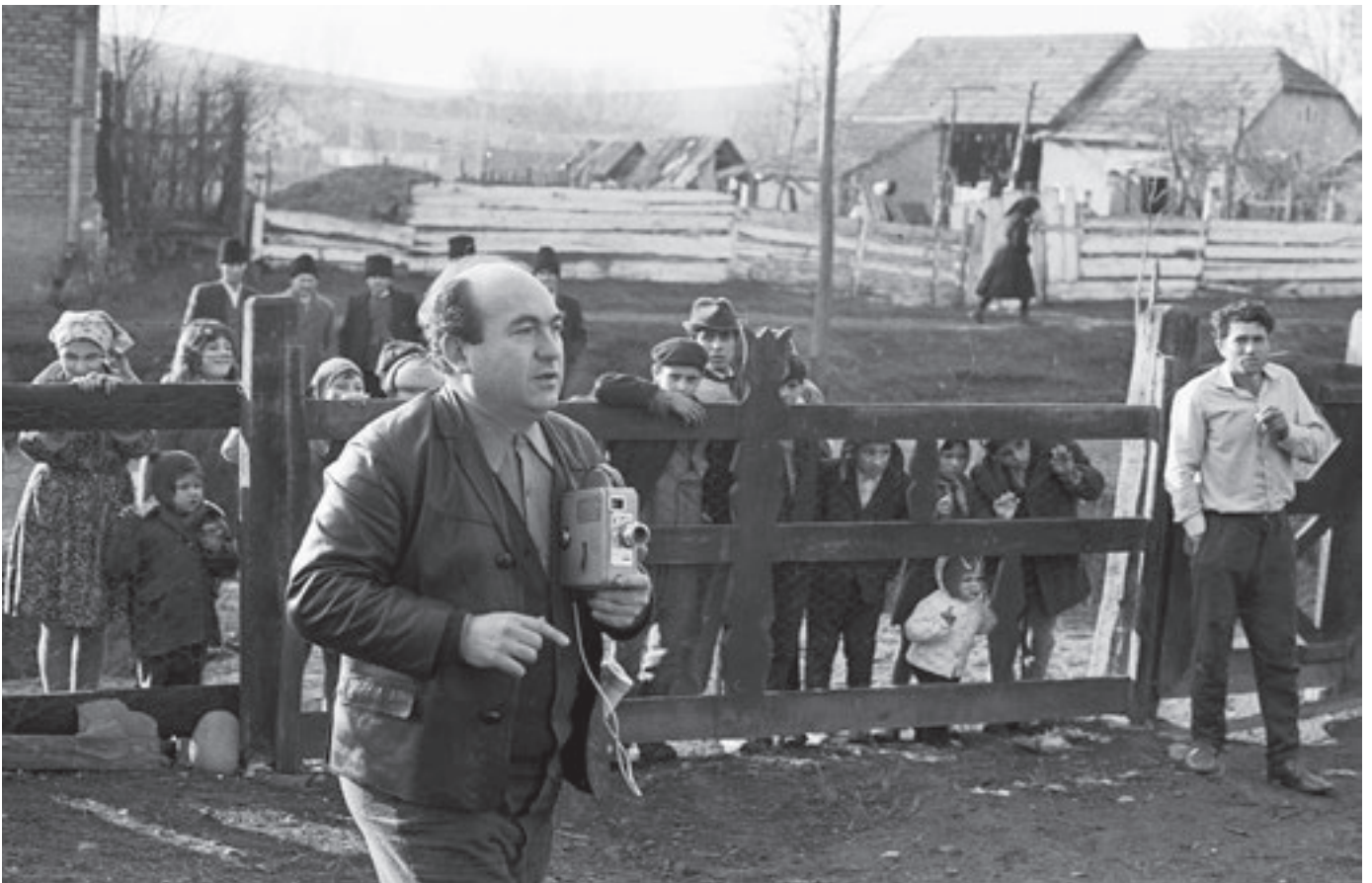
Gyűjtés közben – Szásztancs, Románia, 1972