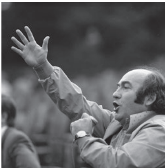
Rendezés közben – Szegedi Szabadtéri Játékok