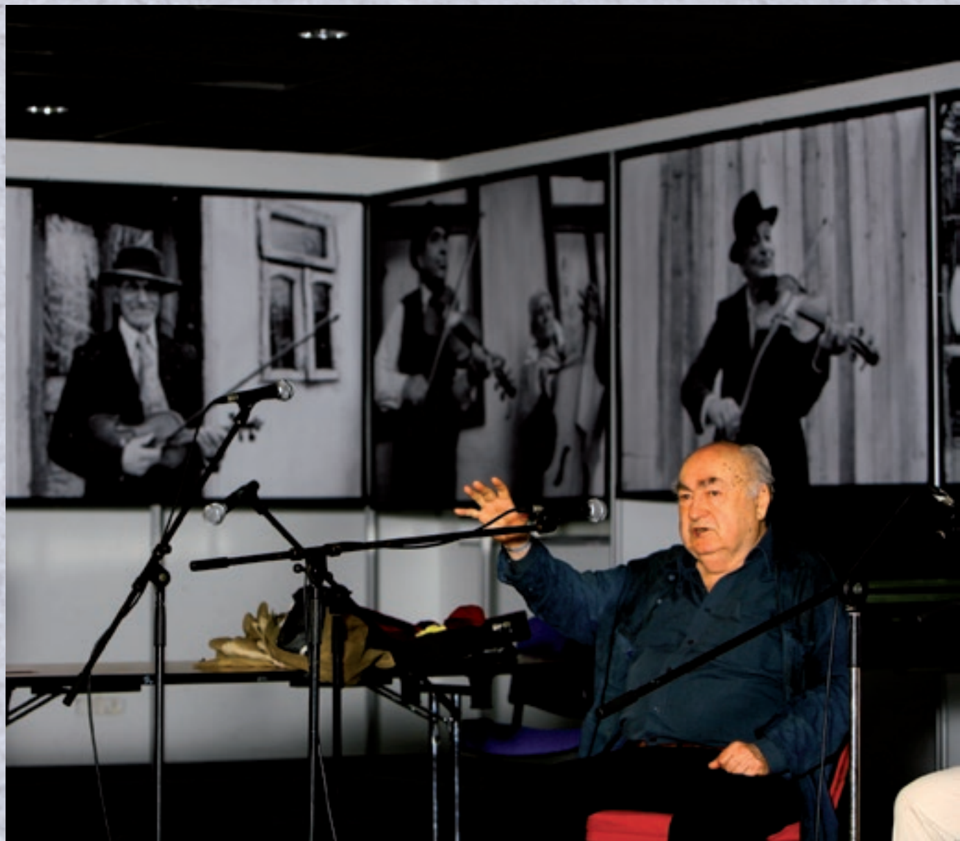
Tánc történeti előadás – Táncháztalálkozó, 2014

Címlap: Gyűjtés Dobos Károly bandájával – Szék, 1967