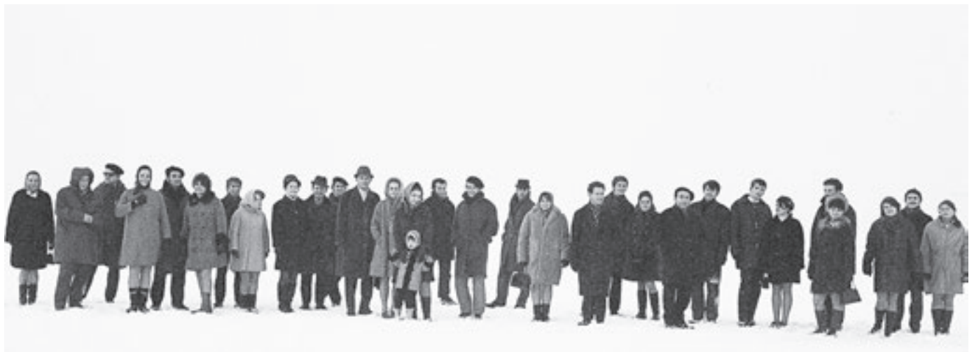
A Bihari Együttes – Keszthely, 1968