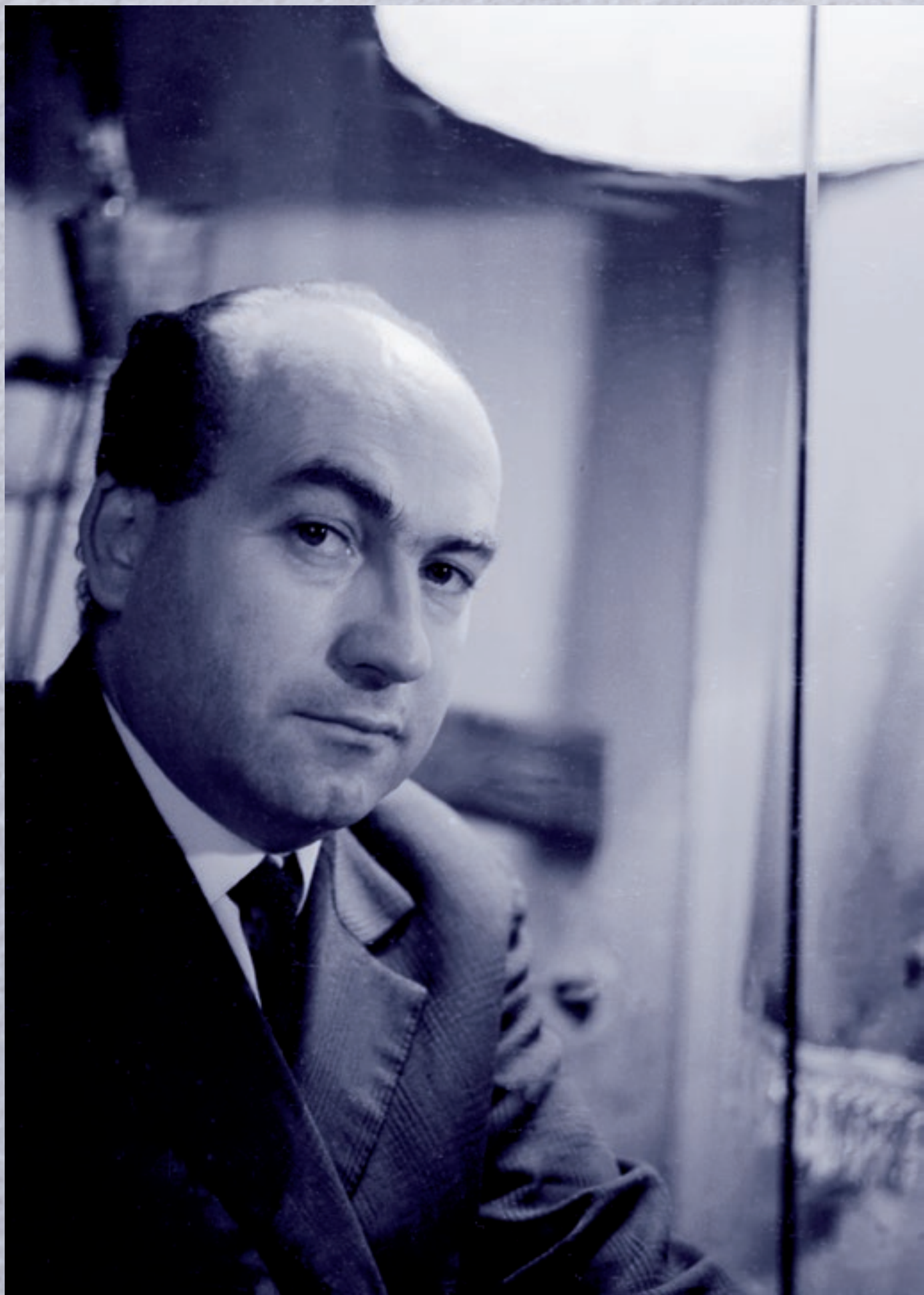
A Bihari Együttesben – HVDSZ Jókai Művelődési Központ, 1963