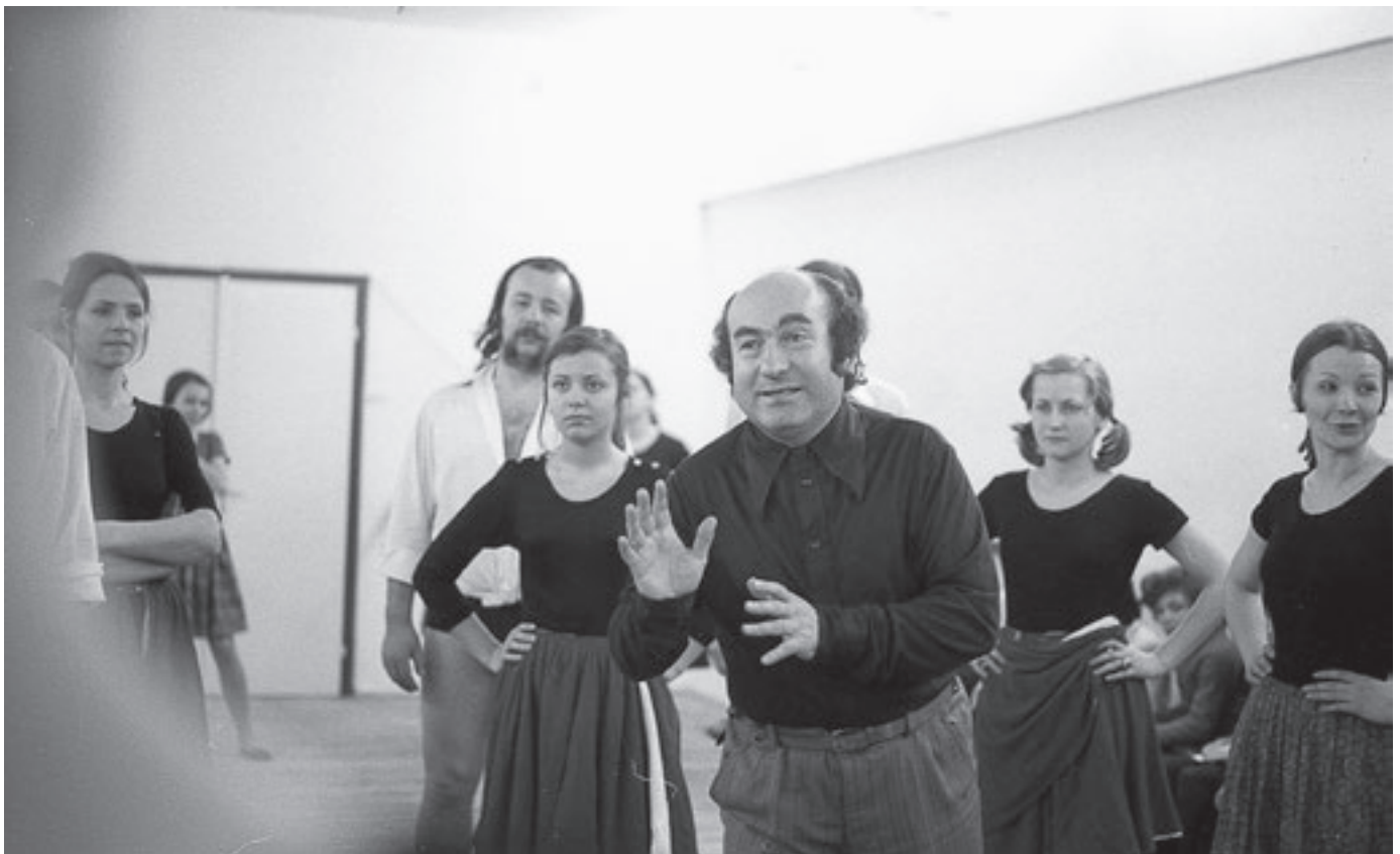
A Bihar Együttes próbatermében – HVDSZ Jókai Művelődési Központ, 1975