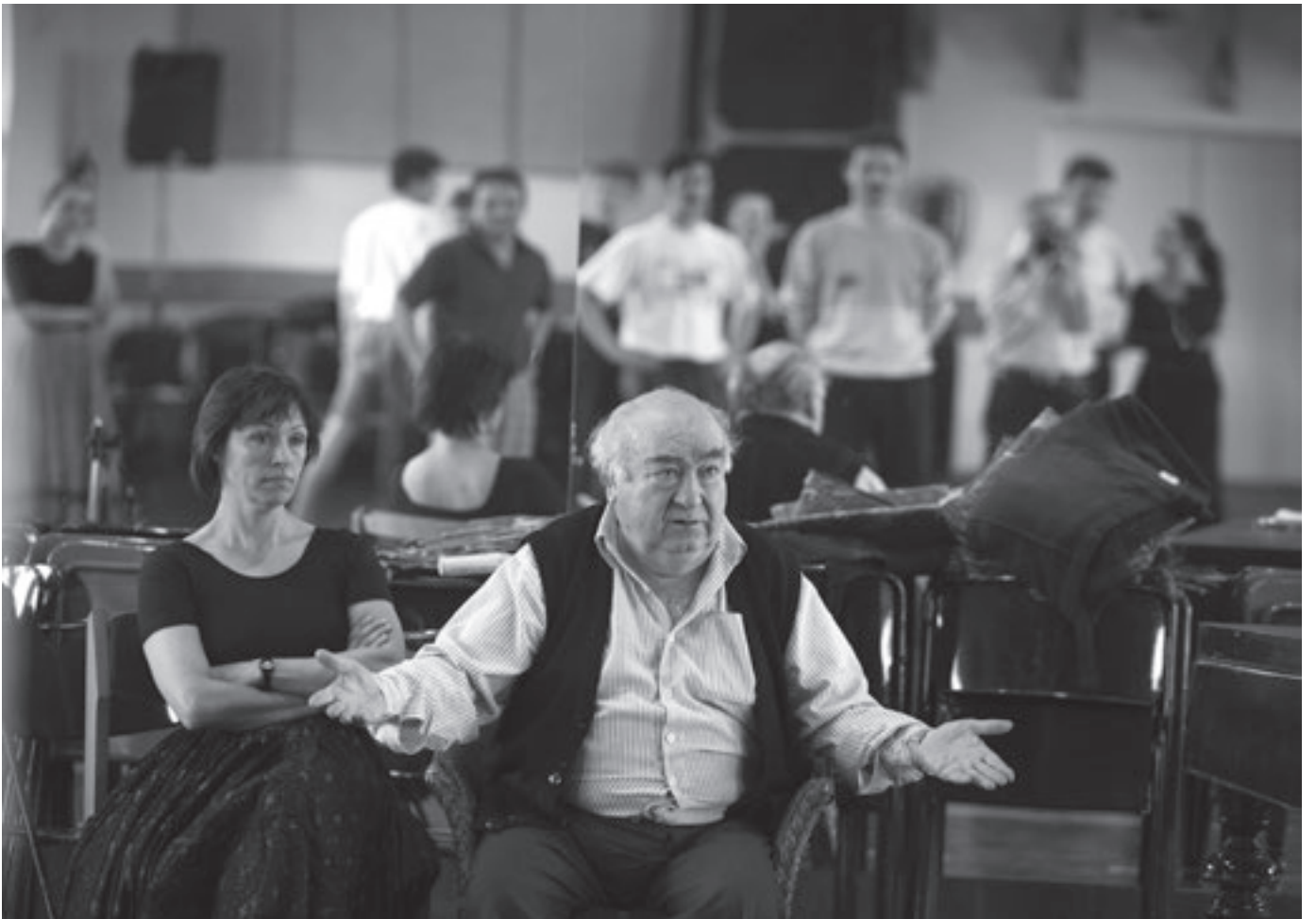
„István, a király” próba – Honvéd Táncszínház, 2009