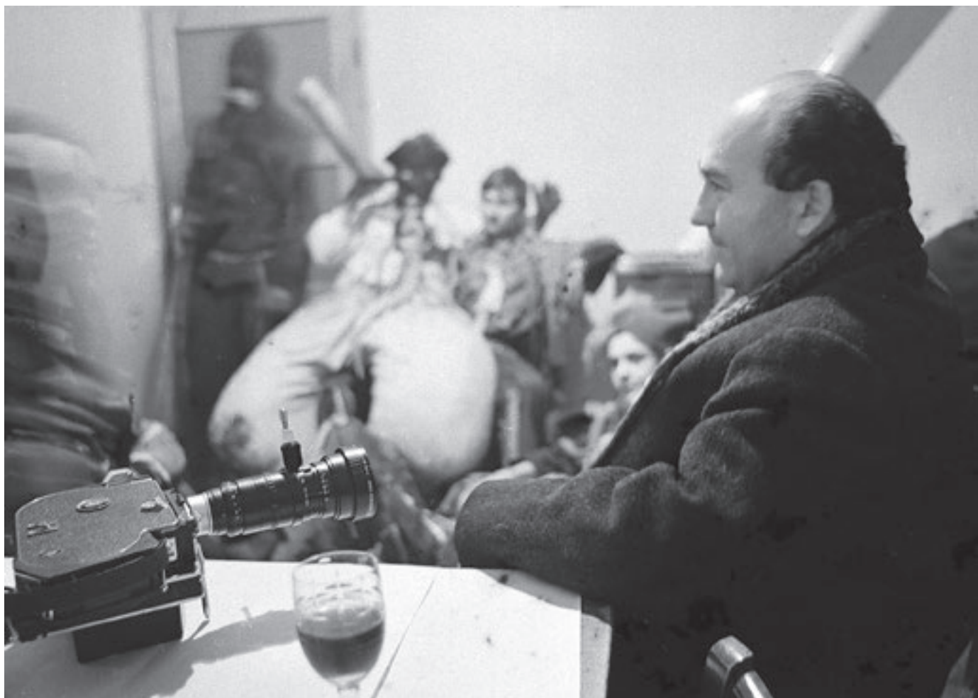
Gyűjtés közben – Moha, 1972