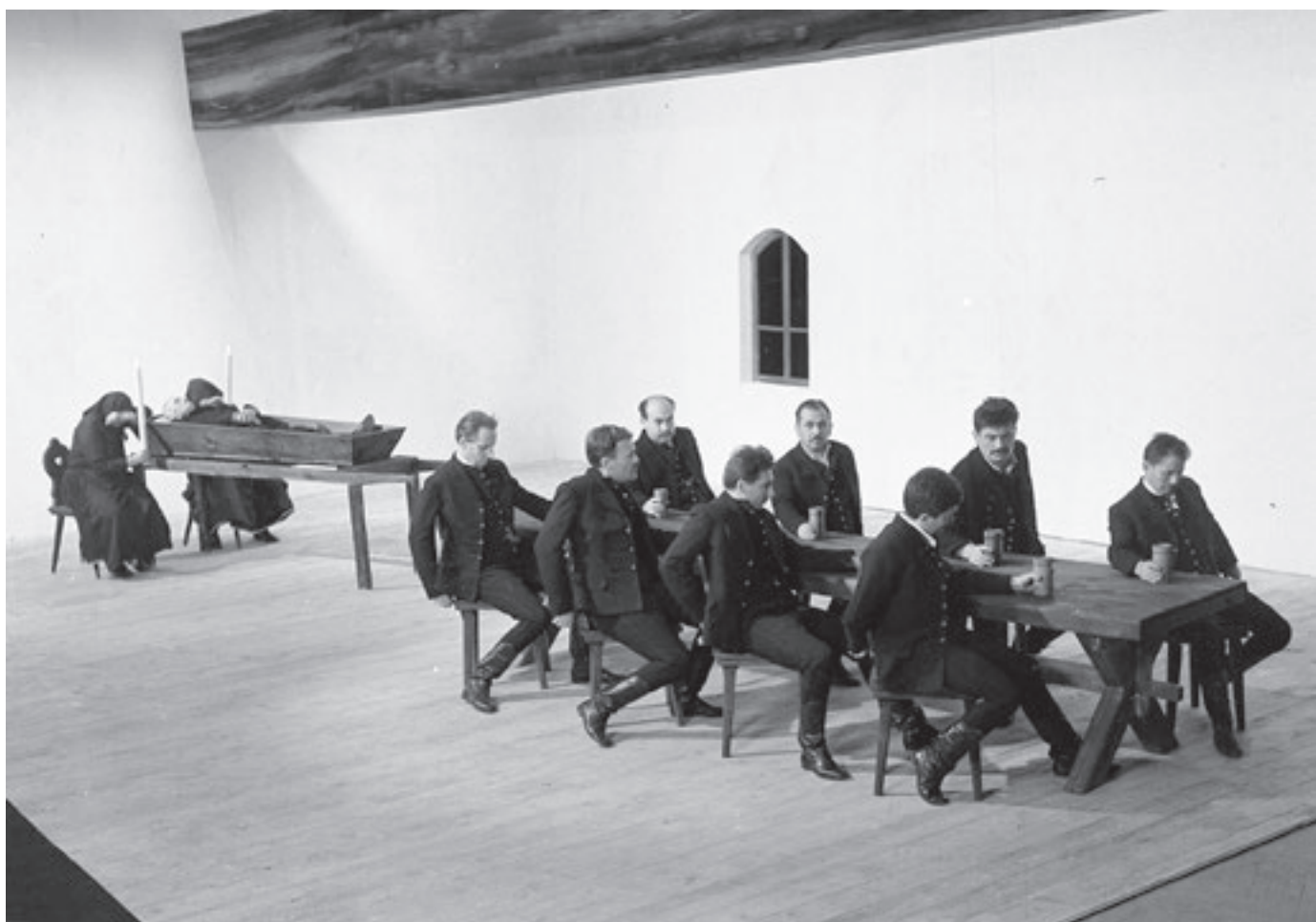
„A bölcsőtől a koporsóig” – Magyar Televízió, 1967