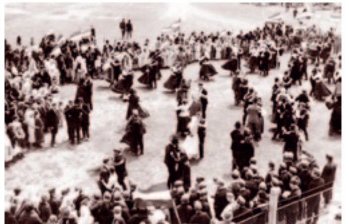
Az új bácsjózseffalvi vasútállomás és a zenélő kút avatóünnepsége, 1943. június 24.