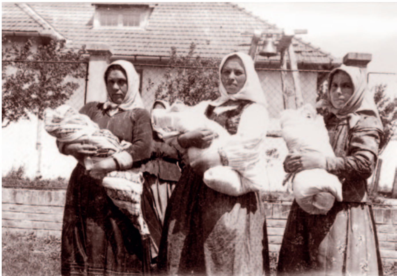
Hármas keresztelő Andrásházán. Fotó: Bognóczy Géza református lelkész, 1942. július 17.