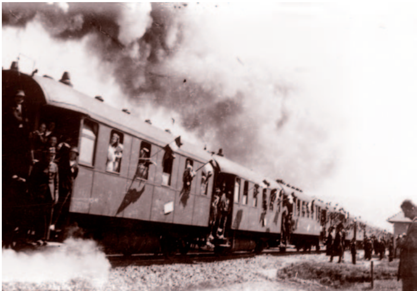
Kosna. 1941. június 3.