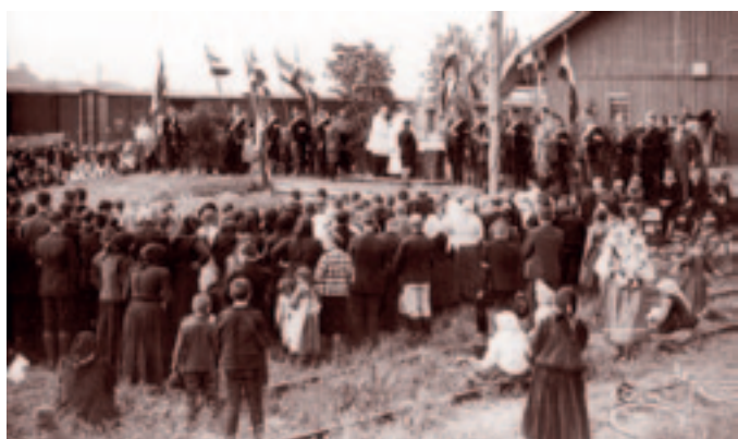
Rögtönzött mise a vasútállomáson.