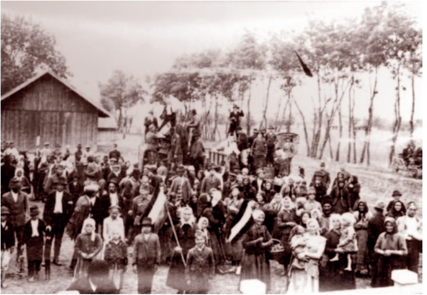
Angyalbandi állomáson. Fotó: Bognóczy Géza református lelkész, 1941. június 13.