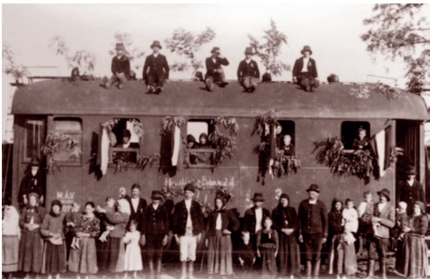
Nagyvárad. 1941. június 9.