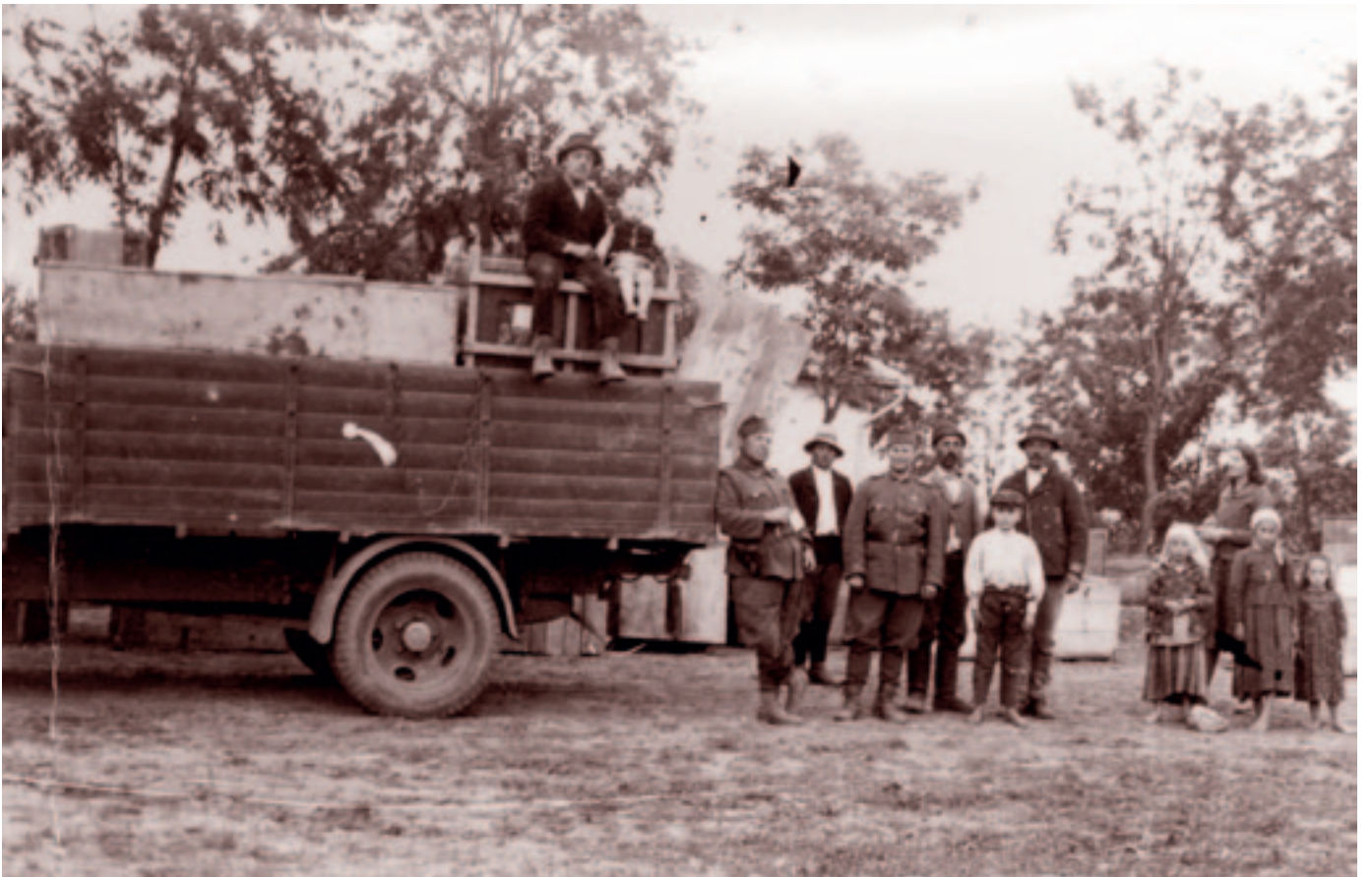
Megérkeztek a csomagok is Angyalbandi állomásra. 1941. június 23.