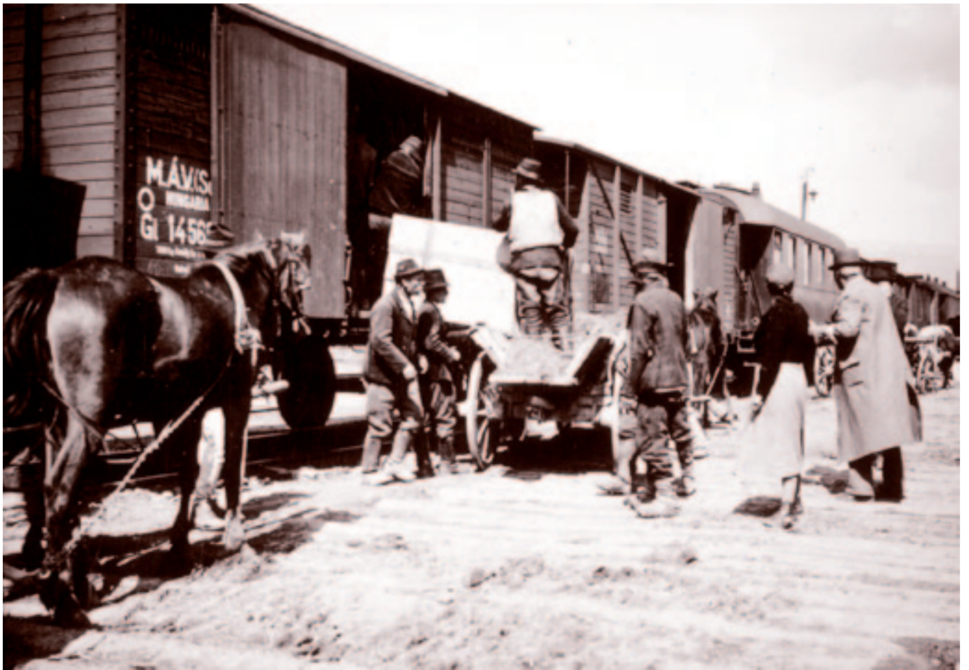
Bevagonírozás a kosnai határállomáson. Fotó: Dr. Kaiser József tisztiorvos, 1941 májusa.