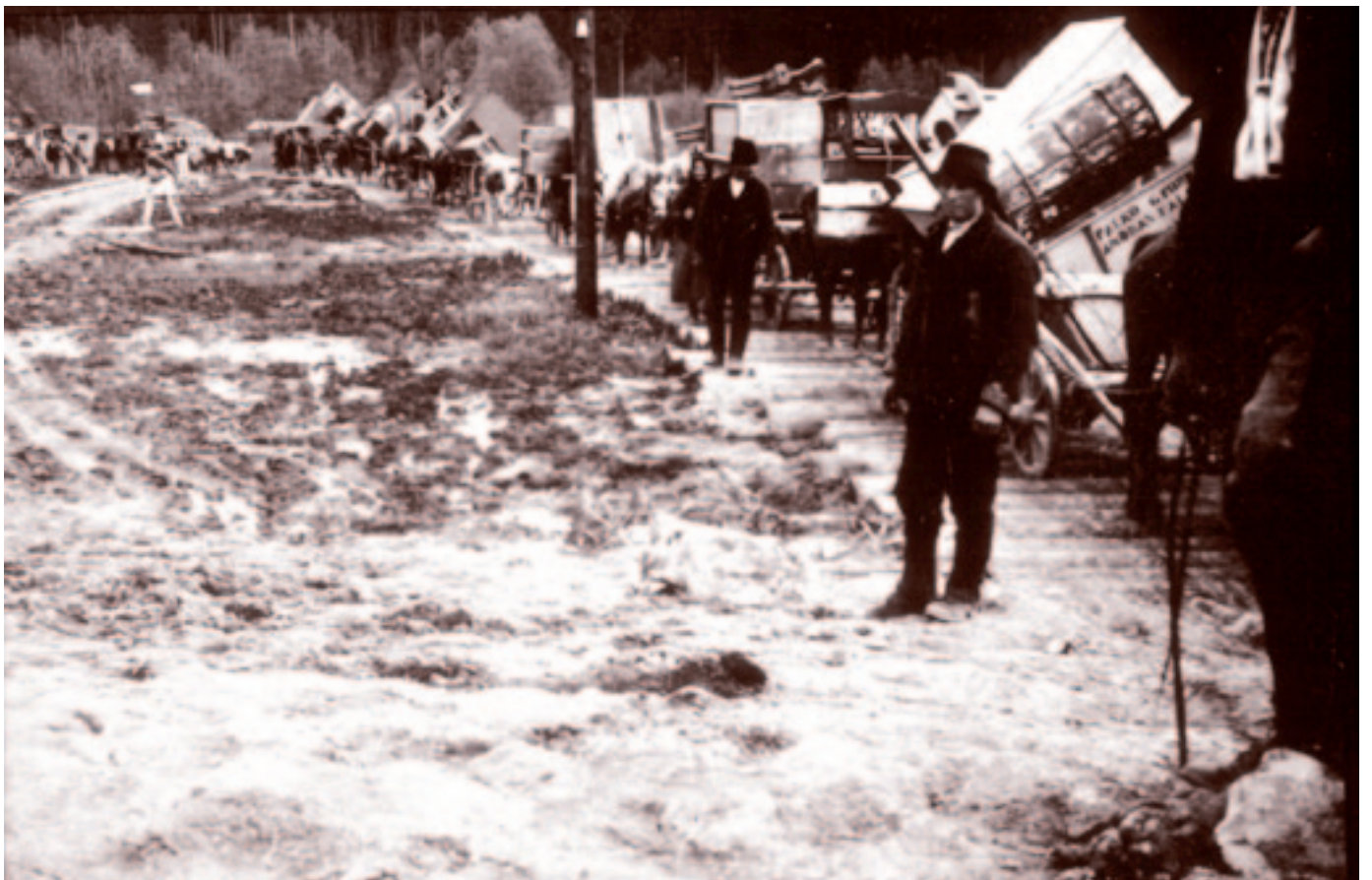
Szekerkaravánnal a kosnai határállomás felé. Fotó: Dr. Kaiser József tisztiorvos, 1941 májusa.