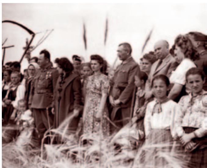
Ünnepélyesen kezdődik az első aratás. Bácska, 1941.