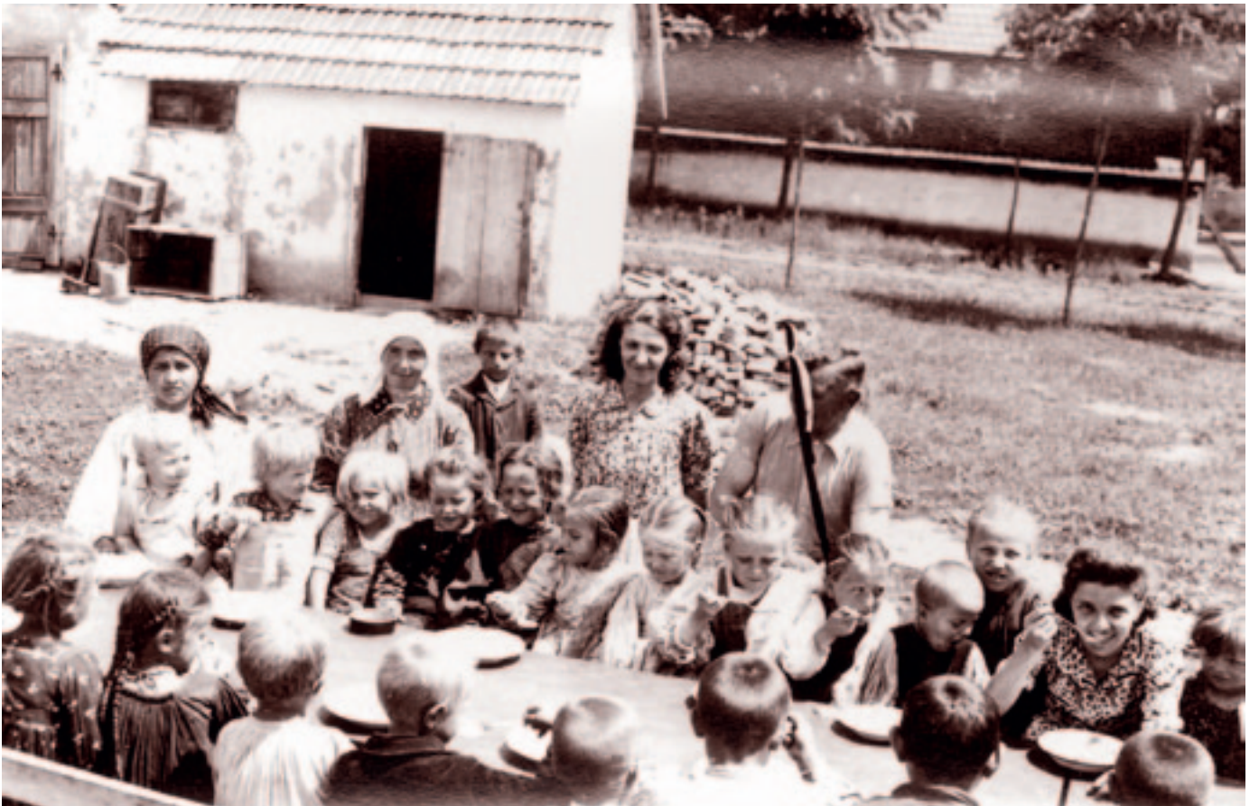
Az andrásfelkői óvoda udvarán. Fotó: Bognóczy Géza református lelkész, 1941 júniusában.