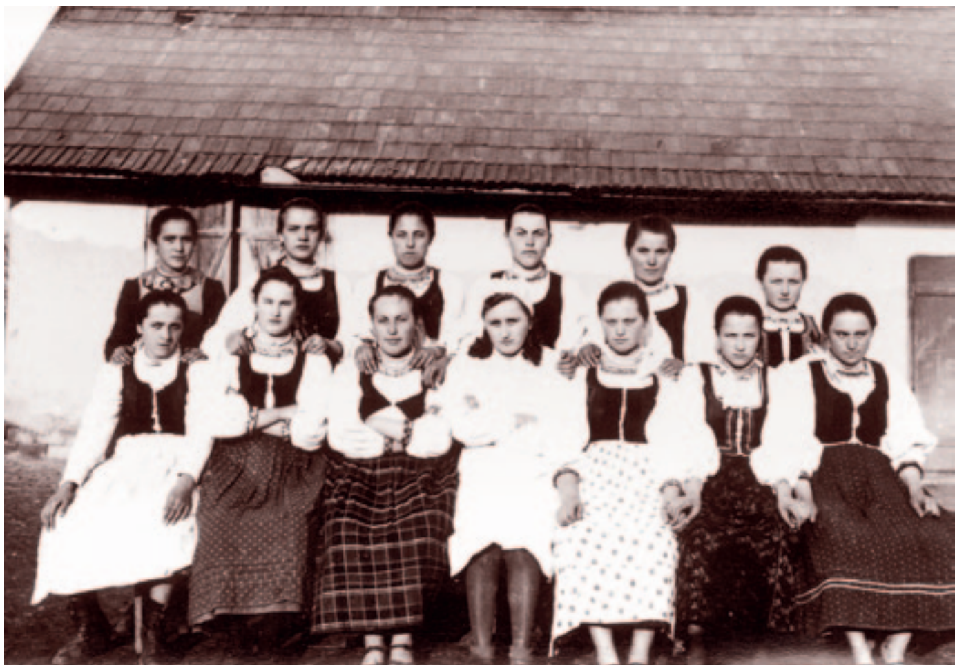
A főzőtanfolyamot végzett lányok Andrásfelkén. 1943. április 3.