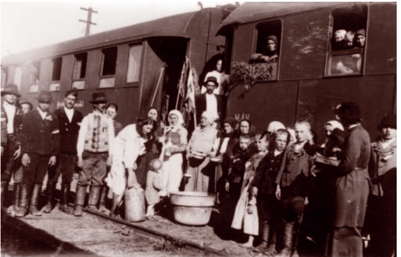
Reggelizés a rövid pihenő alatt Désen. Fotó: Bognóczy Géza református lelkész, 1941. június 6.