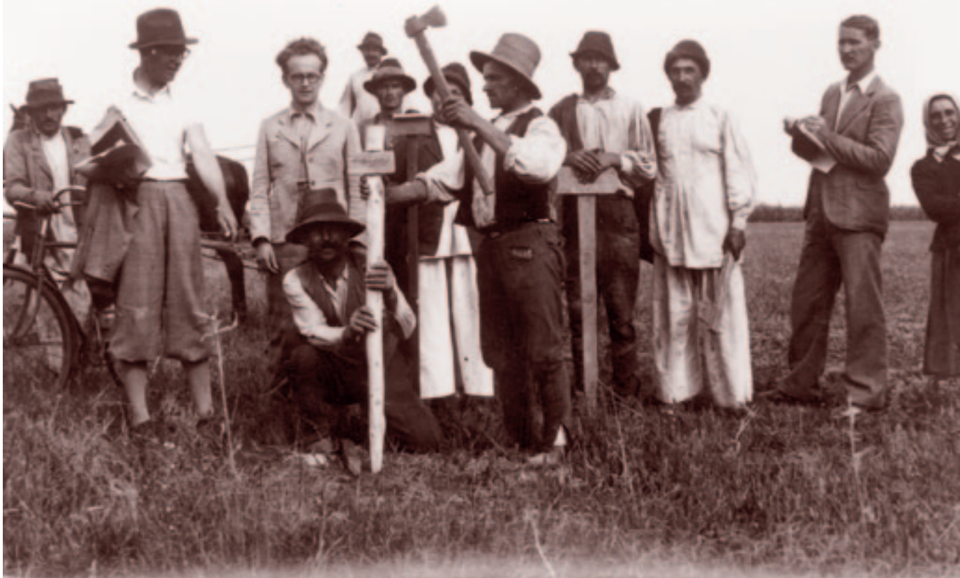
Földosztás Andrásfelkén. Fotó: Bognóczy Géza református lelkész, 1941 szeptemberében.