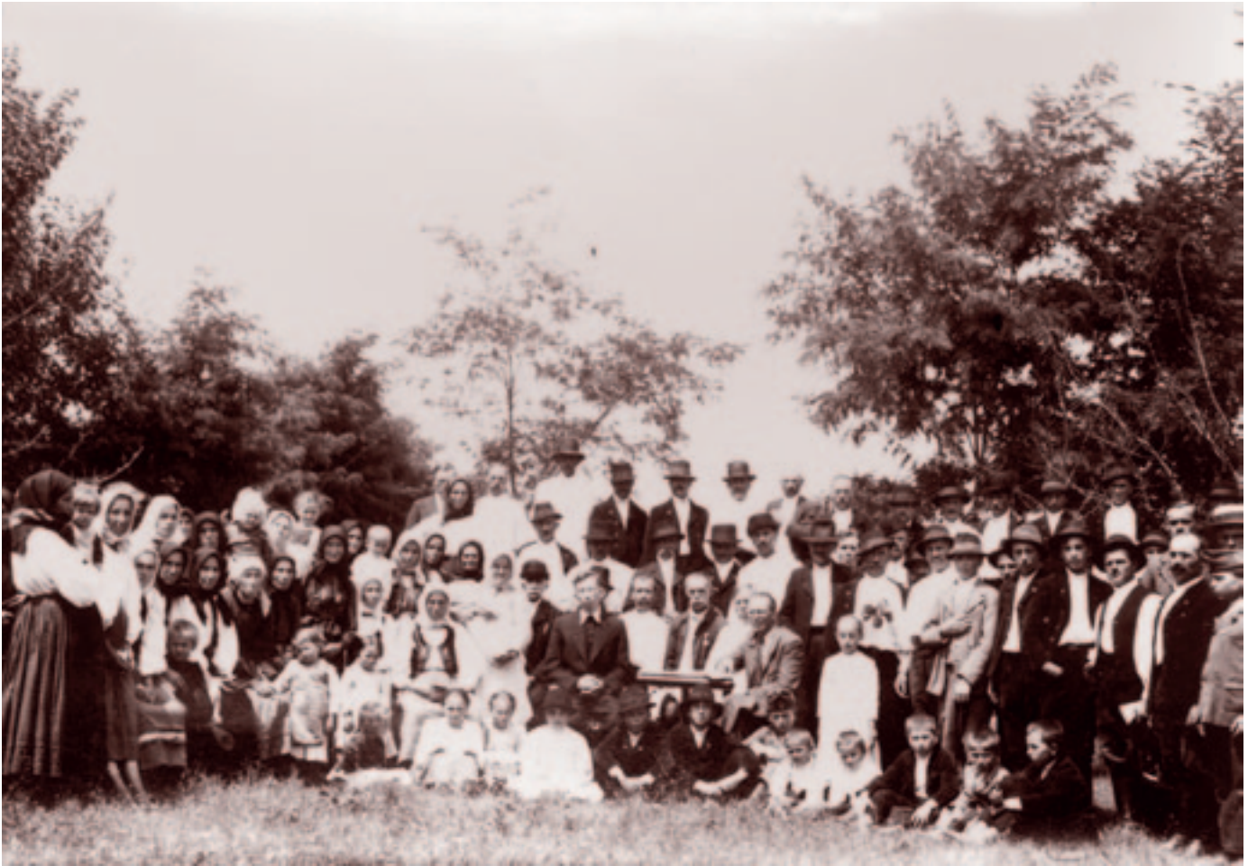
Közgyűlés Andrásfelkőn, istentisztelet után. Fotó: Bognóczy Géza református lelkész, 1941 júliusában.