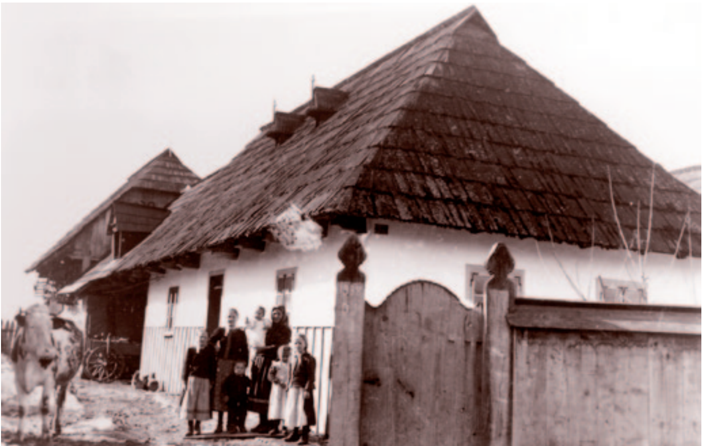
Andrásfalva, Tóth Marci János István háza. 1941. április 3.