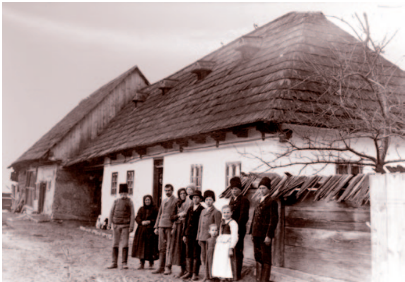
Id. Ömböli Lajos andrásfalvi „életje”. 1940. április 10.