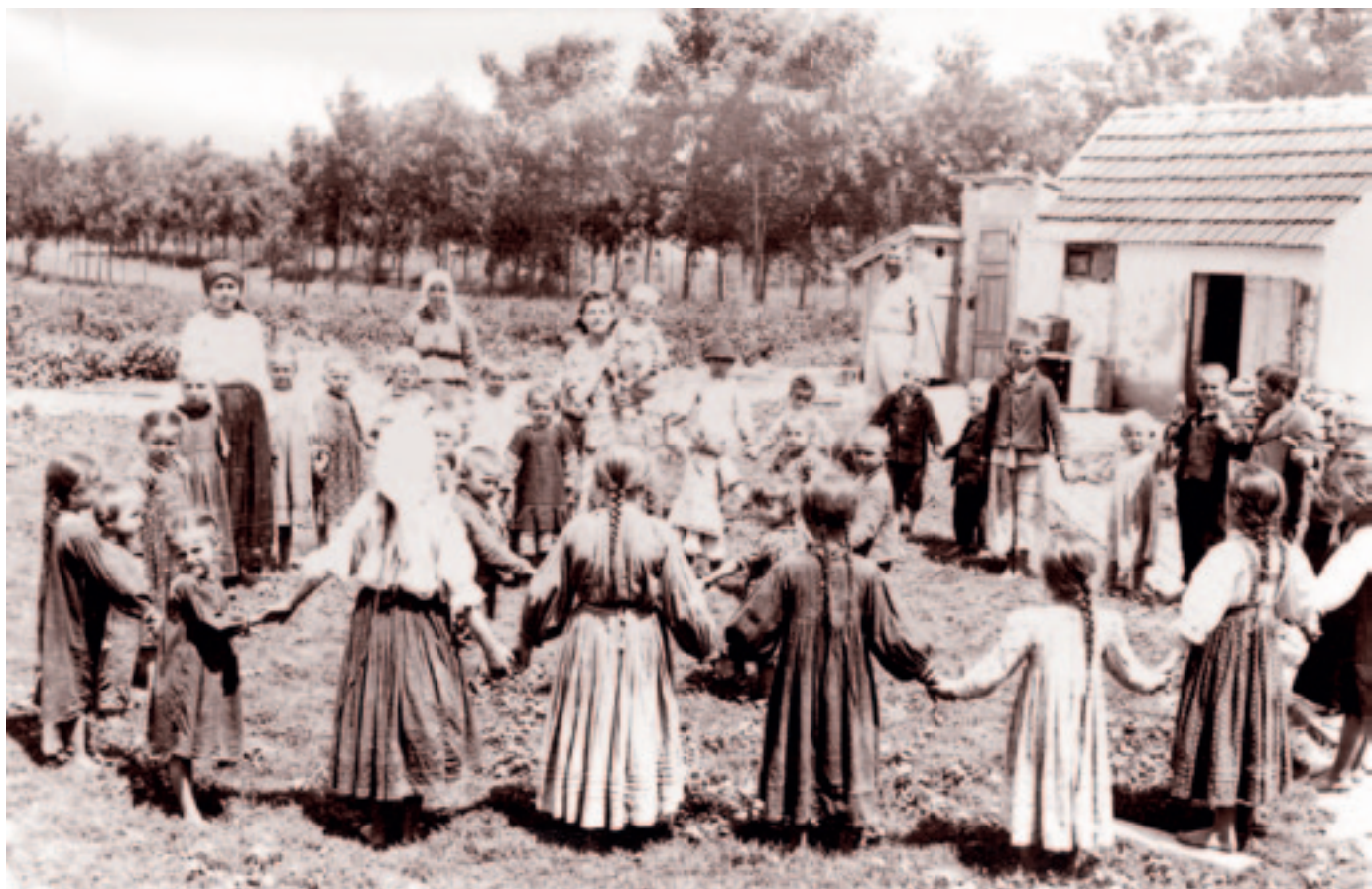
Játék az andrásfelki óvoda udvarán. 1941 júniusában.