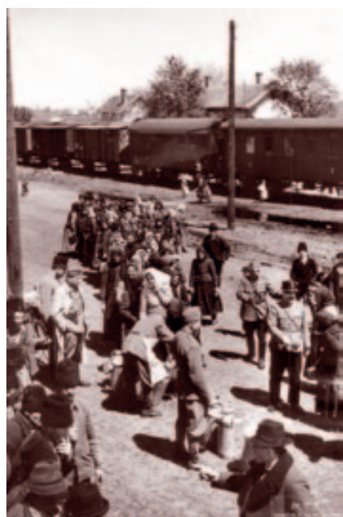
A kosnai határállomáson. 1941 májusa.