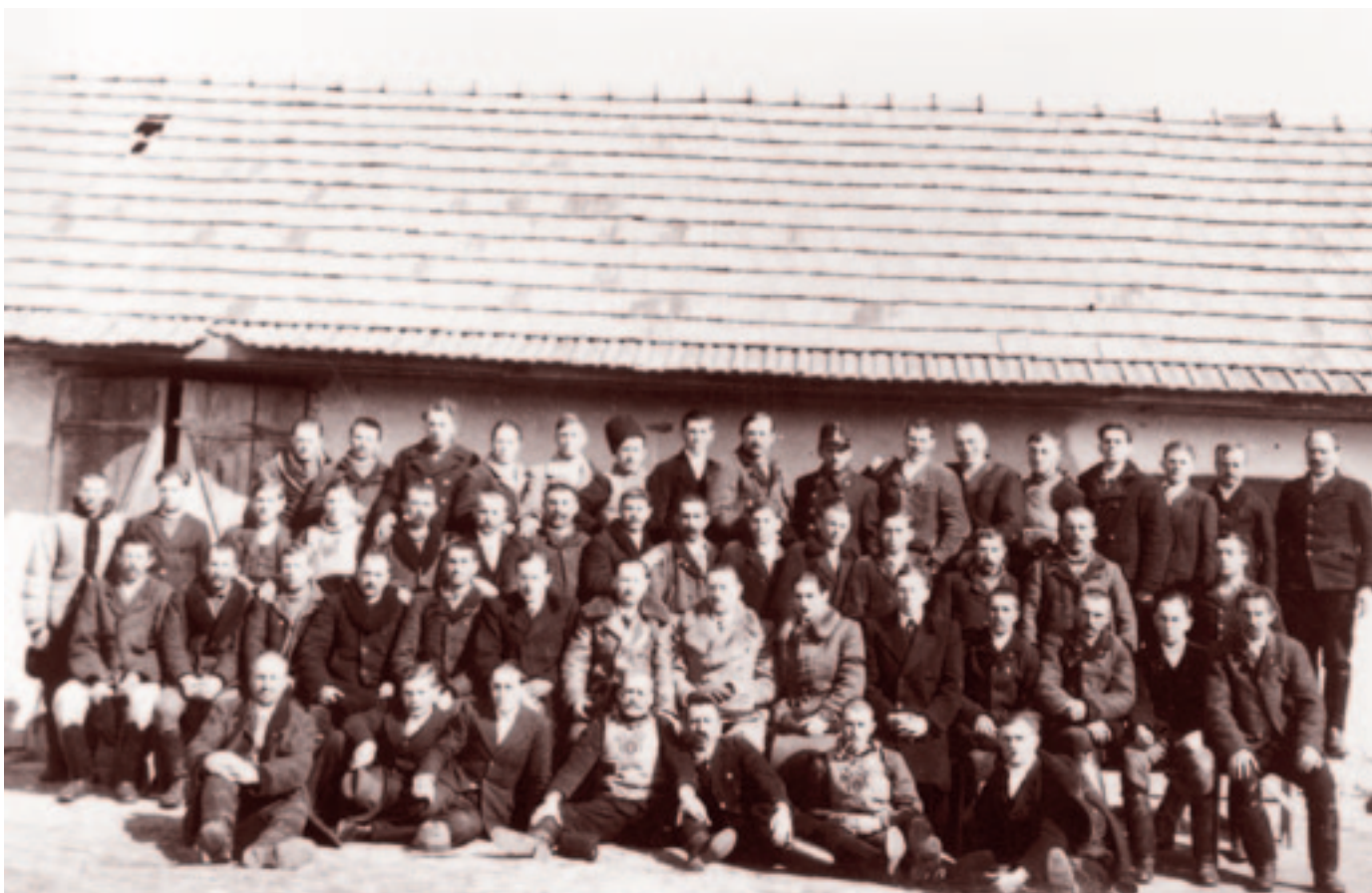
Az andrásfelki Ezüstkalászos Gazdatanfolyam hallgatói. Fotó: Bognóczy Géza református lelkész, 1942. április 6.