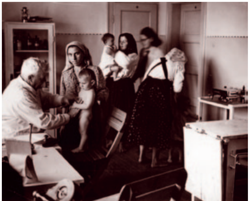
A kosnai határállomáson. 1941 május-júniusában.