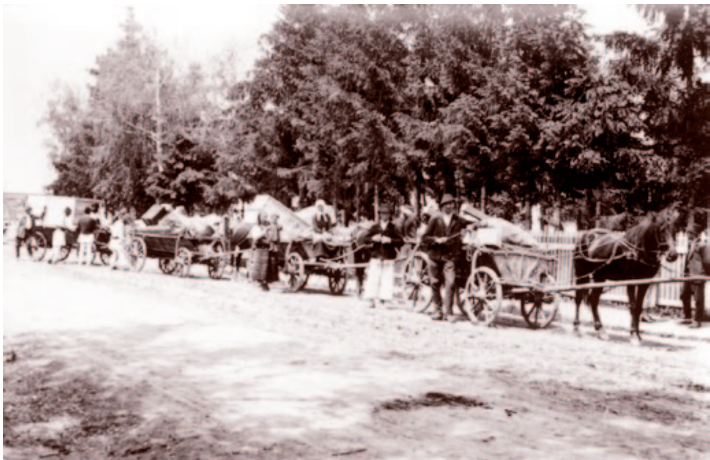
Az andrásfalvi reformátusok is búcsút vettek falujuktól. Fotó: Bognóczy Géza református lelkész, 1941. június 3.