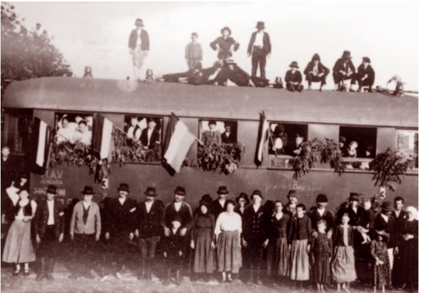
Az egeresi gipszgyár vasútállomásán. Fotó: Bognóczy Géza református lelkész, 1941. június 8.