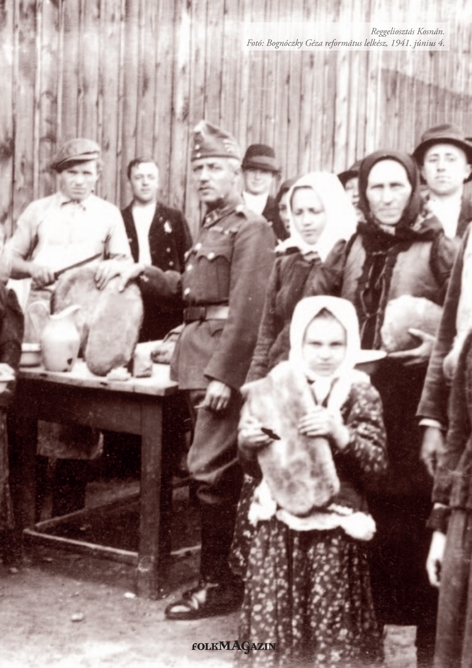
Reggeliosztás Kosnán. 1941. június 4.