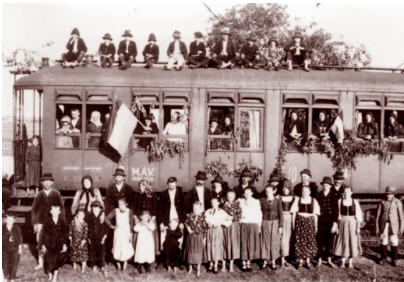
Szolnok. 1941. június 9.