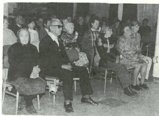
Az emlékest résztvevői