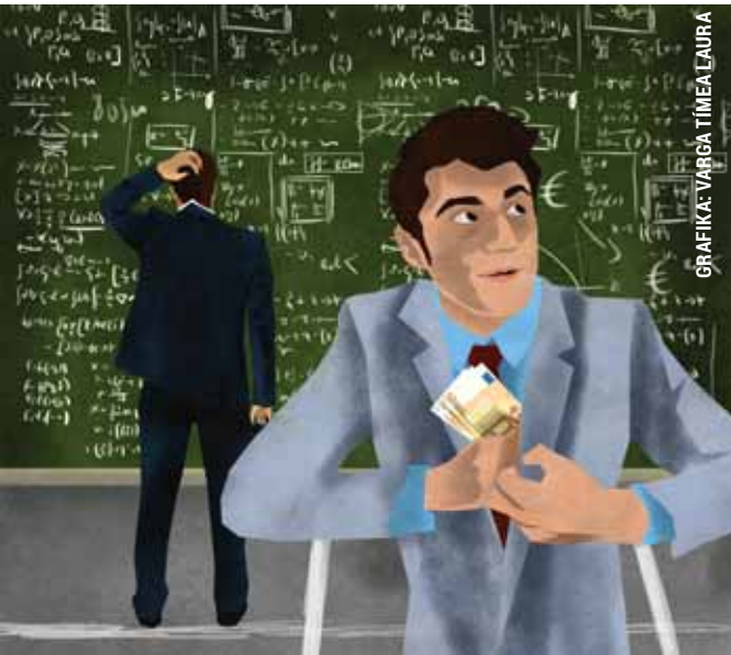
GRAFIKA: VARGA Tímea LAURA

Egy férfi 250 eurót akart átváltani az egyik kerületi bevásárlóközpont parkolójában. Az „ügyfele” azonban megpróbáltak túljárni az eszén, az egyikük lekötötte az eladó figyelmét, a másikuk pedig addig számolgatta a pénzt, míg sikerült a kialakított összeg helyett csak egy-két ezer forintot átadnia a sértettnek. A két férfit azonban sikerült elfogni a rendőröknek, akiket csalással gyanúsítottak meg.