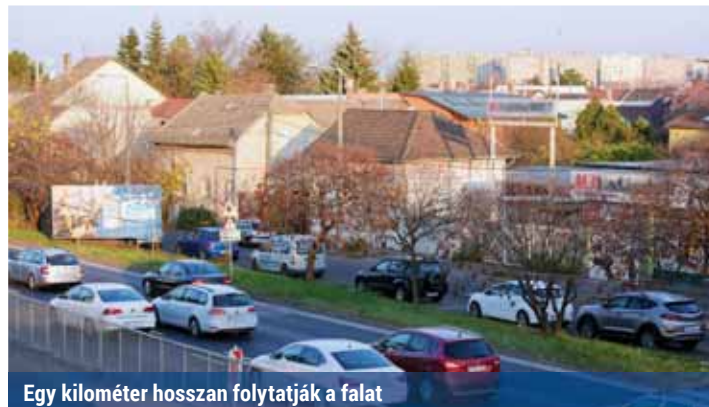
Egy kilométer hosszan folytatják a falat

Megjelent az M3-as autópálya fővárosi kivezető szakasza melletti zajvédő fal kivitelezési munkáiról szóló közbeszerzési eljárás ajánlati felhívása november 8-án. A beruházás eredményeképp a Wesselényi utca és a Szentmihályi út közötti szakasz zajvédelme is megoldott lesz. Az autópálya ki- és bevezetőjének két oldalán jelenleg szakaszosan 6 kilométer hosszon áll már a fal, a Fővárosi Önkormányzat