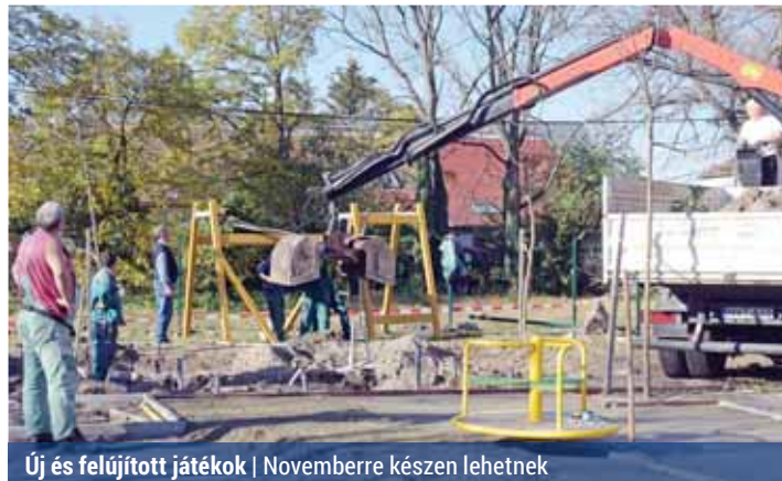
Új és felújított játékok | Novemberre készen lehetnek

Ahogy arról már beszámoltunk, két új játszótér építéséről döntött a kerület vezetése. A Répszolg munkatársai dolgoznak a terek kialakításán.