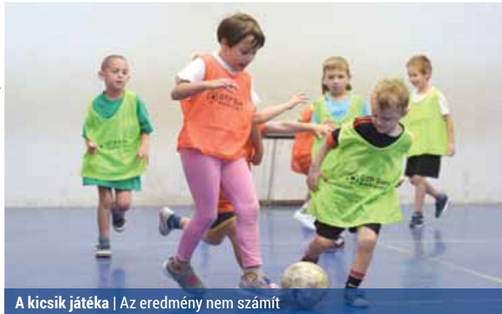
A kicsik játéka | Az eredmény nem számít

is megvolt, mert a REAC-os tornán 12 óvoda 13 csoportja képviseltette magát.