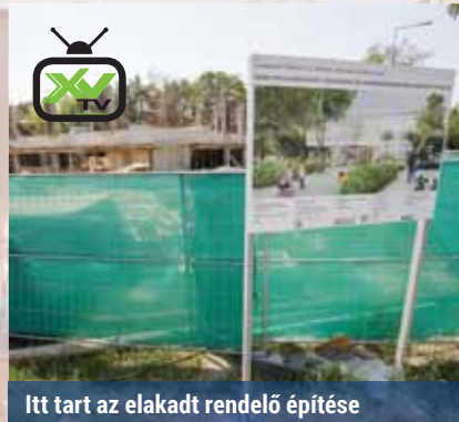
Itt tart az elakadt rendelő építése

A képviselők a munkát zárt üléssel folytatták, amelyen a Csokonai Kulturális Központ igazgatói megbízásáról tárgyaltak. Három pályázat érkezett be határidőre, ebből kettőt érvénytelennek nyilvánítottak. Hosszas vita után végül nem támogatta a