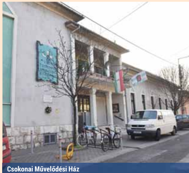
Csokonai Művelődési Ház

– Nagyon büszke vagyok a minősített intézmény címünkre. Ennek az utókövető auditján nagyobb százalékot kaptunk, mint előtte, ami azt jelenti, az intézmény szakmailag továbbfejlődött. Hiányérzetem abban, hogy valamit feltétlenül meg szerettem volna csinálni, de nem tehettem meg, nincs. Minden ötletünk, újításunk valamilyen formában megvalósulhatott. Metz