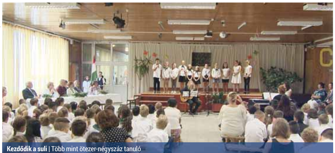
Kezdődik a sulis | Több mint ötezer-négyszáz tanuló

A Kontyfa iskolában szeptember 3-án hivatalosan is megnyitották a 2018/19-es tanévet. A XV. kerület 12 iskolájában több mint ötezer-négyszáz tanuló kezdte el tanulmányait idén ősszel. A kerület iskoláiba mintegy 153 ezer könyvet szállítottak ki. A legtöbb iskolában a diákok az első tanítási napon vehették kézbe az új könyveket – tájékoztatta lapunkat az Észak-Pesti Tankerületi Központ.