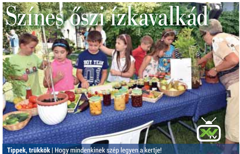
Tipppek, trükkök | Hogy mindenkinek szép legyen a kertje!

De tényleg, mikor mehet egyedül iskolába? Ha Anyán múlik, csak ha elvégezte a nyolc osztályt... Persze tudja, hogy ez képtelenség, de azt