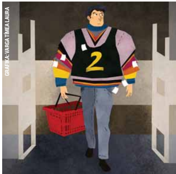
GRAFIKA: VARGA TÍMEA LAURA

Tizenhat pólót akart lopni egy férfi a kerületi bevásárlóközpont egyik divatüzletéből. A tolvaj nem foglalkozott az üzlet biztonsági berendezéseivel, egyszerűen ki akart sétálni a holmikkal, ám az áruvédelmi kapu azonnal beriasztott, a biztonsági őrök pedig visszatartották az elkövetőt. A férfi csak szabálysértési értékben lopott, de mivel ezt már nem először tette, a rendőrség vizsgálatot indított ellene.