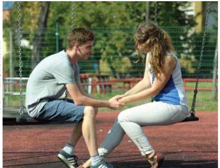
Kíváncsiság vagy valós érzelmek | Beszéljünk a gyerekekkel!

A legnehezebb, ha a gyermek eltér a családi értékrendtől az első szerelm hatására. Tehát, minél undokabb egy kamasz, minél gyakrabban váltakozik a hangulata, annál jobban igényli a beszélgetést, a segítséget. Arra is érdemes gon-