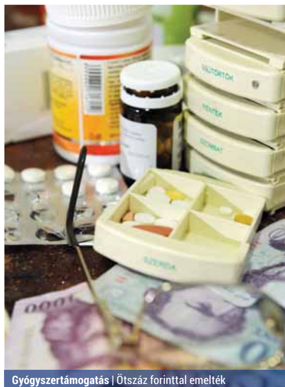
Gyógyszertámogatás | Ötszáz forinttal emelték

Új támogatási formákat is bevezettek. A Palota egészségügyi támogatást gyógyászati segédeszköz vásárlásra használhatják fel a rászoruló, évenként egy alkalommal, maximum 20 000 forint