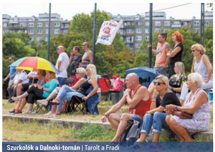
Szurkolók a Dalnoki-tornán | Tarolt a Fradi