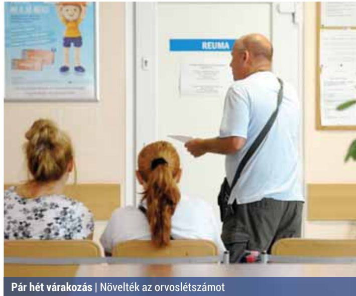
Pár hét várakozás | Növelték az orvoslétszámot

Ekkor történt, hogy a betegek egy részét átrányították a Királyhágó utcai Országos Gerincgyógyászati