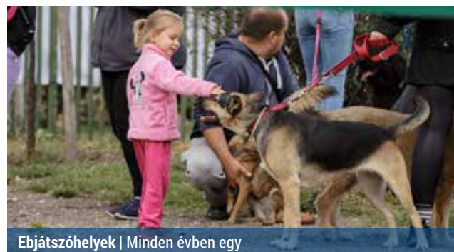
Eb játszóhelyek | Minden évben egy

Az önkormányzat figyel arra, hogy évente újabb helyszíneken legyenek kutyafuttatók. Emellett a meglévők fenntartása és karbantartása is rendszeres feladatot jelent.