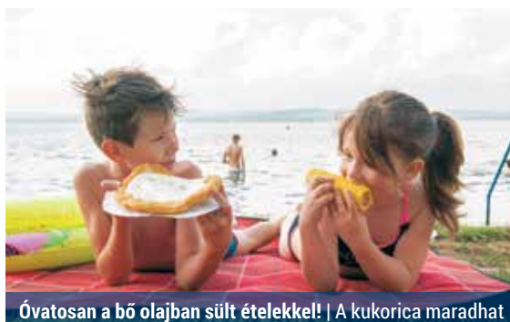
Óvatosan a bő olajban sült ételekkel! | A kukorica maradhat

– Amennyiben belefér a keretbe, a strandi büfék, éttermek kínálatából is válogathatunk, a lényeg, hogy maradjunk tudatosak. Tartózkodjunk a bő olajban