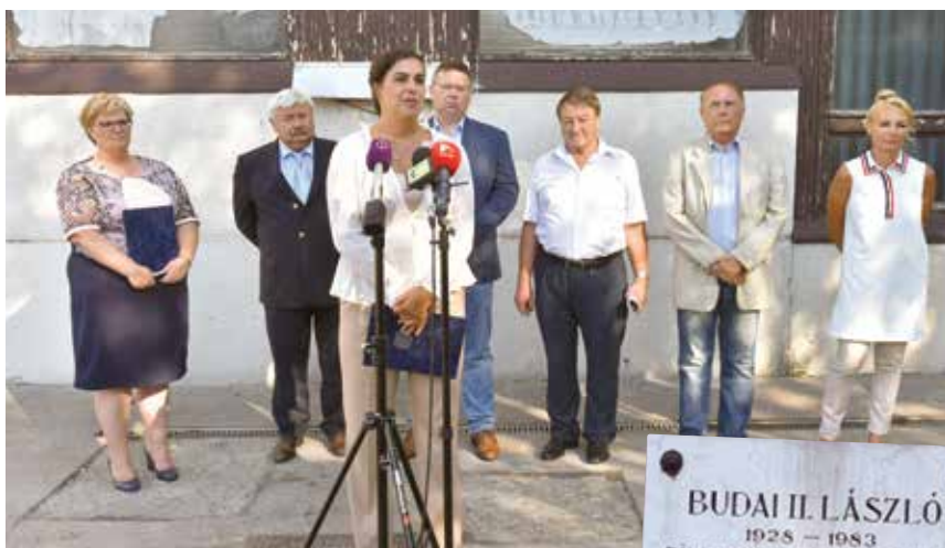
Megemlékezés a születésnapról | Szoboravatás is lesz