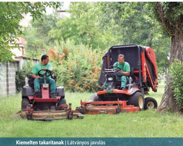
Kiemelten takarítanak | Látványos javulás

A kerület parkjaival, tereivel, zöldfelületeivel nyáron is bőven akad tennivaló. Kapálás, kaszálás, gyomlálás, öntözés ad munkát.