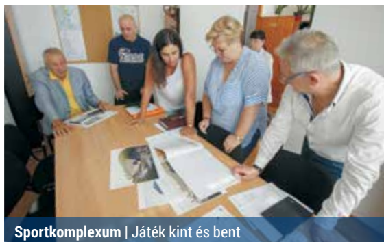
Sportkomplexum | Játék kint és bent

A tornacsarnok engedélyezési tervei most készülnek, júliusban kezdődött az engedélykérelem folyamata. Az épület 46×30 méteres csarnokból (játéktér és nézőtér), a Szántófold út felé néző kétszintes, 34×9 méteres kiszolgáló épületrészből, va-