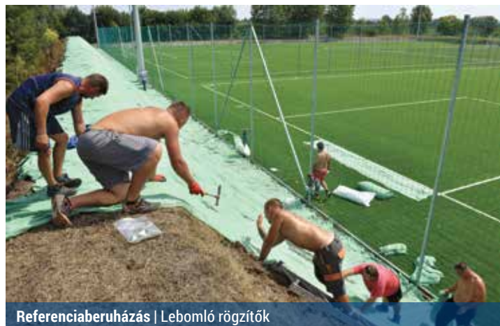
Referenciaberuházás | Lebomló rögzítők

A Szántófold úti sporttelep fejlesztéseiben a Répszolg is közreműködik. A pályák elkészülte után további infrastrukturális fejlesztéseket végeznek.