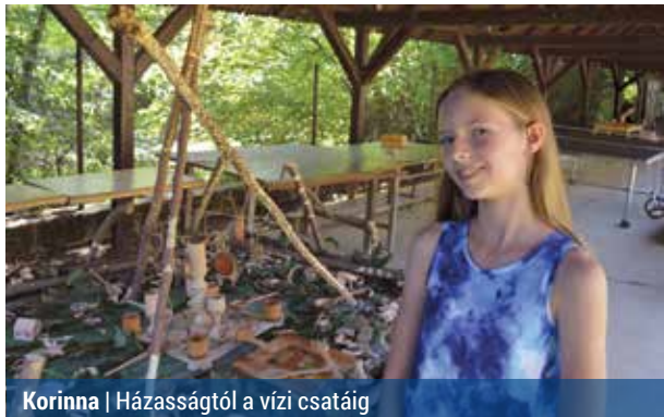
Korinna | Házasságtól a vízi csatáig