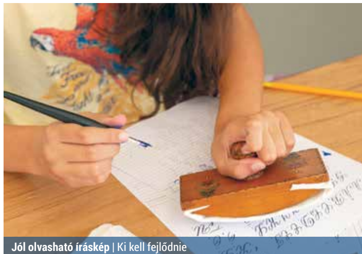
Jól olvasható íráskép | Ki kell fejlődnie

a helyesírásért, a szövegértésért, a hangformálásért és más nyelvi feladatokért felelős agyi területeket.