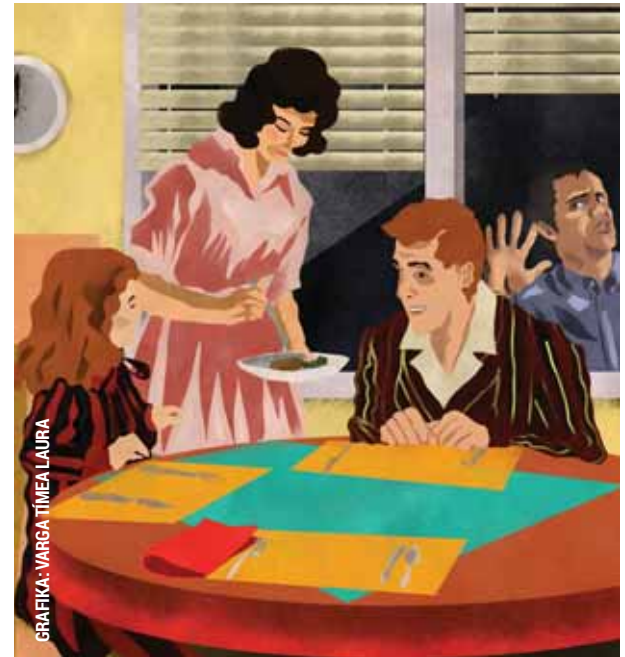
GRAFIKA: VARGA TÍMEA LAURA

A körzeti megbízottak járőrözés közben figyeltek fel egy férfira, aki több alkalommal is benézett egy társasház földszinti lakásának ablakán.