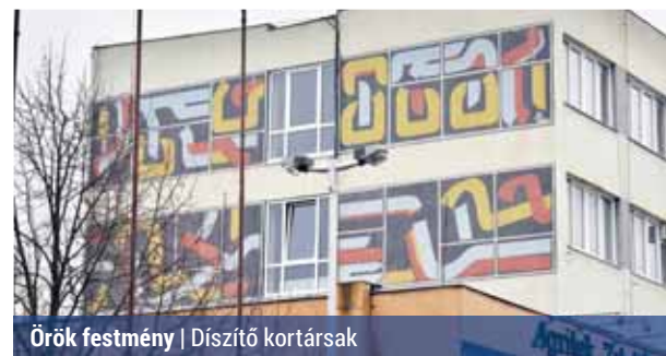
Örök festmény | Diszító kortársak

A családi történetből pedig megtudható, hogyan lehetett a hetvenes-nyolcvanas években vállalati lakáshoz jutni. Érdekes kordokumentumot jelentenek az akkori lakásárak: 1985-ben egy hétéves Kertköz utcai lakást 561 800 forintért lehetett eladni, és az Énekes utcában a legnagyobb, 74 négyzetméteres új panellakásért 919 000 forintot kértek. Ma már szinte hihetetlen, hogy az Énekes utca 1–11. szám alatti 48 lakásos társasház összértéke 39 millió forint volt 1984-ben. Cs. O.