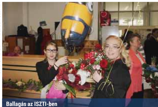
Ballagás az ISZTI-ben