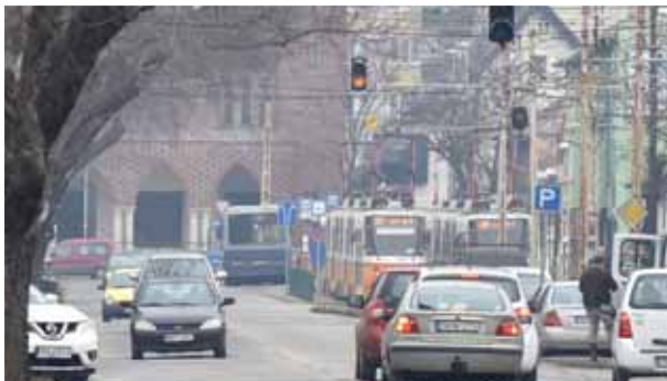
Fényszórók | Városban nem kötelező, de ajánlott!

Bár év- és napszaktól függetlenül tanácsos használni az autó világítását, a téli borús, szürke napokban még fontosabb, hogy járművünket jól lássák. Nem mindegy azonban, mikor melyik fényszórót használjuk.