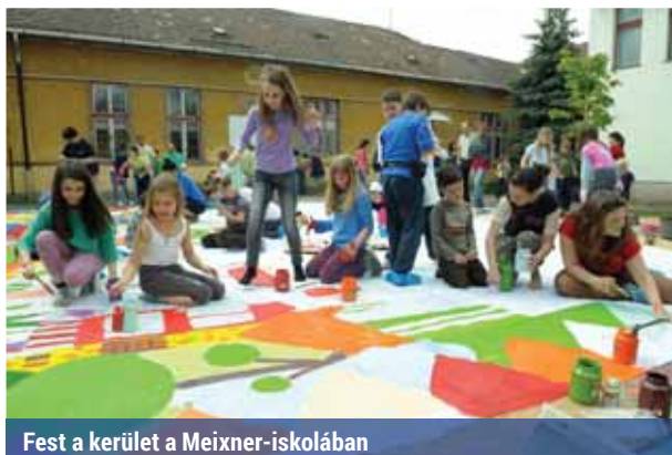
Fest a kerület a Meixner-iskolában