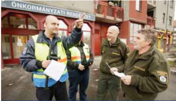
Ellenőrzött szabályok | A kutyásokra panaszkodnak

– A hozzánk beérkező jelzésekből az derült ki, hogy az állampolgárok még több egyenruhást szeretnének látni a közterületeken, ezért volt szükség erre az összefogásra – mondta a referens.