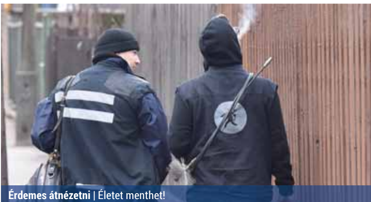
Érdeemes átnézni | Életet menthet!

A korábbi évekhez hasonlóan a Főkéztűsz továbbra is minden ingatlan-tulajdonosnak felajánl egy vagy két időpontban négyórás intervallumot, amikor kimennek ingyenes kéményellenőrzésre.