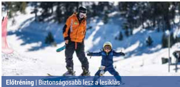
Előtréning | Biztonságosabb lesz a lesiklás

A pályán még a lesiklás előtt sem érdemes a néhány perces bemelegítést elbliccelni, ugyanis megóvhat minket az izom- és