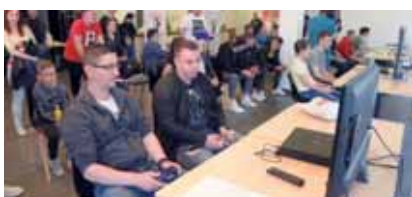
A Grosics Gyula Kapusiskola a kerületben elsőként hozta létre e-sportszakosztályát, majd március 24-én a Spirálház Pajtás Éttermében az első versenyét is megrendezte.

Városrésünkben élt a vívó olimpiai bajnok Kulcsár Győző, akiről sportolói ösztöndíjat neveztek el a kerületben. A százezer forintos támogatást évente nyolc fiatal kaphatja meg.