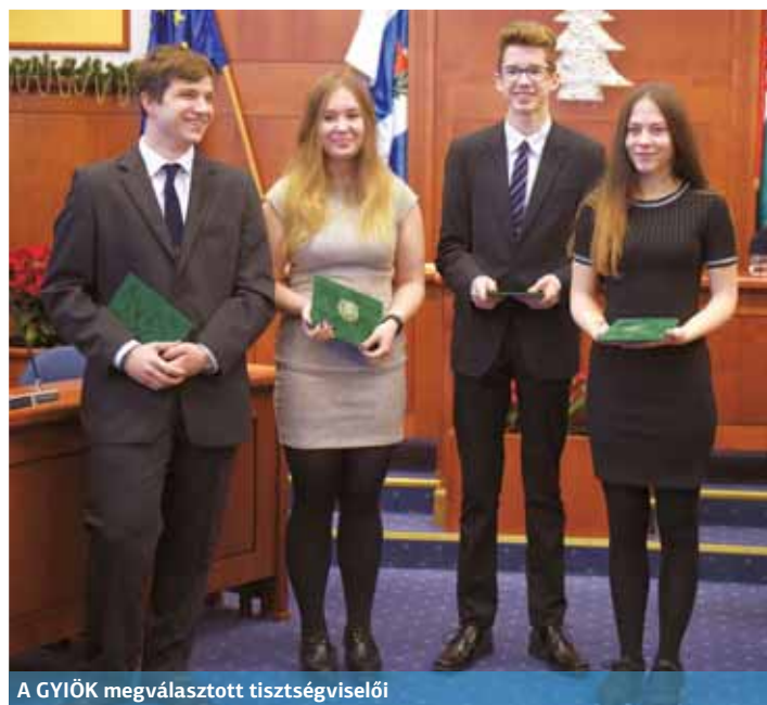
A GYIÖK megválasztott tisztségviselői

(A testületi ülések élőben és felvétellel is megtekinthetők az onkormanyzati tv és a bpxv.hu honlapokon.)