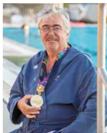
A Magyar Köztársasági Érdemrend lovagkeresztje polgári tagozat kitüntetését vehette át Kenéz György olimpiai bajnok vízilabdázó augusztus 20-a alkalmából.