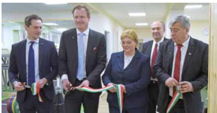
Január végén átadták az új, tízállásos súlyemelőközpontot a Budai II. László Stadion főépületének alagsorában.