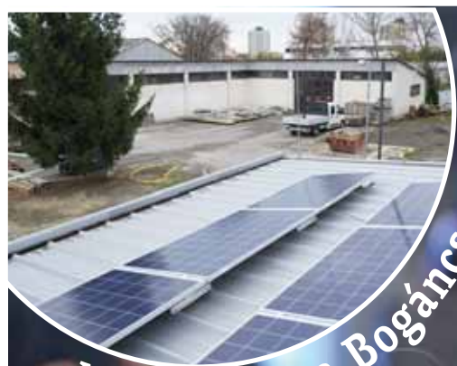
Napelemek a Bogács utcában