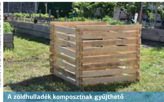
A zöldhulladék komposztálnak gyűjthető

A zero waste, azaz nulla hulladék kifejezés akármennyire is furcsa, még az 1970-es években honosodott meg Kaliforniában. Paul Palmer vegyész alapította azt a társaságot, amely kezdetben festékek és lakkok