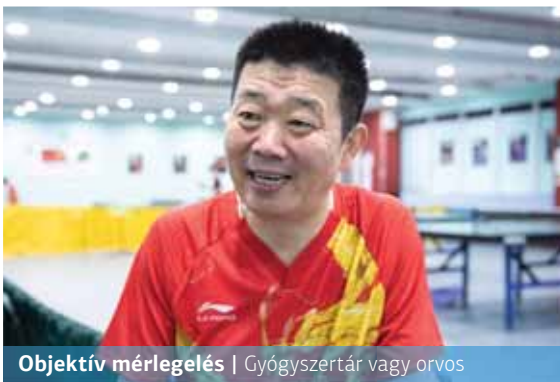
Objektív mérlegelés | Gyógyszertár vagy orvos