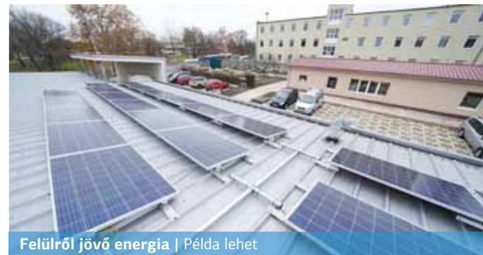
Felülről jövő energia | Példa lehet

Az elmúlt hetekben 184 napelemet telepítettek a Palota-15 NKft. Bogáncs utcai székhelyén. Ez a zöldberuházás a telephely teljes villamosenergia-ellátását biztosítja a jövőben.