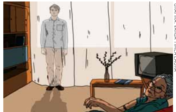
GRAFIKA: VARGA TIMEA LAURA

Egy ittas vezetés miatt körözött férfit kerestek a kerületi rendőrök. A férfit a szülei XV. kerületi címén meg is találták, és aztán átadták a büntetés-végrehajtási intézetnek.