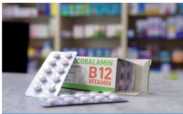
B 12 a kapszulában | Hiányában depresszió is kialakulhat

– Sajátossága, hogy egy, a gyomorban termelődő fehérje nélkül nem képes felszívódni, így annak hiánya, de egyes baktériumok, paraziták, illetve anyagcsere-problémák is gátolhatják a felszívódást. Idősebb korban kevesebb gyomorsav termelődik, így az emésztőrendszer nem tud elegendő B 12 -vitamint kivonni a szervezetből, ez is vezethet