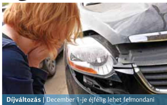
Díjváltás | December 1-je éjfélig lehet felmondani

Jövő januártól azonban még ennél is nagyobb mértékben, 15 százalékkal nőnek a díjak. Ennek oka, hogy az első fél évben ismét jelentős