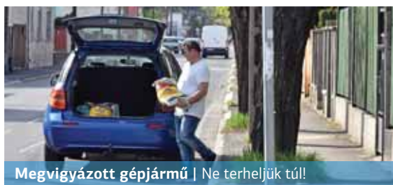
Megvigyázzott gépjármű | Ne terheljük túl!

Napi rutin; beülünk a kocsiba, beindítjuk, kuplung, váltás, gáz, fék; egy idő után már nem is figyelünk oda, hogyan tesszük mindezeket. Pedig érdemes volna, hiszen a berögzült szokásaink az autó egyes alkatrészeinek idő előtti kopását, elromlását okozzák. Nem mindegy például, milyen gázt adunk. A padlógáz, különösen alacsony fordulaton, nemcsak az üzemanyag-fogyasztást növeli meg, de a motornak is rosszat tesz – hívja fel a figyelmet a vezess.hu.