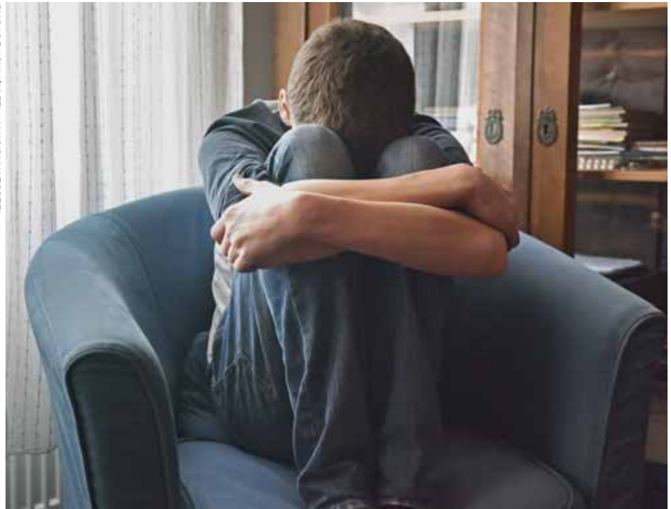
ILLUSZTRÁCIÓ: XV MÉDIA, NAGY BOTOND

A depresszió betegség, így csak klinikai pszichológus vagy pszichiáter kezelheti, de első körben az is segíthet, ha a háziorvost keressük fel a tünetekkel, ő megmondja, hova forduljunk. A pszichológus elmondta, hogy a mai napig szégyenként éli meg a beteg és a környezet is a depressziót. „Sokan nem akarnak terápiára járni, súlyosabb esetben gyógyszer szedni, megpróbálják eltitkolni az állapotukat. A családtagoknak is nagyon nehéz helyzet ez, nem lehet hosszú ideig benne lenni, mert nincs hála,