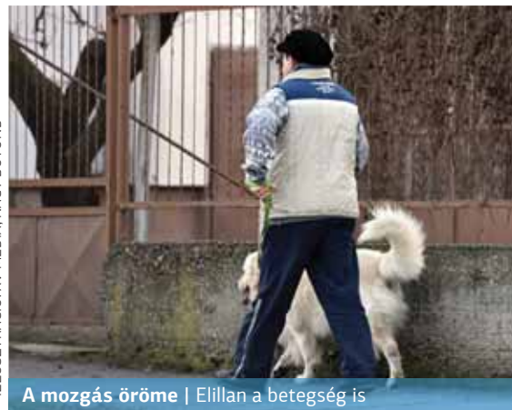
ILLUSZTRÁCIÓ: XV MÉDIA, NAGY BÓTOND