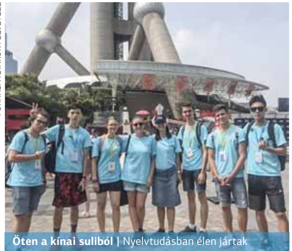
Öten a kínai suliból | Nyelvtudásban élen jártak