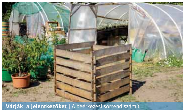
Várják a jelentkezőket | A beérkezési sorrend számít

A korábbi évekhez hasonlóan idén is folytatódik kerületünkben a házi komposztálási program.