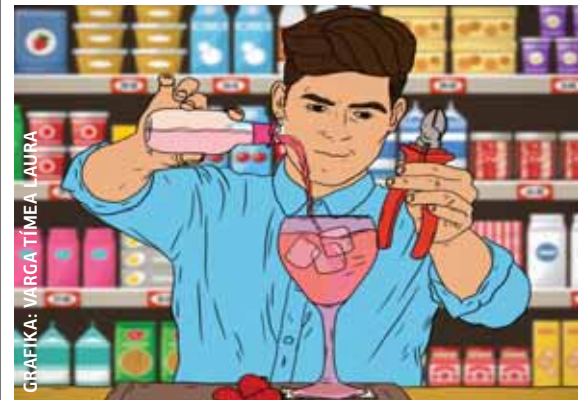
GRAFIKA: VARGA TIMEA LAURA

Az esti koktélját akarta egy férfi összeállítani az egyik bevásárlóközpontban. Ezért egy csípőfogót is magával vitt, amivel az ital alapjául szolgáló szeszes italról lecsippentette az áruvédelmi eszközt. Az üveget egy flakon ásványvízzel együtt a táskájába tette, majd egy másik ásványvízzel a kezében a pénztárhoz szietett, ahol már várták őt a biztonsági őrök, akik a rendőrök kérésére visszatartották a férfit. ♦