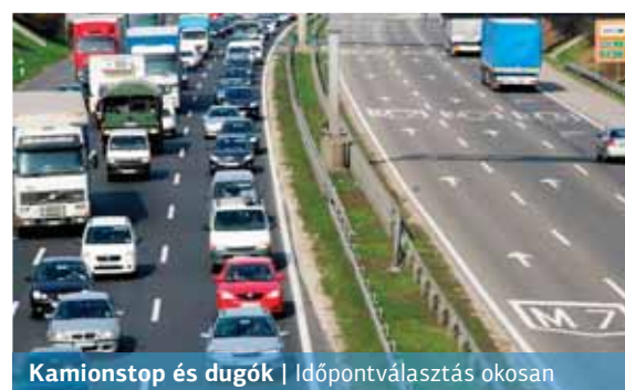
Kamionstop és dugók | Időpontválasztás okosan

Ha mégis útnak indulunk, és erős forgalmat tapasztalunk, netán egy