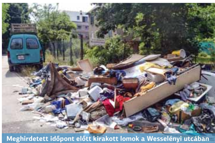
Meghirdetett időpont előtt kirakott lomok a Wesselényi utcában

Sokan már napokkal a meghirdetett időpont előtt kihordják a