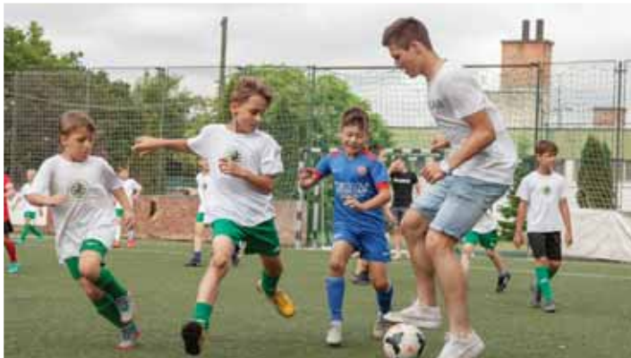
Büszke akadémia | Tehetségeik a válogatottban