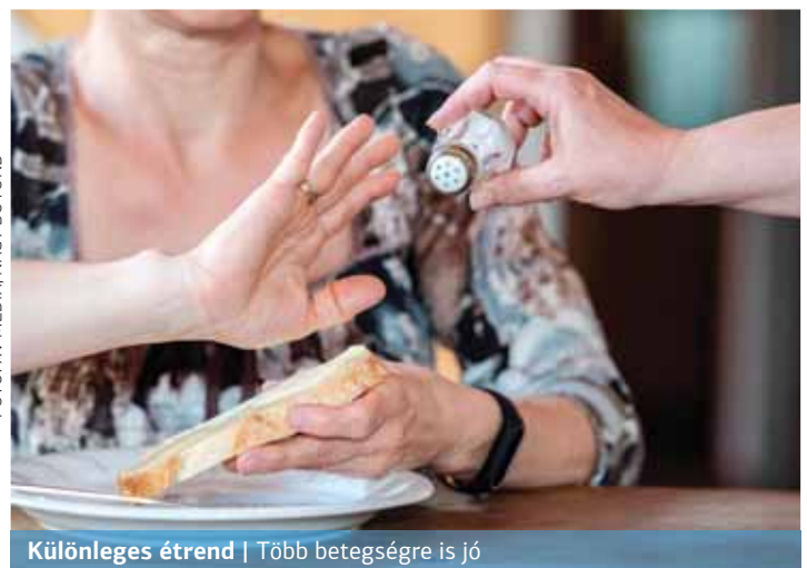
Különleges étrend | Több betegségre is jó

Az étrendben a szénhidrátok fő forrásai a teljes kiőrlésű gabonafélék, száraz hüvelyesek, zöldségek, illetve gyümölcsök. A zsiradékszükségletet elsősorban növényi eredetű forrásokból (olívaolaj, olajos magvak), illetve halból fedezi, de a zsiradékok magas