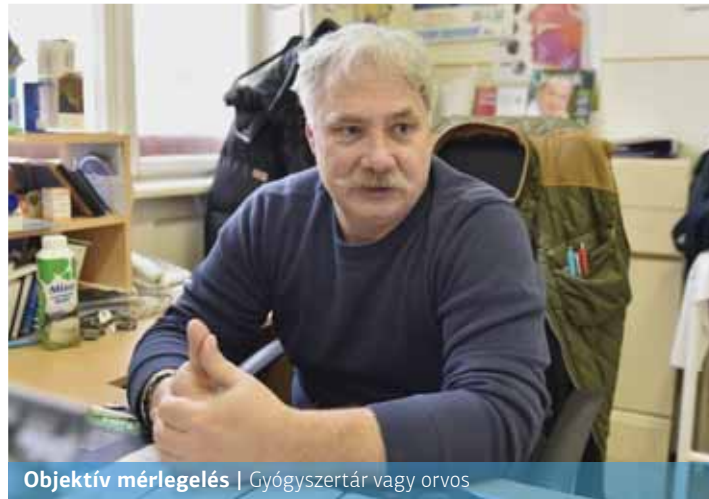
Objektív mérlegelés | Gyógyszerésztár vagy orvos

A nyári időszakban kiemelten oda kell figyelni a bőrünk védelmére. Nagyon fontos, hogy ha napon vagyunk, megfelelő faktorszámú naptejet használjunk! Mi a megfelelő faktorszám? Minél magasabb, annál jobb. Különösen a fényre érzékeny területeket, például az arcot érdemes