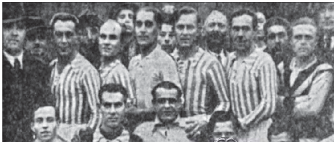
Összeolvadások sorozata | A RESC csapata 1938-ban

Az eddig felderített klubbörténetet nem lehet röviden bemutatni, ezért koncentráljunk a pályájukra és a csapat-összeolvadásokra. A Rákospalotai Atlétikai Klub pályája a Széchenyi téri templom mögött volt, aztán átkerültek a Szentmihályi út melletti játéktérre, de engedélyt kértek 1914-ben a községtől, hogy visszamehessenek a Széchenyi térre (a mai REAC-stadion északi oldalára). Az I. világháború után évek kellettek, mire újra összeállt a futballcsapat, 1924-ben választott