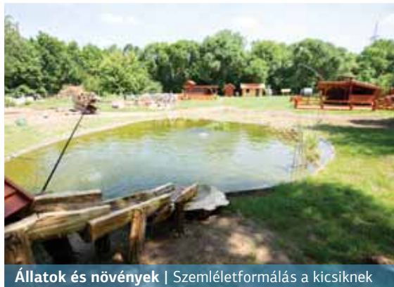
Állatok és növények | Szemléletformálás a kicsiknek

Június elején ünnepelte a Rákossmenti Mezei Őrszolgálat működésének tizedik évfordulóját. Az ünnepség helyszíne Rákosszentmihályon, a Sarjú utcai új telephelyük volt, ahol másfél év alatt rengeteg munkával egy Tanyaudvart alakítottak ki. S bár ez utóbbi még nem készült el teljesen, a tizedik születésnap akár egy udvaravató is lehetett volna.