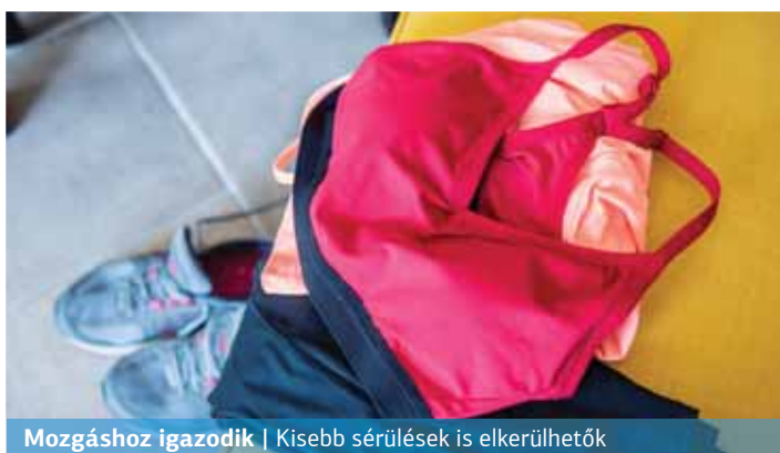
Mozgáshoz igazodik | Kisebb sérülések is elkerülhetők

Az elmúlt száz évben azonban ezen a területen is óriásit változott a világ. A technikai anyagok folyamatos kutatás és fejlesztés alatt állnak azért, hogy az akár hobbi-, akár versenysportolók a legnagyobb kényelemben és teljesítménykapacitás mellett mozoghassanak.