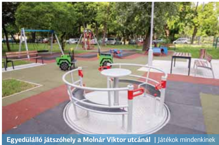
Egyedülálló játszóhely a Molnár Viktor utcánál | Játékok mindenkinek

Tavaly – a környező kerületekben is egyedülállóan – egy integrált játszótér épült a Molnár Viktor utca – Lócsevár utca sarkán, ahol a mozgáskorlátozott, sérült és ép gyermekek együtt játszhatnak. A játszóhelyen hat játszóeszköz (kerekeszékés hinta, kerekeszékkel is használható forgójáték, fészekhinta, integrált rugós libikóka és homokozó, többfunkciós játék) várja a kisebbeket és nagyobbakat. A Drégelyvár utca Pestújhely felőli oldalán szintén új játszótér létesült, ahol több korosztály számára is sokféle lehetőség van a szabadidő eltöltésére.