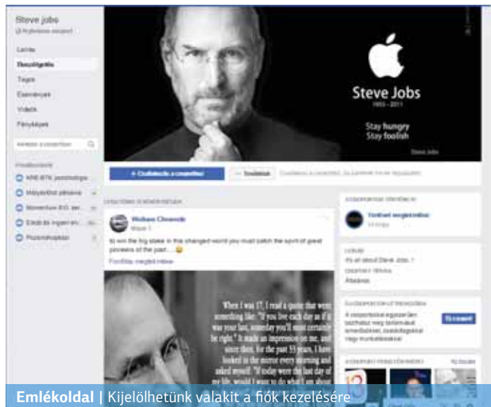
Emlékdal | Kijelölhetünk valakit a fiók kezelésére.

A közösségi média sűgő oldala többféle megoldást kínál: rendelkezhetünk mi magunk a személyes oldalunk sorsáról, eldönthetjük, halálunk után töröljék az egészet vagy kijelölhetünk egy úgynevezett hagyatéki kapcsolattartót. A hagyatéki kapcsolattartó az az ember, akit a fiókunk gondozására kiválaszthatunk, ha emlékdalt sze-