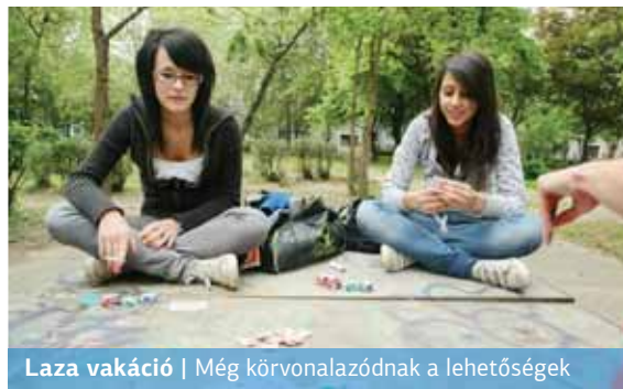
Laza vakáció | Még körvonalazódnak a lehetőségek