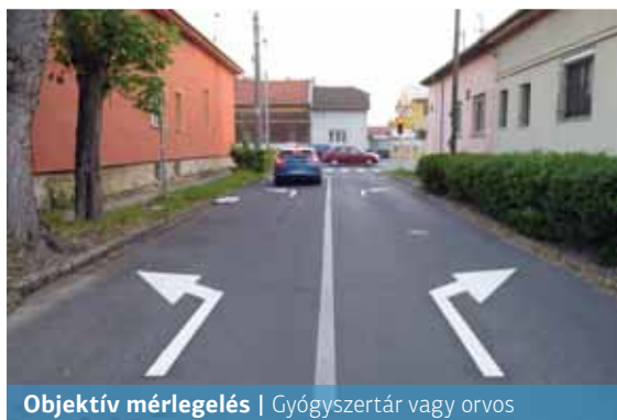
Objektív mérlegelés | Gyógyszertár vagy orvos

A határolt területen – a Rákosmező utca kivételével – Tempo 30-as övezetet alakítottak ki. Fontos információ, hogy megváltozik a forgalmi rend: az „Elsőbb-ségadás kötelező” táblákat