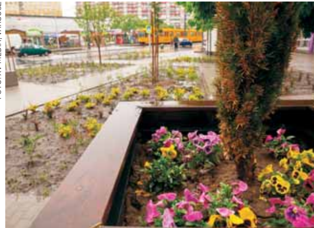
Üde zöld | Évelők és cserjék tették színesebbé

– A felújítás során a meglévő elhasználódott, törött magaságyásokat elbontották, a tér teljes területén feltörték a régi aszfaltburkolatot, helyére új, melírozott hatású térkővet raktak le. Új utcabútorok – egyszemélyes üldökockák, szemetesek, biciklitároló, növénytartók – kihelyezésével lett teljes a tér átalakítása – mondta el lapunknak Gál Gyöngyi városüzemeltetési osztályvezető.