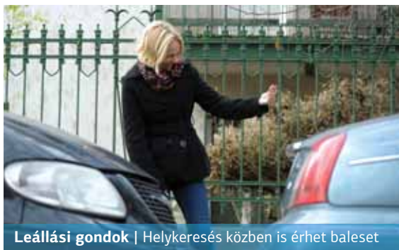
Leállási gondok | Helykeresés közben is érhet baleset

Legalábbis a fővárosban nem szeretünk leállni, de-rül ki a budapesti parkolást másfél éve segítő applikáció, a Parkl és a vezess.hu közös közvélemény-kutatásából.