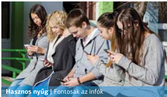
Hasznos nyűg | Fontosak az infók

Manapság ritkán látunk tizenévest a kezében tartott telefonja nélkül. Használják vajon iskolával kapcsolatos információcserére vagy esetleg tanáraikkal is tartanak így kapcsolatot? Megkérdeztünk erről a témáról egy anonim, online, nem reprezentatív kérdőív segítségével középiskolásokat, és az eredmények alapján határozott igen a válasz.