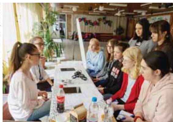
Szülői engedéllyel 15 éves kortól lehet dolgozni

A helyi Munkanélküli Ifjúsági Tanácsadó Irodája (MUFTI) ugyanis hat iskolaszövetkezettel karöltve diákbörzét szervezett, ahol pályaválasztási tanácsadás mellett főként a nyári diákmunkára fókuszáltak. A rendezvényen többségben az iskola diákjai vettek részt, de más intézményekből is kilátogattak érdeklődők. Sőt barátokkal, illetve szülői kísérettel is jöttek kamaszok, hogy információhoz jussanak a témával kapcsolatosan.