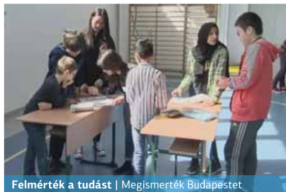
Felmérték a tudást | Megismerték Budapestet

Tizedik éve rendez meg a Magyar-Kínai Két Tanítási Nyelvű Általános Iskola és Gimnázium a „Tudok Magyarul” budapesti „magyar mint idegen nyelvi versenyt”. A rendezvényen évről évre azok a diákok vehetnek részt, akik Magyarországon tanulnak, de nem magyar anyanyelvűek.