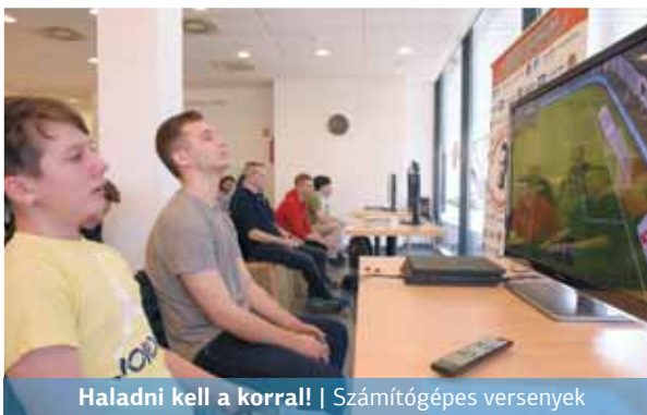
Haladni kell a korrall! | Számítógépes versenyek

Lehet azon vitatkozni, hogy az e-sport jó vagy romboló hatású-e, ám az tény, hogy a számítógépes versengés már egy ideje jelen van az életünkben, és ezzel kezdeni kell valamit. Ezt felismerve számos nagy egyesület alapított már e-sportszakosztályt. Hozzájuk csatlakozott a rákospalotai Grosics Gyula Kapuskola is, amely a kerületi egyesületek közül elsőként március elején létrehozta e-sportszakosztályát, majd március 24-én a Spirál ház Pajtás Éttermében az első versenyét is megrendezte.