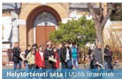
Helytörténeti sétá | Újabb ismeretek