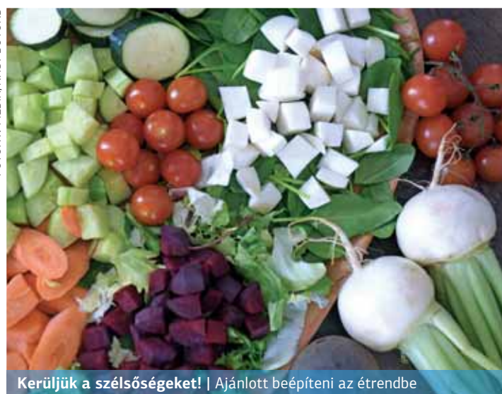
Kerüljük a szélsőségeket! | Ajánlott beépíteni az étrendbe

ha valaki csak egy élelmiszercsoportból válogat. A kizárólag növényi eredetű táplálékot tartalmazó étrendek nagyon nagy