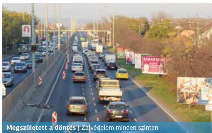
Megszületett a döntés | Zajvédelem minden szinten

régi nyílászárókat újakra cserélik, hogy a zaj mértéke az előírt határértékeken belül maradjon – írta a főváros a beruházásról kiadott közleményében tavaly. A kivitelezéssel kapcsolatban meg-