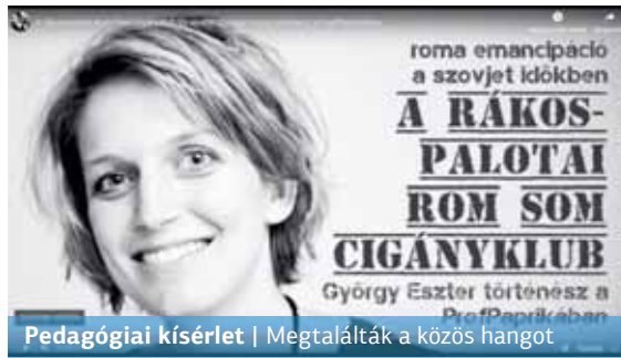
Pedagógiai kísérlet | Megtalálták a közös hangot

A cigányklub létrejöttére több korabeli mozgalom és