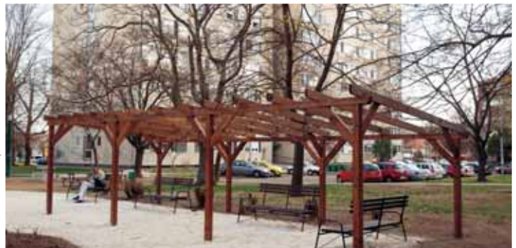
Mézeskalács tér | Kellemebb lakókörnyezet