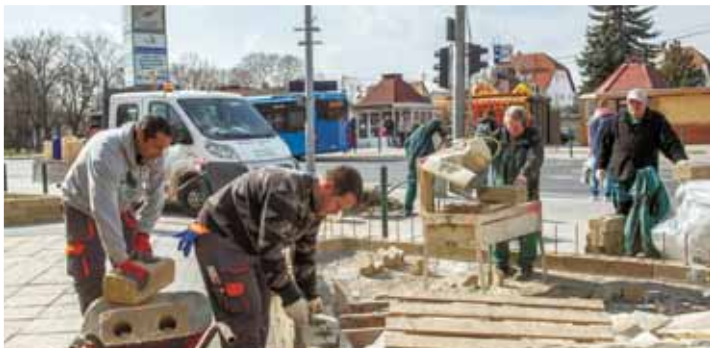
Munka a Molnár Viktor utcánál | Átalakul a fejlesztési program