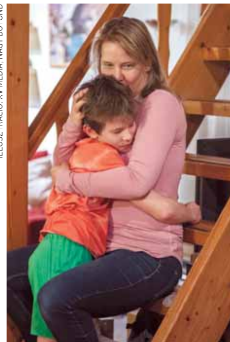
ILLUSZTRÁCIÓ: XVMEDIA, NAGYBOTOND

Persze az ember nem bújhat ki a bőrből, egy-egy hirtelen felcsattanás azért előfordul, de azután gyorsan, az