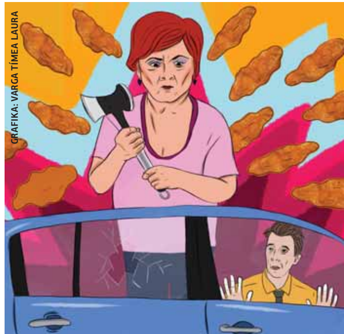
GRAFIKA: VARGA TÍMEA LAURA

Egy családi vita fajult garázdaságig az egyik kerületi úton. A férfi éppen megállt a piros lámpánál, amikor észlelte, hogy az őt követő nőismerőse autójával hátulról nekiütközik. A nő ezt követően kiugrott a kocsijából, majd a férfihez lépve egy húsklopfolóval bevverte mindkét bal oldali ablakát. A nő ellen felfegyverkezve elkövetett garázdaság miatt indult eljárás.