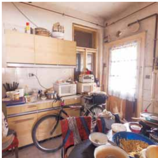
ILLUSZTRÁCIÓ: XV MÉDIA, VARGOSZ

Valóban, ő már csak tudja, hiszen Berettyóújfalui környékén nap mint nap szembesül azzal a ténnyel, mennyire nincs esélyük, sőt reményük a minőségi életre a halmozottan hátrányos helyzetűeknek. Szóba kerültek az oktatás, a szociális szféra és az egészségügy egymással párhuzamosan futó, egymást erősíteni képtelen programjai. A közmunka átka, az uszorakamat, mely tátongó mérhetetlen űrt kovacsol a