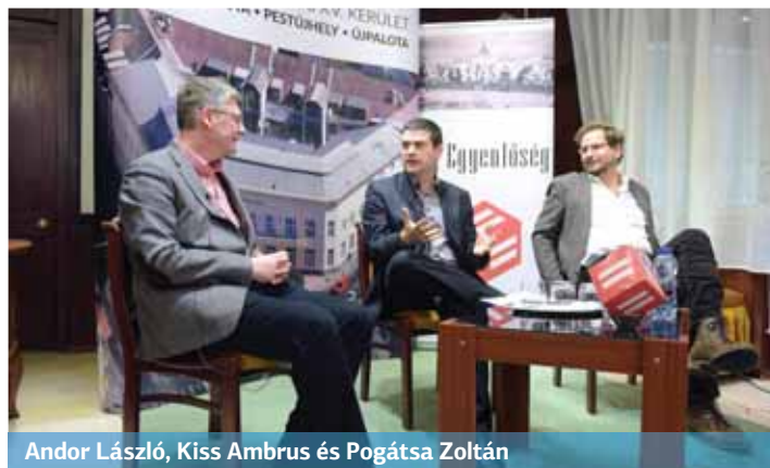
Andor László, Kiss Ambrus és Pogátsa Zoltán

Városházi esték címmel indult közéleti rendezvénysorozat az Új Egyenlőség magazin szerkesztőségében. Első alkalommal, január 23-án az elmúlt nyolc év gazdaság- és bérpolitikája volt a téma. Az érdeklődők megtöltötték a hivatal házasságkötő termét, ahol Németh Angéla polgármester köszöntője után Andor László, az Európai Bizottság egykori biztosa és Pogátsa Zoltán közgazdász, szociológus Kiss Ambrus moderálásával közérthetően beszélgettek ezekről a komoly szakmai témákról.