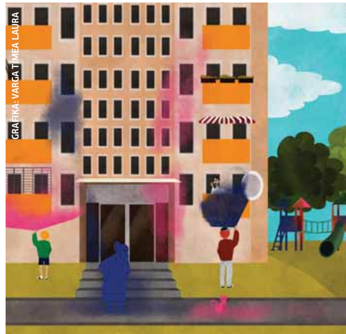
GRAFIKA: VARGA Tímea LAURA

Festékpattinnal rongált meg egy házat egy fiatalos és egy gyermekkorú fiú az Erdőkerülő utcában. A két elkövető a ház homlokzatát 3 méter, az oldalát pedig 10 méter hosszan firkálta tele különböző feliratokkal.