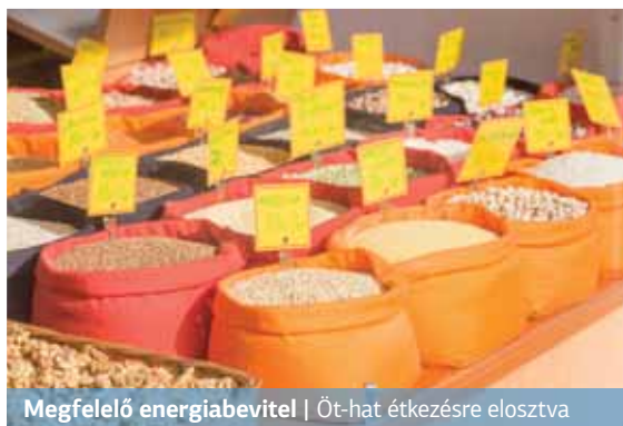
Megfelelő energiabevitel | Öt-hat étkezésre elosztva

– A rendszeres testedzést azért nem úszhatjuk meg, mert ez növeli a sejtek inzulinérzékenységét. Így az IR terápiájának egyik alappillére a kardio- és erősítő edzés is magába foglaló rendszeres testmozgás, a másik pedig a megfelelő