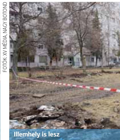
Illemhely is lesz

és egy 400 méteres futókört is épít a meglévő játszótér mellett – sorolta Tóth Imre alpolgármester.