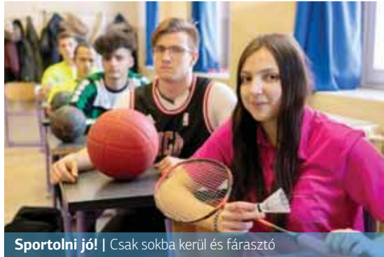
Sportolni jó! | Csak sokba kerül és fásasztó

A megkérdezettek 73 százaléka sportolt hivatalosan egyesületi vagy iskolai csapatban az elmúlt években, de jelenleg csak egy fiatal jár rendszeresen edzeni. Az eddig kipróbált sportágak