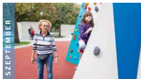
SZEPTEMBER Őszel Újpalotán végre birtokba vehette a lakosok apraja-nagyja a Nemzedékek Parkját.