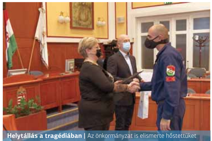
Helytállás a tragédiában | Az önkormányzat is elismerte hőstettüket