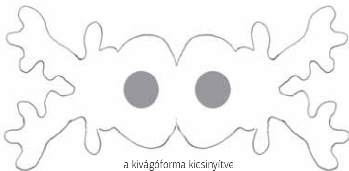
a kivágóforma kicsinyítve