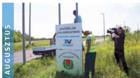
AUGUSZTUS Nyártól kerületszerte új táblák köszöntik a városrészebe érkezőket.