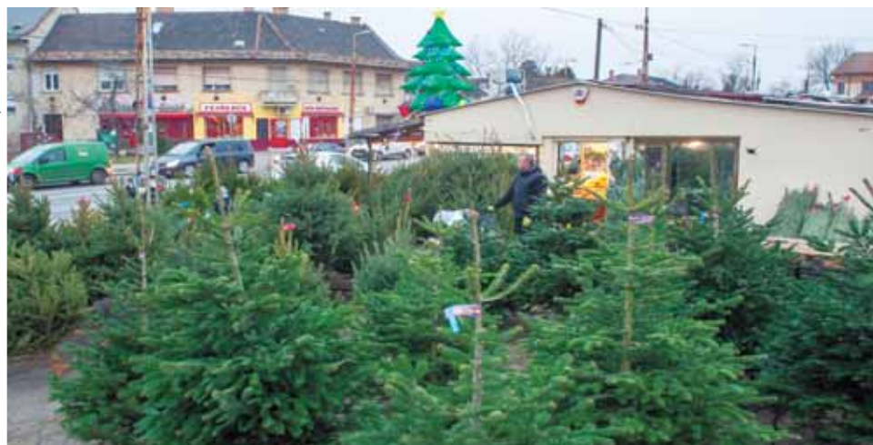
Idén is gazdag lesz a választék | A legtöbben még mindig élő fát vásárolnak

Ha van hely, ahová az ünnepek múltával kiültethetjük a fenyőfát, akkor választhatunk földlabdást is. Ezek 60-80 centiméteres magasságtól kaphatók: a lucfenyő 5000-7000, az ezüstfenyő 6000-10 000, míg a nordmann 6500-12 000 forinttól vásárolható a kertészetekben. Fontos, hogy a fa hidegről melegbe költöztetésekor ne kapjon hősokkot. Adjunk a fának kellő időt az akklimatizációra, különben elpusztul. Ehhez néhány nap, esetleg 2 hét szükséges, attól függően, hogy odakint mennyire alacsony a hőmérséklet.