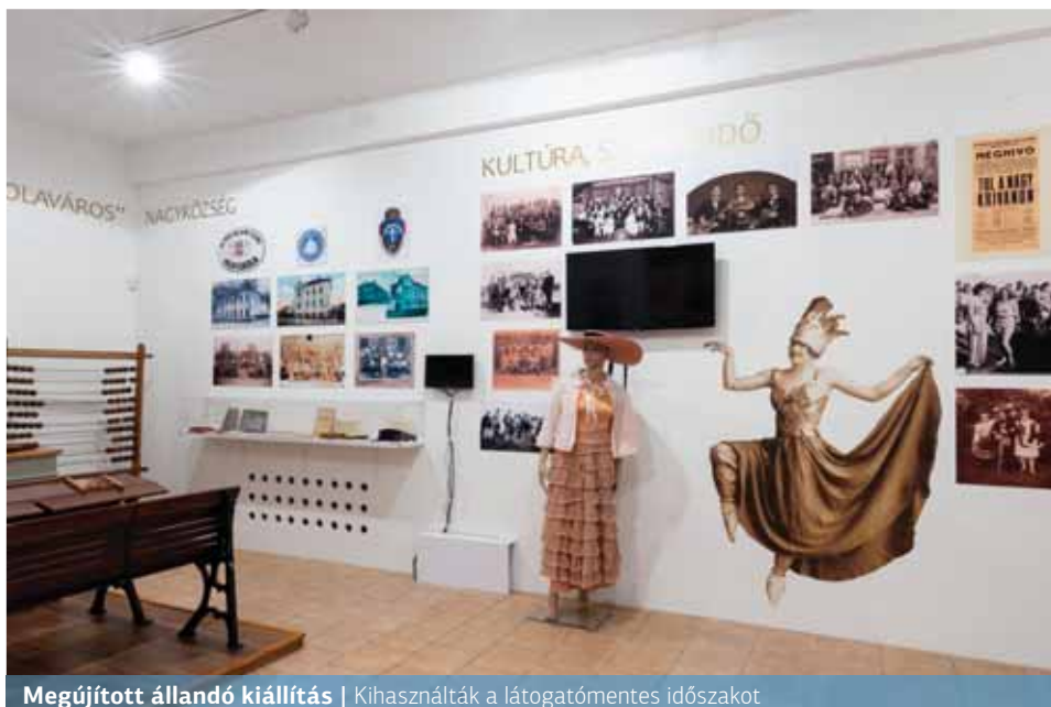
Megújított állandó kiállítás | Kihasználták a látogatómentes időszakot

Idén teljesen megújult a Rákospalotai Múzeum „Pestújhelyi szoba” című állandó kiállítása. A változásra mind a látogatóközönség, mind pedig a kurátorok részéről igény mutatkozott.