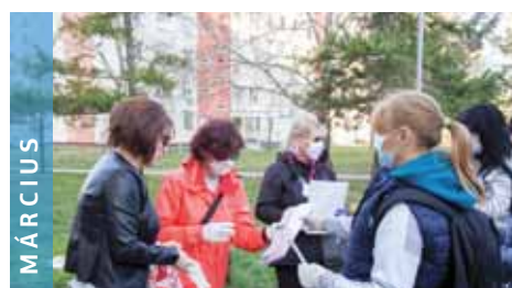
MÁRCIUS Tavasszal a koronavírus elérte Magyarországot. Az önkormányzati dolgozók bevásárlással segítettek.