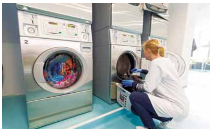
Mosoda a Spirálházban | Szín szerint leválogatva kell leadni a ruhákat

A vírushelyzethez igazodva, meghosszabbított nyitvatartási idővel várják a vendégeket, akik a szín szerint leválogatott ruháikat a bejáratnál