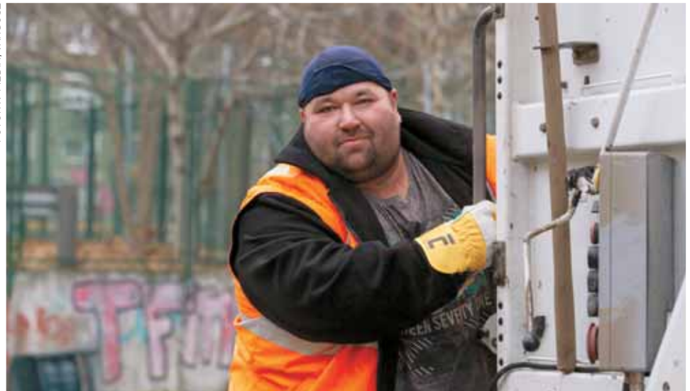
Komposzt lesz a zöldhulladékból | Télen a legtöbb munkát a karácsonyfák begyűjtése jelenti