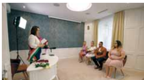
Megújult az önkormányzat házasságkötő terme. Immár modern környezetben mondták ki a boldogító igent.