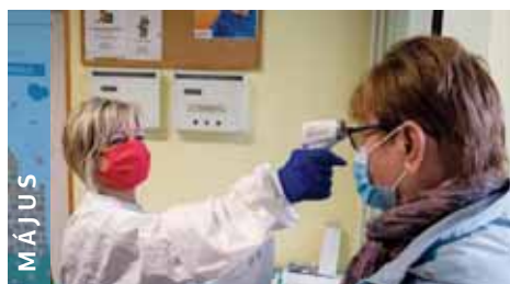
MÁJUS Szinte leállt az egész ország. Egészségügyi óvintézkedéseket vezettek be a kerületben is.