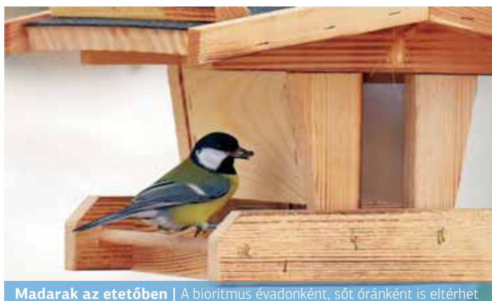
Madarak az etetőben | A bioritmus évadonként, sőt óránként is eltérhet

jellemző enyhe, fagy- és hómentes késő őszi és teleken a madarak könnyebben találnak táplálékot, ezért kevésbé húzódnak be a lakott területekre.