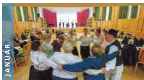
JANUÁR Az év elején a kerület horvát testvérvárosunk küldött-ségét látta vendégül.