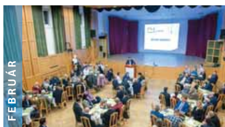
FEBRUÁR Városrészi vállalkozói is összeültek egy közös gondolkozásra.