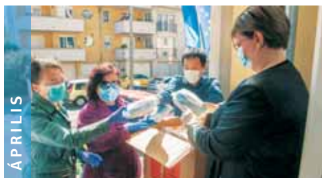
ÁPRILIS A védekezéshez adományok érkeztek külföldi partnereinktől és helyi civil szervezetektől.