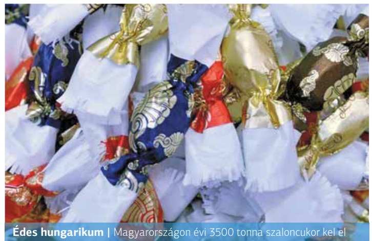
Édes hungarikum | Magyarországon évi 3500 tonna szaloncukor kel el

Az év kézműves szaloncukra ezúttal a Kézműves Cukrászda mogyorónugátos tejszokoládés termé-