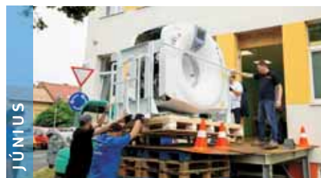
JÚNIUS A nehéz időszak ellenére tovább fejlődött a kerület. Megérkezett a csúcstechnológiájú CT-gép.