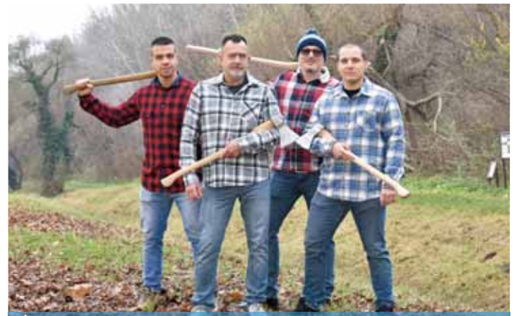
Átvágják a problémákat | Felajánlják segítségüket a kerületi időseknek