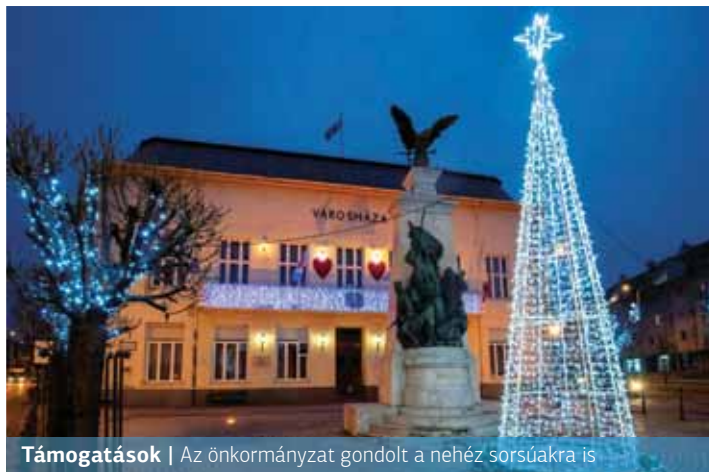
Támogatások | Az önkormányzat gondolt a nehéz sorsúakra is