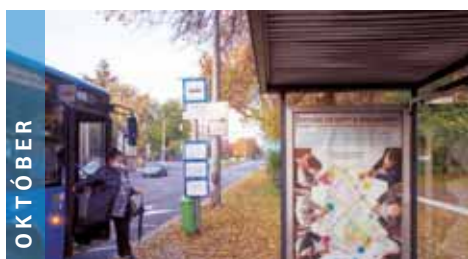
OKTÓBER Óvintézkedésként online térben indult el a „Tizenöt 2035” hosszú távú fejlesztési koncepció egyeztetése.