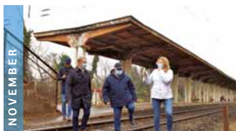
NOVEMBER A kerület Újpesttel közösen tiltakozik az ellen, hogy a MÁV Zrt. lezárta az istvántelki felüljárót.