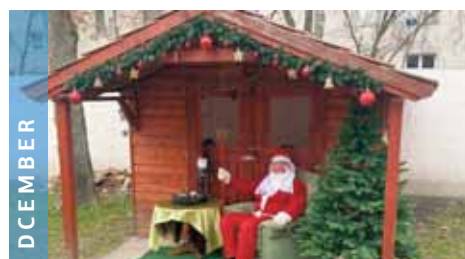
DECEMBER A járvány második hullámában az udvaron fogadta az ESZI Mikulása az ünneplőket.