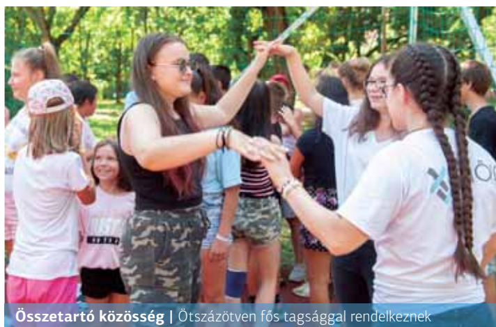
Összetartó közösség | Ötszázötven fős tagsággal rendelkeznek

A Nagycsaládosok Újpalotai Egyesülete 100 forintos ruhavásárt tart a lakosság részére szeptember 5-én, szombaton 9–12 óra között az Árendás köz 2–4. szám alatt. Bejárat a Szobabérlők háza mögött. A bevételt a családok (100 fő) októberi nyíregyházi állatkerti kirándulására fordítják.