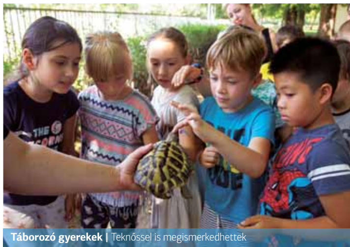
Táborozó gyerekek | Teknőssel is megismerkedhettek

Vércsével, teknőssel, kismacsával és kutyával ismerkedhettek meg a Hartyán Általános Iskolában táborozó gyerekek az állattartásról szóló előadás keretein belül. Bár sokan azt gondolják, panellakásban nem érdemes állatot tartani, ez téves elgondolás. A titok mindig az, hogy az adott faj igényeit előre fel kell térképezni,