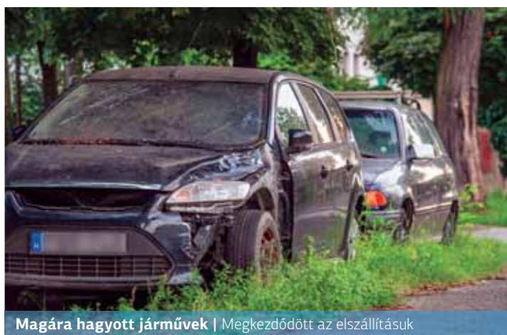
Magára hagyott járművek | Megkezdődött az elszállításuk

A lakótelep parkolási gondjait is tovább súlyosbította, hogy az elhagyott autók által elfoglalt he-