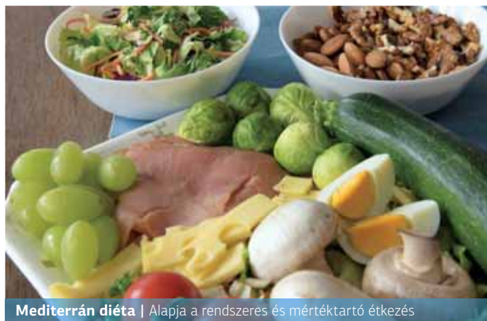
Mediterrán diéta | Alapja a rendszeres és mértéktartó étkezés

A mediterrán diétának évezredek hagyományai vannak, azonban a Földközi-tenger területén élő lakosság étrendjét összefoglaló kifejezést csak a XX. század második felétől használják. A világörökség részévé nyilvánított étrend a táplálkozástudósok szerint a világ egyik legegészségesebbike, emberek milliói a legfinomabbnak rangsorolják.