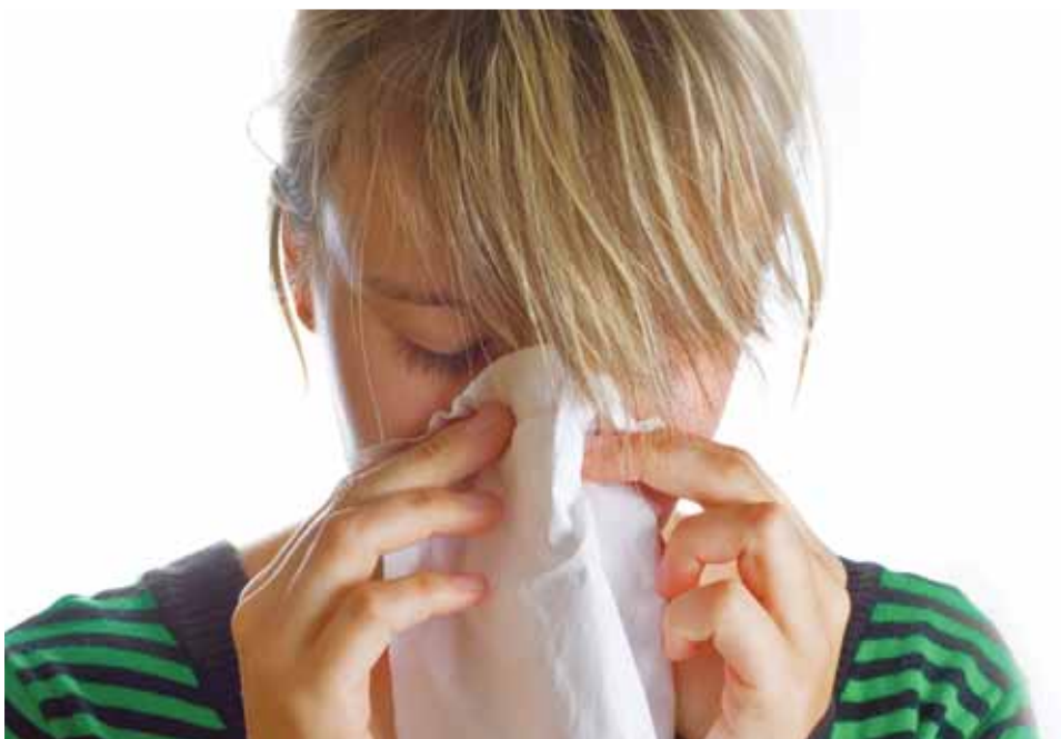
Megkezdődött a parlagfűszezon | Nő az allergiások száma

Augusztus 20. nemcsak a magyar történelemben fontos, hanem egészségügyi szempontból is kiemelkedő dátumnak számít. A tüdőgyógyászok, allergológusok ugyanis innentől számítják a parlagfűszezon kezdetét.