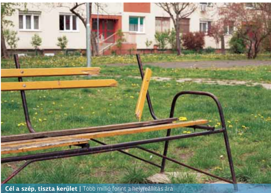
Cél a szép, tiszta kerület | Több millió forint a helyreállítás ára

„Az esetek kis részénél haladja meg az okozott kár értéke az 50 ezer forintot, de éves szinten már