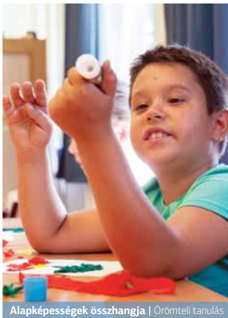
Alapképességek összhangja | Örömteli tanulás

A térirányok felismerése térben és síkban elengedhetetlen feltétele az írás, olvasás megtanulásának. Reprodukáló képesség térben és síkban előfeltétele annak, hogy a gyermek le tudja utánozni, másolni a látott mozdulatot, térbeli konstrukciót, vagy a síkban alkotott mintát. A tanulás egyik legfontosabb útja az utánzás, másolás.