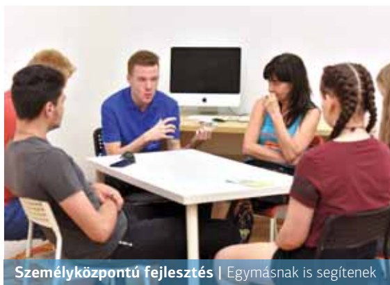
Személyközpontú fejlesztés | Egymásnak is segítenek

Hátrányos helyzetű fiataloknak nyújt ingyenes tanulástámogatást, csoportos foglalkozásokat, szabadidős programokat és közösségi teret a KOMA Bázison működő KOMA Labor. A jelentkezés, bekapcsolódás folyamatos egész évben.