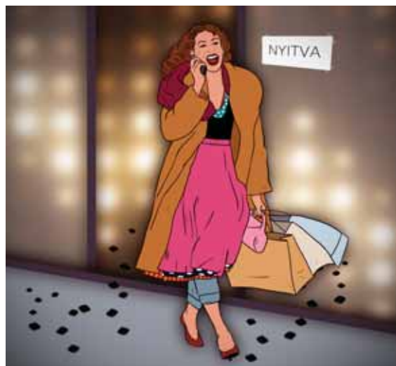
GRAFIKA: VARGA TIMEA LAURA

Egy húszéves nő próbált meg fizetés nélkül távozni az egyik kerületi divatüzletből. A nő több ruhát is magához vett, azokat bevitte a próbafülkébe, majd erőszakos módon eltávolította róluk az áruvédelmi eszközt, a ruhákat betette a táskájába és megpróbált távozni az üzletből. Az ott dolgozók azonban észlelték a lopást, ezért a nőt fel tartották és elszámoltatták. Ennek során elő is kerültek a táskájába rejtett ruhák, amelyek az áruvédelmi eszköz kitépése miatt oly mértékben megrongálódtak, hogy eladhatatlanná váltak. A gyanúsított a kérkező rendőröknek elismerte a bűncselekmény elkövetését. ♦