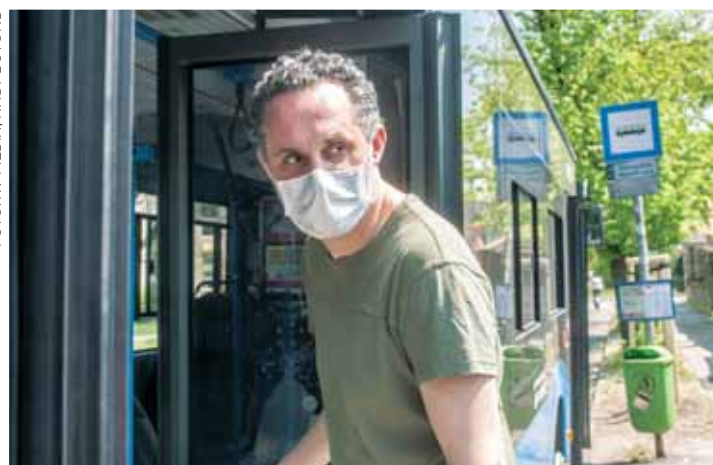
Lazult a fegyelem | Utaskoordinátorok ellenőrzik a szabály betartását

Aki a kötelezettséget ezek után is figyelmen kívül hagyja, ezzel