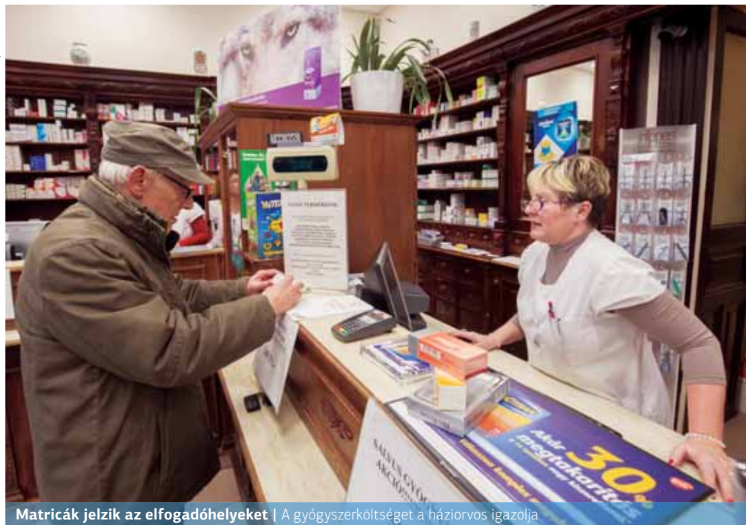
Matricák jelzik az elfogadóhelyeket | A gyógyszerköltséget a házi orvos igazolja

Az önkormányzat jövedelemtől függően havi 3000 és 7000 forint