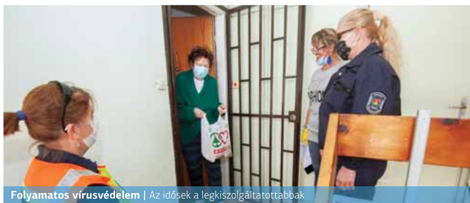
Folyamatos vírusvédelem | Az idősok a legkiszolgáltatottabbak

„Mindent meg kell tenni annak érdekében, hogy elkerüljük a szokásostól eltérő oktatást és megvédjük a hagyományos, iskolai jelenlét